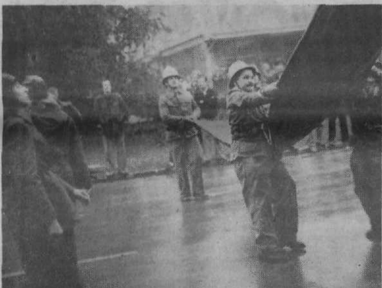
Gasilska enota v Javnih skladiščih je dokazala svojo dobro pripravljenost in v dveh minutah je bila spustnica nared za reševanje iz gorečega upravnega poslopja.