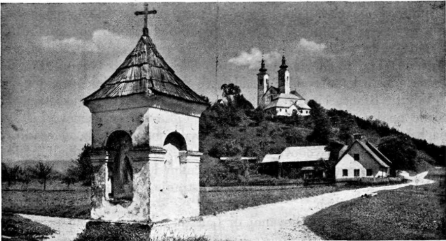
Božji grob pri Pliberku

V tem tednu doživimo oni tragičen vihar, ki je predhodnik Vstajenja. Vsa drama Gospodova — od vzklikajoče množice Jeruzalema, do oljčnega vrta Getzemane, od vonjavega mazila v alabastrnih vrčih v hiši Betanije, do v kisu namočene gobe na zaničujočem lesu.