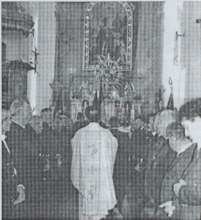
Lovci pri maši

Obdobje takoj po vojni je bilo za divjad ugodno, zlasti številni so bili zajci in veverice. Kasneje, zlasti še po letu