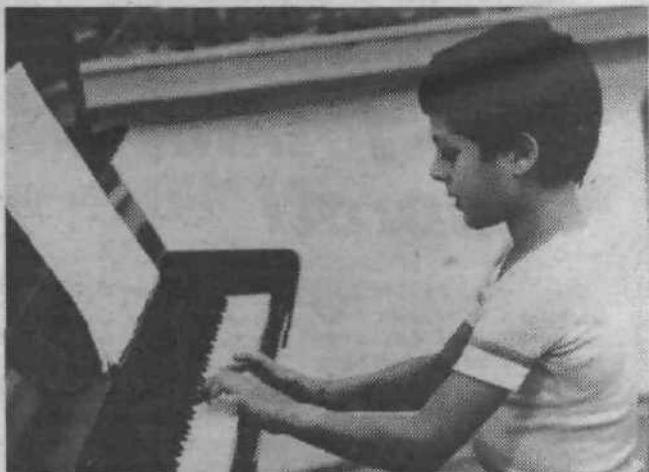
Zaključek šolskega leta so pričekali tudi učenci glasbene šole Franca Šturma. Naše slika prikazuje mladega pianista, ki je na končnem nastopu starejšim in součencem pokazal, kaj se je naučil v minulem šolskem letu.