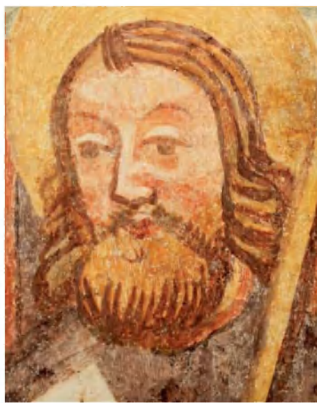
Detajl poslikave pred in po posegu.