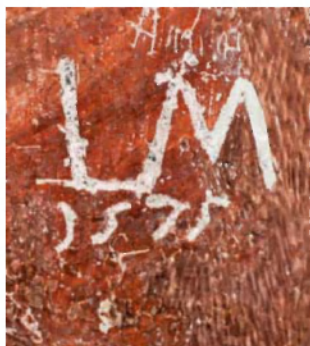
Grafit s podpisom in letnico 1575.

stoletja (npr. 1575), kar je kmalu po nastanku fresk. Zaradi svoje starosti in pričevalnosti tako poškodba postane predmet zaščite, kar je botrovalo odločitvi, da se grafitov ni odpravilo, ampak se jih je z ustrezno obdelavo in retušo poudarilo.