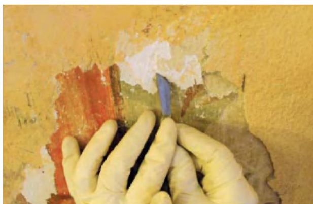
Sondiranje poslikav