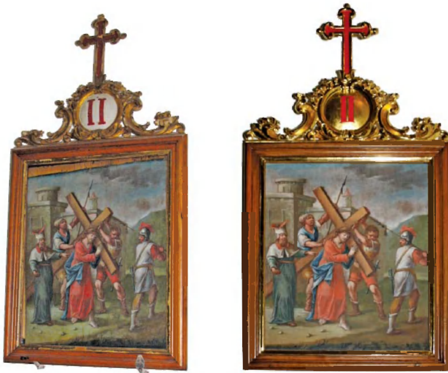
Postaja križevega pota pred in po posegu.

nami na novo oživi pisan, a umirjen in duhovno urejen svet gotskega človeka – ustvarjalca in bralca umetnin.