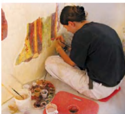
Retuširanje poslikav.