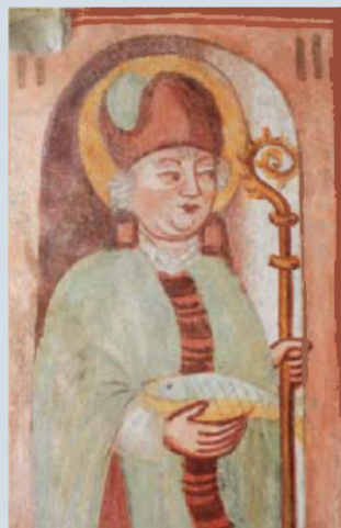
Detajl svetnika na okenski špaleti.

Freske se je zato pred posegom preventivno zaščitilo, nato se je dokončno odkrilo vse poslikane površine v prezbiteriju; sledilo je injektiranje, kitanje, utrjevanje, menjava zasteklitve v oknih, odstranjevanje slabih (neposlikanih) ometov, izdelava novih apnenih ometov, odstranjevanje umazanije z barvne plasti, rekonstrukcija nekaterih manjkajočih delov poslikave ter na koncu retuširanje (barvno dopolnjevanje) manjših manjkajočih delov poslikave. Restavratorska etika dovoljuje dopoljevati le tiste dele poslikave, ki so s slikarskega stališča predvidljivi (to so npr. ornament, manjši manjkajoči deli obleke, manjkajoči prstki, ...), ne sme pa se dopoljevati večjih nepredvidljivih