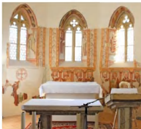
Pogled na prezbitერიj pred in po posegu.