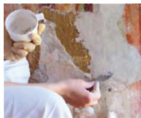
Odstranjevanje sige, mikroinjektiranje, kitanje s fino apneno malto na mestih, kjer je omet odpadel.