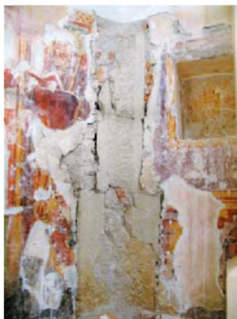
Stanje poslikav po odstranjevanju beležev in ometov kaže, da je bil velik del fresk uničen že med prezidavami prezbiterija.

Odkrivanje se je pričelo na mestih, kjer je bila poslikava stabilna (okenske špalete, delno pasovi ob oknih). Na okenskih špaletah se je na novo odkrilo šest postav svetnikov