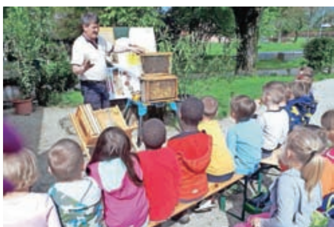
Otroci so čebelarju z zanimanjem prisluhnili.

ske opremo), kako čebelarji označijo matico v panju, kakšen pomen imajo čebele v našem življenju in življenju našega planeta nasploh. Deležni smo bili tudi dobre pogostitve, domačih medenjakov, soka. Poskusili smo tudi satje, ki je bilo prepojeno z medom, tekoči med, kristaliziran med, propolis in še bi lahko naštevali. Vsekakor so otrokom in tudi nam, vzgojiteljem, še bolj približali poklic čebelarja in samega pomena čebel. Za piko na i pa so nas presenetili s prisotnostjo telička, petelina, kokoši in psa z mladitcem. Z obraza sta nam ob vrnitvi »sijala« sreča in zadovoljstvo.