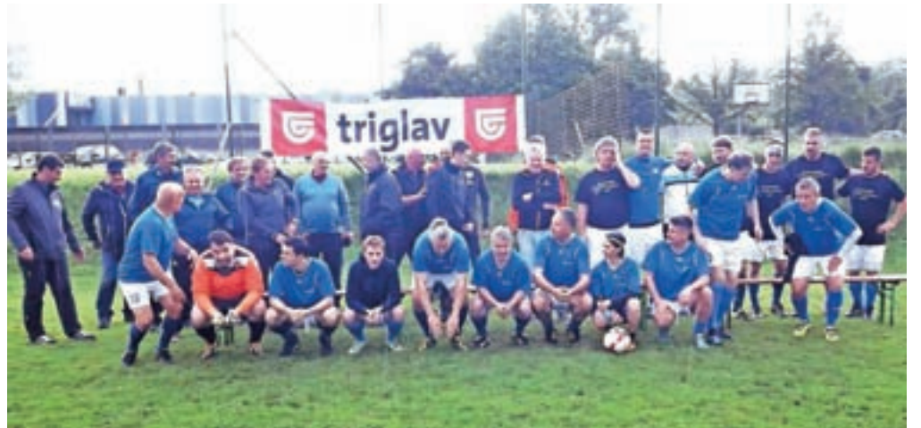
Udeleženci letošnjega srečanja športnikov in medijskih osebnosti Slovenije