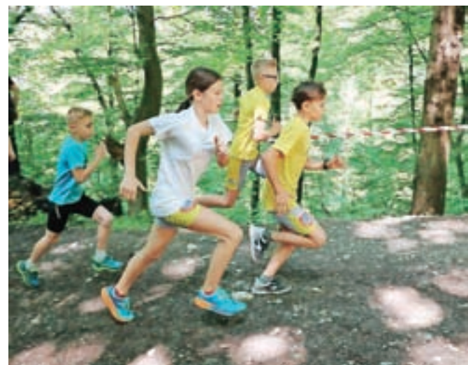
Tekli so tudi otroci.