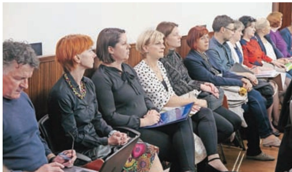
Majske seje so se udeležili tudi direktorji in drugi predstavniki javnih zavodov, ki so predstavili poročila za lansko leto.