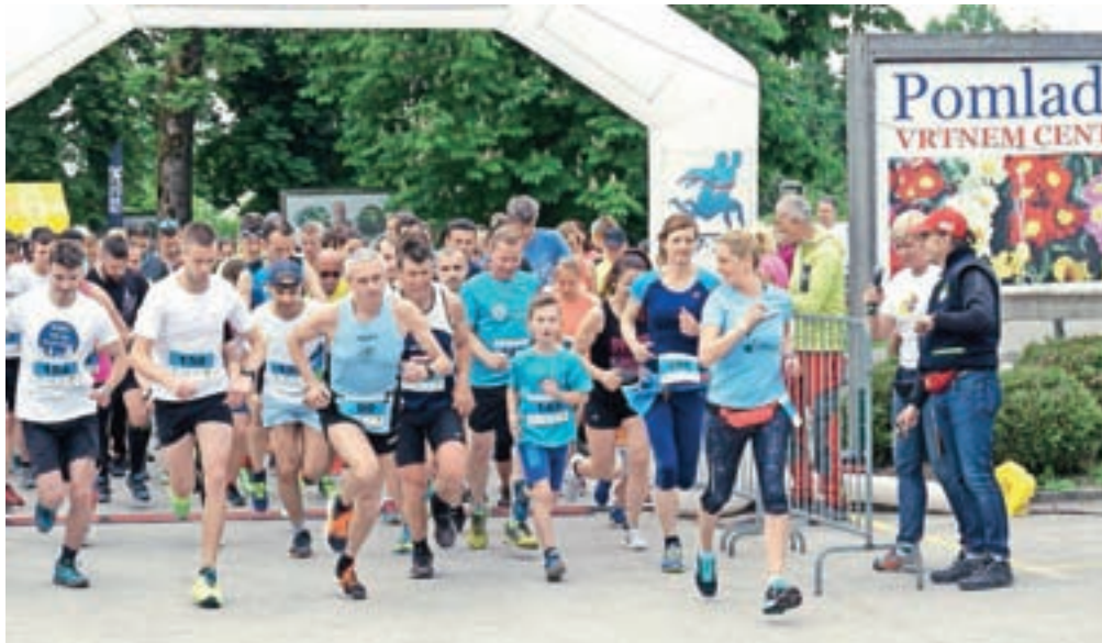
Dobrodelnega teka ob Kamniški Bistrici se je udeležilo več kot 130 tekačev.

Tradicionalni dobrodelni tek, ki je imel start in cilj v Arboretumu Volčji Potok, je tudi letos potekal po zeleni osi Kamniške Bistrice. Več kot 130 udeležencev vseh starosti je teklo po pet- in desetkilometrski progi ob Kamniški Bistrici, obenem pa so pripravili tudi tek za osnovnošolce v dolžinah 300, 600 in 800 metrov. Zbrana sredstva od startnin vsako leto namenijo v dobrodelne namene. Letos je donacijo 1200 evrov Lions klub Kamnik namenil Gorski reševalni službi Kamnik, Lions klub Domžale pa enak znesek Alji in Mihi iz Žej pri Sveti Trojici, ki zaradi akromatopsije živita v črno-belem svetu.