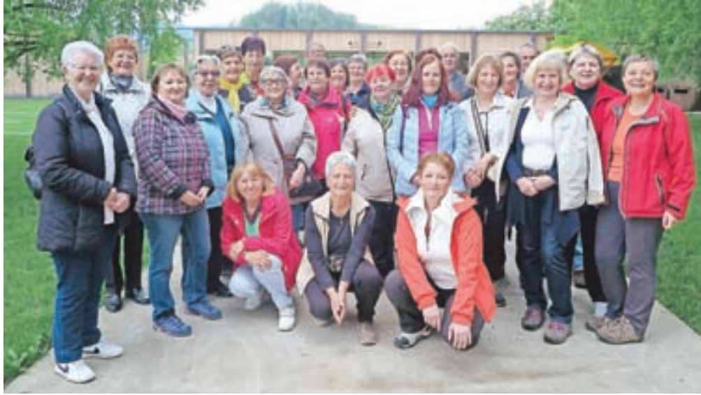
Člani kamniške skupine telovadbe za starejše Mladi po srcu