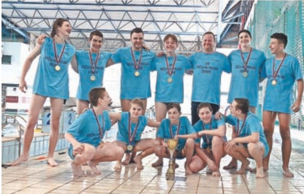
Ekipa Vaterpolskega društva Kamnik do 15 let je osvojila naslov državnih prvakov.

V nedeljo, 26. maja, je bil zaključni turnir za kategorijo do 15 let. Turnir je postregel z dvema lahkima polfinalnima tekmama, Triglav je premagal Slovan Ljubljano z 20:7, Kamnik pa je odpravil Branik z 22:7. Tekma za tretje mesto je bila odločena po streljanju petmetrovk, ekipa Slovan Ljubljana je izenačila pet sekund pred koncem tekme in nato zmagala z 10:6. Pred finalom se je vedelo, da sta ekipi Kamnika in Triglava