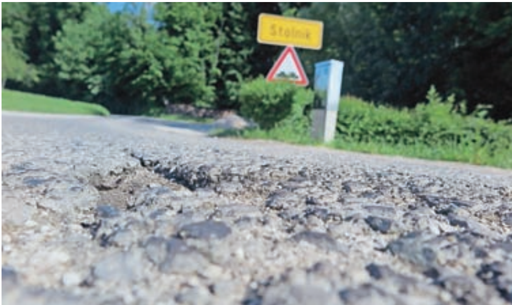
Prav vsaka krajevna skupnost v občini ima cesto, ki je nujno potrebna obnove. Ena takšnih je tudi cesta v Stolniku. / FOTO: JASNA PALADIN

Kamnik – Na majski seji občinskega sveta je Igor Žavbi v imenu svetniške skupine LMŠ na občinsko upravo naslovil nekaj vprašanj, povezanih s stroški zimske službe in vzdrževanjem cest. »Prvi del zime v letošnjem letu je za nami. Upamo lahko, da nam bo tudi prihodnja zima naklonjena z vremenom in za zimsko akcijo ne bo treba zagotoviti več sredstev, kot je načrtovanih v proračunu. V zimi 2017/18 žal ni bilo tako in spomladi 2018 smo bili primorani kar nekaj sredstev, ki so bila namenjena vzdrževanju cest, prerazporediti na postavko zimske akcije, saj nas je ta stala samo v letu 2018 več kot milijon evrov. Večja ali manjša poraba sredstev za zimsko akcijo tako vpliva tudi na ostale postavke v proračunu, običajno prav na vzdrževanje cest, kjer se nove razpoke, jame in usadi pokažejo po tem, ko zima odide, vsi pa si želimo, da so poškodbe čim prej odpravljene,« je dejal Žavbi, ki ga je zanimalo, koliko denarja je bilo v letošnji zimi porabljenega za zimsko službo, kaj je bilo letos že narejenega iz naslova vzdrževanja