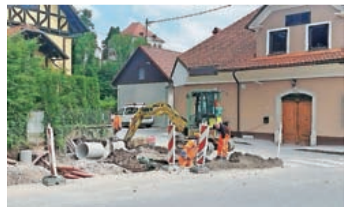
Tovorna vozila bodo odslej precej lažje zavijala v Ekslerjevo ulico.

Kamnik – V križišču Ekslerjeve ulice in Kranjske ceste te dni poteka ureditev in razširitev prometnih površin, ki bodo precej olajšale dostop tovornih vozil od podjetja Nektar Natura, s tem pa se bo izboljšala prometna varnost vseh udeležencev v prometu. J. P.