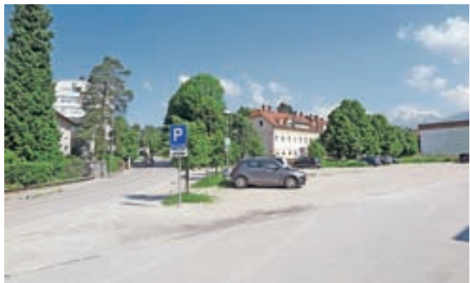
Neurejeno parkirišče med Eto in Svilanitom večkrat povzroča nevarne prometne razmere.

različnih dejavnosti, več vhodov, več avtomobilov, veliko parkirišče pa je še