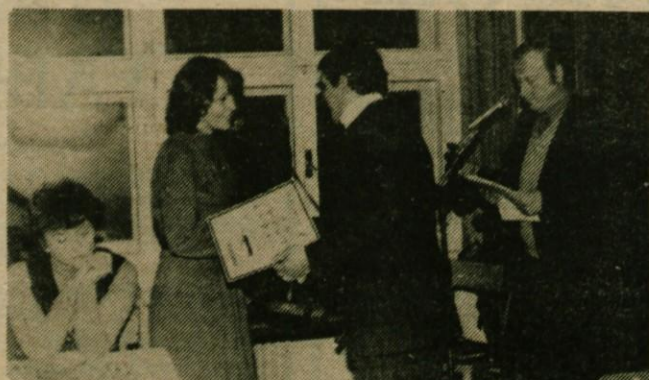
Podelitev pokalov in diplom najboljšim udeležencem sindikalnih športnih iger v preteklem letu.