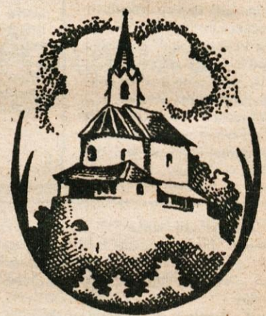
Kamniški Mali grad (kapela) - po risbi Maksima Gasparija.

telovalnici oziroma dvorani. Trenutno nimamo ničesar. Osnovnošolci ne morejo telovaditi, člani KD pa ne organizirajo nastopov. Tako OŠ kot KD želita, da bi zaprto telovalnico čimprej obnovili, vsaj do začela drugega polletja tega šolskega leta. Z obnovo nekaterih delov le bi člani dobili tudi košček svojih prostorov. Društvo se je vključilo v življenje vasi, zaživelo je z njenim utripom. Sodeluje do z osnovno šolo, pa tudi osnovnošolci nastopajo na vaških plesovih. Društvo je sodelovalo slovesni otvoritvi svetovne r