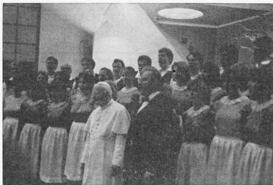
Steverjanski zbor poje pred sv. očetom

Po kratkem odmoru za kosilo v tem turističnem centru, smo nadaljevali pot