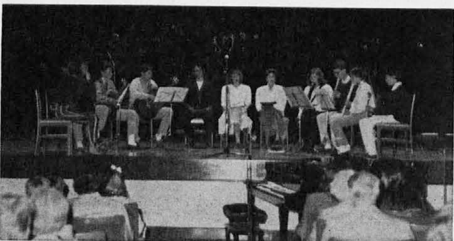
Mladi umetniki na odru v Katoliškem domu

Goriška pokrajinska uprava je v letošnjem letu organizirala pobudo Laboratorij teatra mladih. Šlo je za praktično pripravo in teoretske nauke o gledališču. Tečaj je bil v Katoliškem domu v Gorici in se zaključil 15. junija. Trajal je skoro dva meseca z lekcijami trikrat na teden. Mladina je bila navdušena. Tečaj se bo nadaljeval prihodnje jesen.