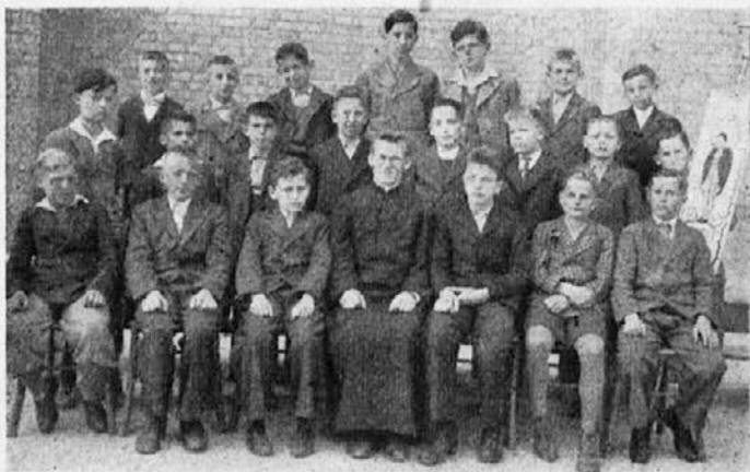
Rakovniški člani družbe sv. Alojzija.