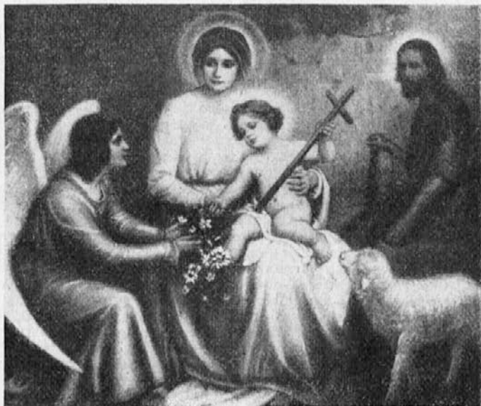
Sveta nazareška družina.