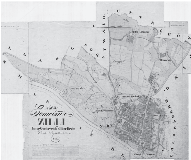
Franciscejski kataster za Štajersko, 1825, mesto Celje.

da bi v Celju potrebovali urbanistični načrt, prilagojen sedanjemu načinu življenja. Ugotovitve na delavnici sodelujočih študentk, ki so predstavljene v prispevku, je, da je bil projekt prenove leta 1988 dobro zastavljen, vendar zaradi prehitrega družbenega razvoja neizpeljan.