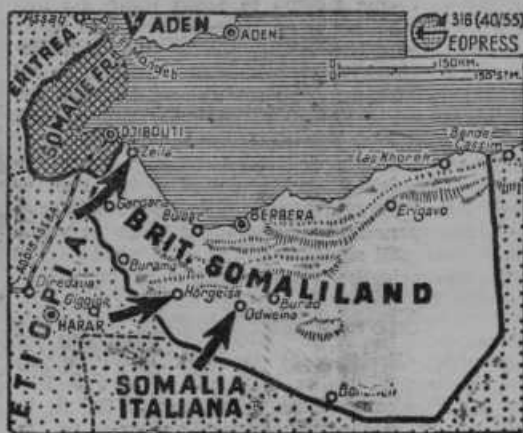
Zemljevid k italijanski ofenzivi v angleško Somalijo

Napad italijanske vojske na angleško Somalijo se je pričel v treh smereh v širini nekako 100 milj. Sedanji letni čas je za vojaška gibanja posebno težaven. Stepna pokrajina je sedaj skoro brez vode.