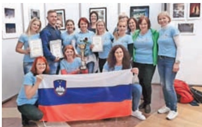
Pevke Ženskega komornega zbora Vox Annae s svojim zborovodjem