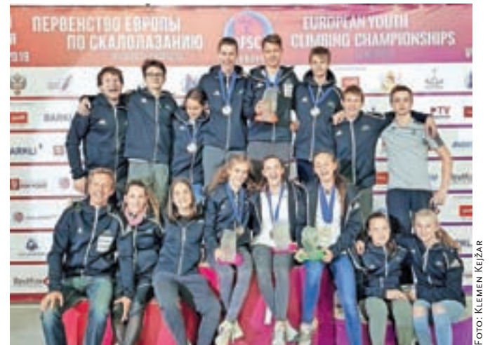
V slovenski mladinski reprezentanci v športnem plezanju so bili tudi trije člani Plezalnega kluba Kamnik.