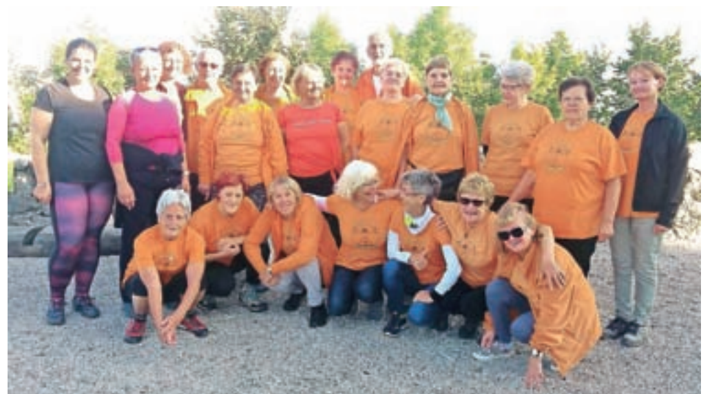
Udeleženci podgorske Šole zdravja na Starem gradu

Dogovorili smo se, da se na cilju dobimo ob 8. uri, saj se je velika večina udeležencev odločila, da bo prišla na Stari grad peš, kar predstavlja slabe pol ure hoda iz doline. Tako smo se telovadci v oranžnih majicah iz različnih smeri vzpenjali proti cilju. In za ta vzpon s 380 metrov višine, kjer leži mesto Kamnik, do 577 metrov visokega hriba, smo bili bogato nagradjeni. Pod nami je bila bela odeja