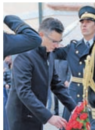
Venec je položil tudi predsednik vlade Marjan Šarec.