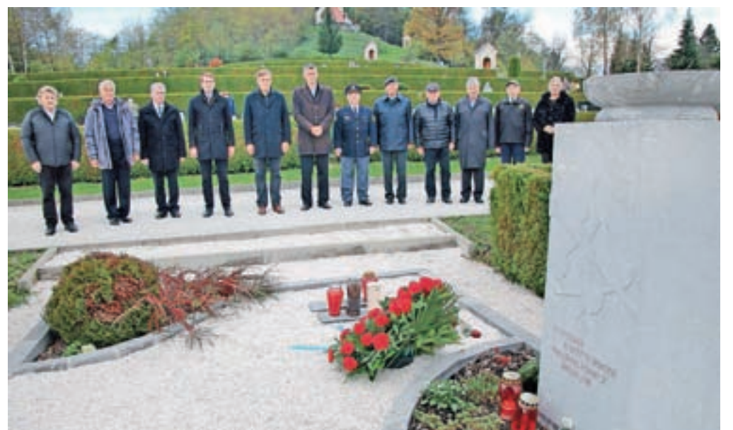
Poklon žrtvam vojn na kamniških Žalah