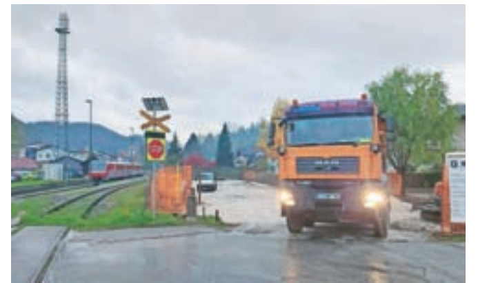
Parkirišče P+R Kamnik bo uporabnikom predvidoma na voljo že konec letošnjega leta.

rišči za osebna vozila, štiri parkirišči za invalide, štiri parkirišči za polnjenje električnih vozil, desetimi stojali za kolesa, javno razsvetlavo in kartomatom za prodajo vozovnic. Pogodbena vrednost del znaša slabih 244 tisoč evrov. Občina Kamnik je za izvedbo projekta uspešno kandidirala na javnem razpisu, zato bo projekt sofinanciran s strani Evropske unije (kohezijski sklad) in Republike Slovenije (Ministrstvo za infrastrukturo).