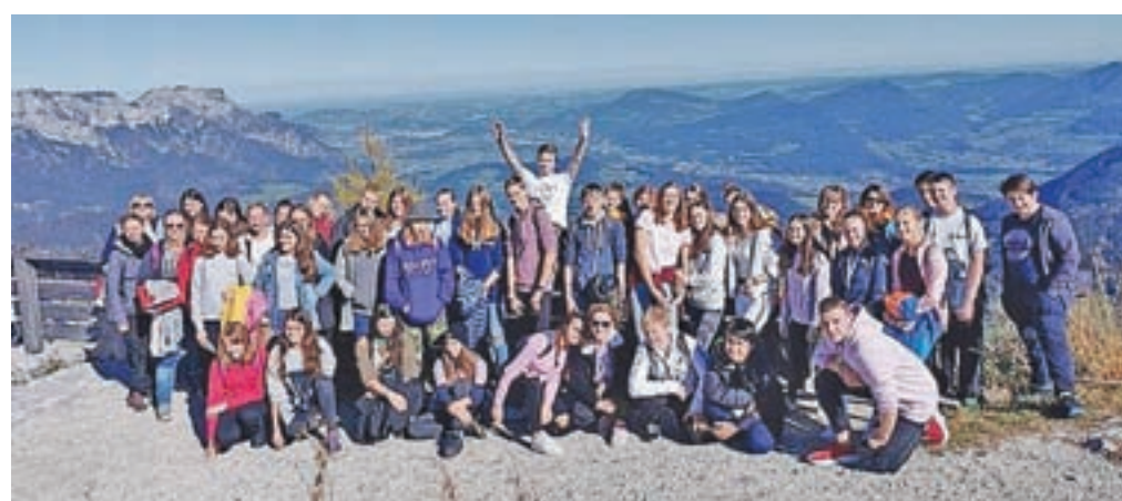
Skupinska slika udeležencev izleta

Na strokovni ekskurziji, ki je bila zanimiva in poučna, smo spoznali veliko novega.