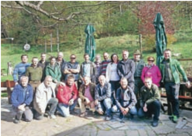
Udeleženci srečanja – posveta na Kraljevem hribu

like Plečnikove stvaritve – lovskega dvorca, Predaslja, Brsnikov in nekaterih drugih delov bistriškega gozda. Končalo se je pri Planinskem orlu z odlično malico. Poleg same predstavitve delovanja MKK so ves čas potekali tudi zelo zanimivi pogovori in izmenjava izkušenj ter mnenj glede vračanja in odškodnin, o denacionalizaciji, možnih odškodninah, problemih upravljanja gozdov in podobnem. Precej je bilo govora tudi o pripravi novega zakona o lovstvu, po katerem naj bi bilo enostavneje pridobiti pravico do svojega lovišča, ki ga sicer mogoče imeti tudi sedaj, a pod pogojem, da se upravlja več kot dva tisoč hektarov ustreznih površin.