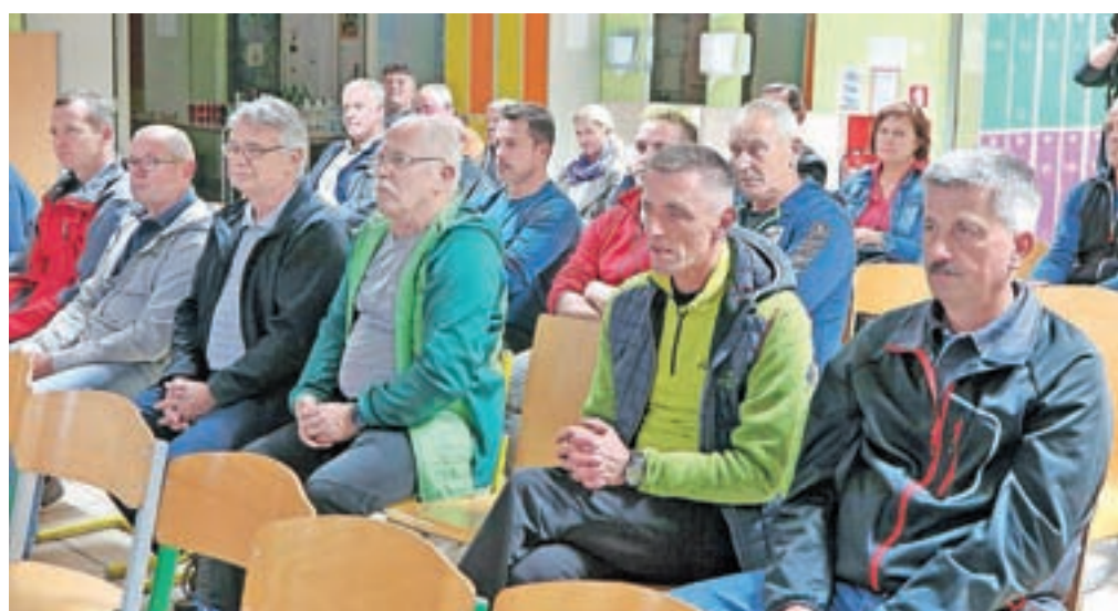
Zbora krajanov se je udeležilo približno šestdeset prebivalcev KS Kamniška Bistrica.

Kamnik – Občina Kamnik (oz. izbrani izvajalec Komunalno podjetje Kamnik) je v preteklih tednih obnovilo približno 130 metrov fekalne in meteorne kanalizacije na delu Novega trga, hkrati pa tudi vodovod in cestišče, namestiti pa so tudi javno razsvetlavo in cevi za optiko. Ves čas gradnje na odseku velja popolna zapore za promet, a dela so pri koncu, saj so v začetku tedna delavci že položili nosilni sloj asfalta, sledita le še predvidena ureditev okolice in montaža svetilk. J. P.