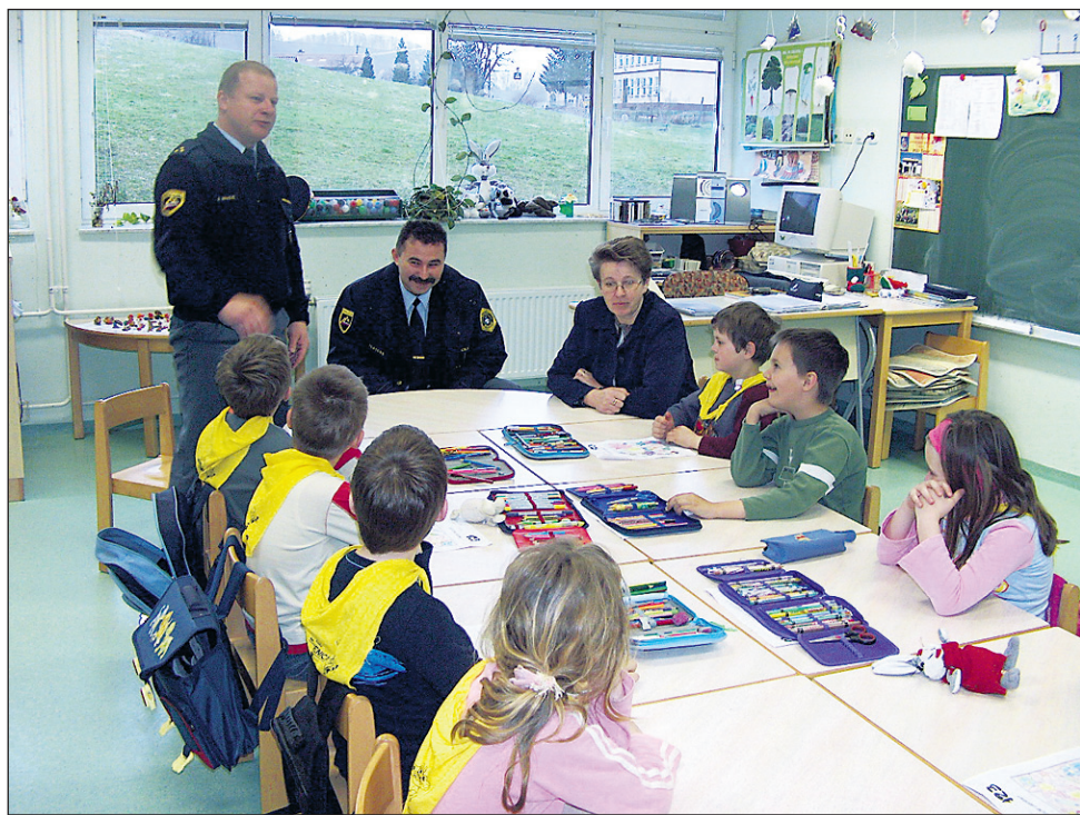
Žetalski prvošolčki so s policistoma spoznavali, kaj pomeni in kdaj lahko pokličejo interventno številko 113.