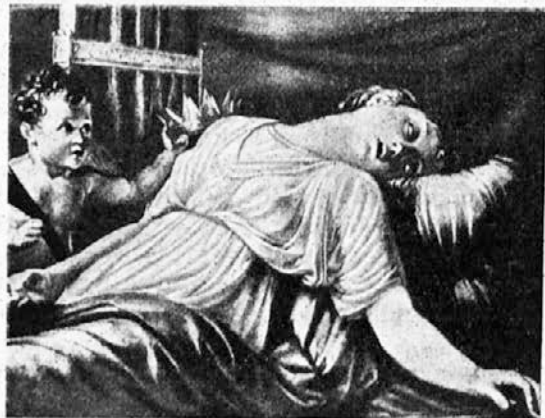
Angel varuh prinaša umirajoči Ceciliji nebeško krono.

Sv. Cecilija je gojila posebno nežno pobožnost k svojemu angelu varuhu, ki ji je zato čuval deviško nedolžnost. Posnemajte jo v tem oziru in ne pozabite nobeno jutro in noben večer zmoliti prav pobožno »Sveti angel«. In če pridejo skušnjave zoper sv. čistost, se z zaupno prošnjo obrnite k svojemu angelu varuhu.