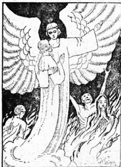
Angel nese očiščeno dušo v nebo.

5.) V olajšavo njihovega trpljenja sprejmi kako žrtev ali odpoved!