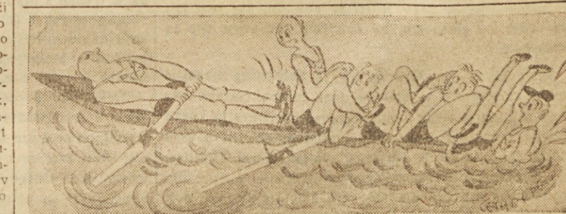
»Ali Vam nisem rekel, da je zame ta coin prekratk«