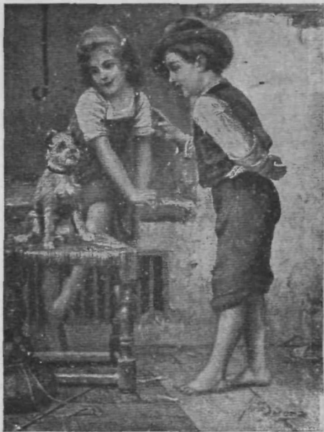
V pasji šoli!