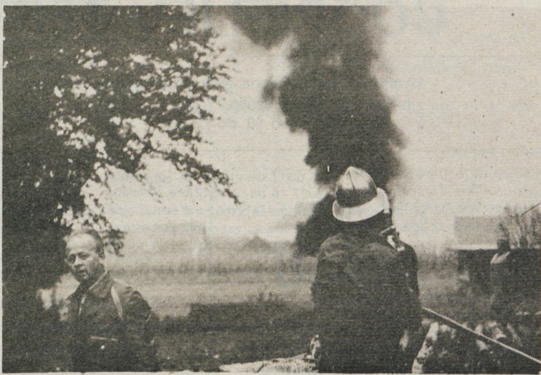
Ko je zagorelo, so bili gasilci hitro v akciji