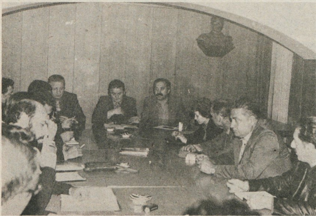
Seja odbora za LOVDS in akcija je stekla