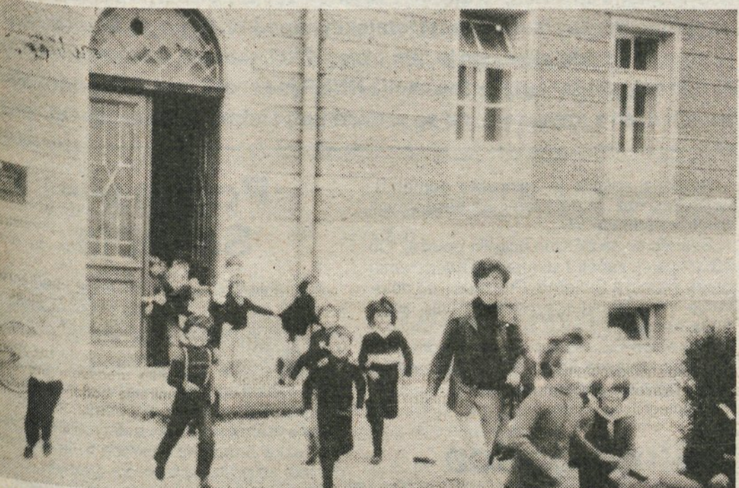
Ob bombnem napadu so učenci hitro zapustili šolo in odšli na varno mesto

Na seji smo se dogovorili, da dne 30. 9. 1979 organiziramo občinsko orientacijsko tekmovanje v sklopu akcije NNNP. To nam je tudi uspelo. Ekipe so bile 3 članske iz vsake KO ZRVS in dve ekipi