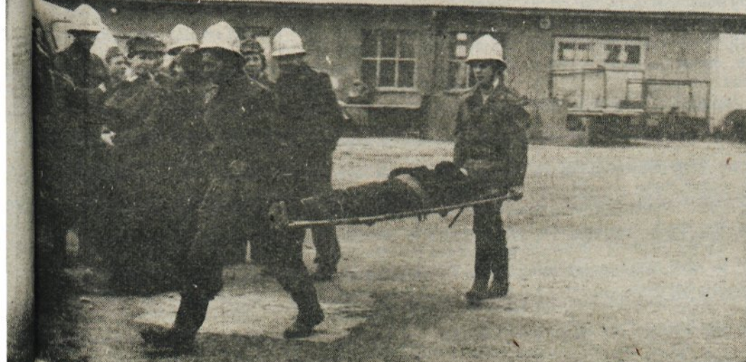
so morali prenesti na varen kraj

Velika večina občanov se je takoj odzvala na poziv. Dosledno so spoštovali vse, na kar je bilo potrebno. Dobra udeležba je omogočila, da so po končani vaji v občinskem merilu izvedli akcijo, ki so jo sami načrtovali. V akciji so bili vključeni 37 krajanov. Popravnost so vodovod in krajevne poti, ki naj bi jih nadzoroval sovražnik ob diverziji. Ravno tako so očistili vodnjake.