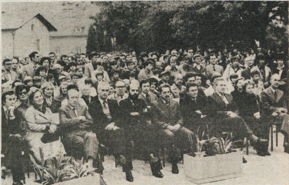
Na družbenopolitični manifestaciji ob otvoritvi prizidka k šoli Ivana Cankarja, večnamenskega objekta in prvega sodobnega zaklonišča v občini, ki je bila višek vseh aktivnosti ob akciji NNNP, se je zbralo okrog tisoč občanov.

odpravljena. Izvršni odbor Skupščine sklada je prav zdaj pred velikimi nalogami in intenzivno išče možnosti in poti, ki bi čimprej pripeljale do uresničevanja vsega pred leti postavljenega programa. Res se je ta spreminjal, toda spreminjale so se tudi razmere v naši občini. To moramo vedeti za nazaj in morda tudi za naprej. Pri tem se moramo sproti tudi kaj naučiti. Ob delu pri objektu, ki ga danes odpiramo, se je pokazalo, da ne smemo biti omahljivi. Seveda pa moramo biti tudi ustrezno organizirani. Največja napaka bi bilo pasivno opazovanje, kaj bo naredil izvršni odbor sklada. Pri uresničevanju nadaljnjega programa moramo vsi sodelovati, svoj delež mora prispevati vsak del naše občinske skupnosti. Mnogo bolj kot doslej morajo sodelovati krajevne skupnosti preko gradbenih odborov, kar med drugim zahteva tudi novi statut sklada. Dosednji moramo biti do izvajalcev gradbenih del. Za to pa je treba več kot samo pripravljenost volonterjev, treba je zagotoviti strokovno delo. Za to pomembno sestavino »odrinjeni« denar se vedno obrestuje. Tudi to se je izkazalo pri graditvi te šole,« je poudaril predsednik Skupščine