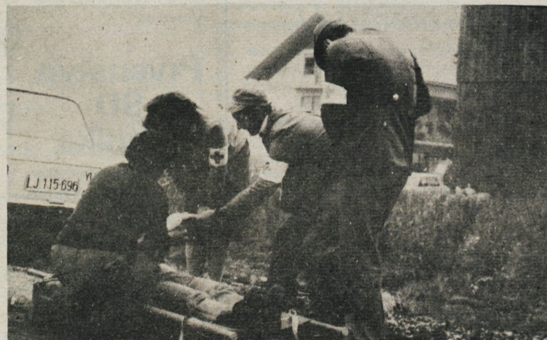
Prvo pomoč so ponesrečencem nudile ekipe prve pomoči

Pri tem velja povedati, da so vzpostavili poljsko telefonsko zvezo. Povezali so štab z najbližjim telefonom, ki je bil za to mobiliziran. Narodna zaščita je zaščitila vse pomembne objekte. Mobilizirane so bile vse enote civilne zaščite, v pripravljenosti pa je bila tudi gasilska enota, ki je za vajo intervenirala v sosednji krajevni skupnosti. Preverili so delovanje komisije za IPD, ki je organizirala distribucijo Našega časopisa. Istočasno pa so vsem krajanom posredovali gradivo, ki so ga pripravili ob akciji — opozorila in ravnanje ob alarmih.