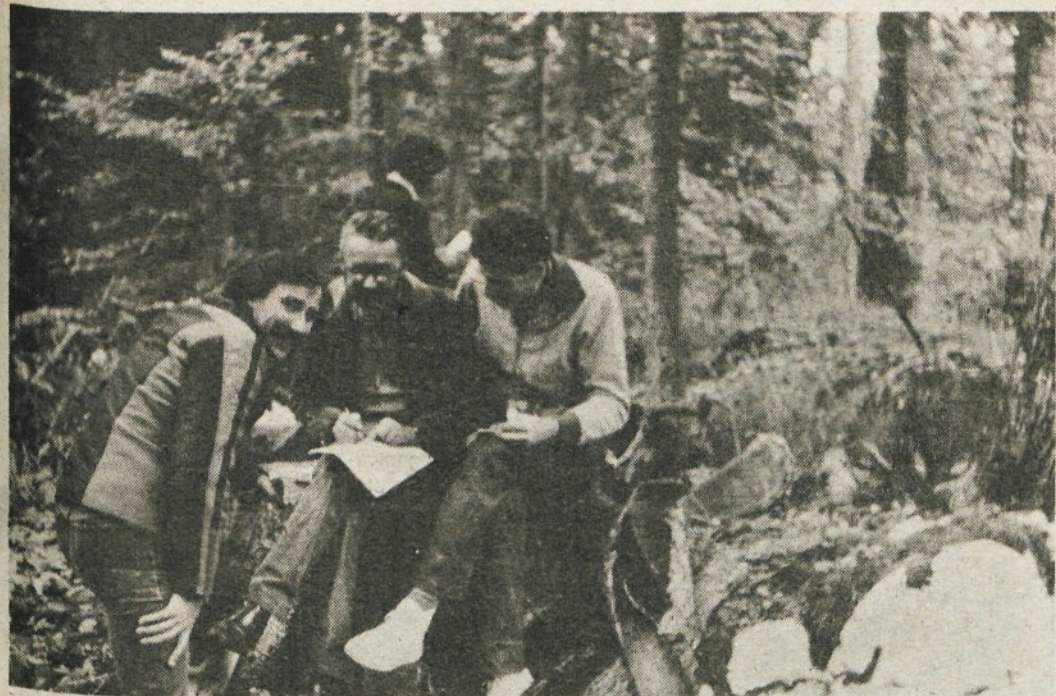
Ekipe pri reševanju topografskih in taktičnih nalog.