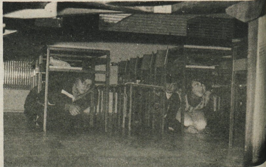
V primeru bombnega napada so učenci pod klopmi varnejši