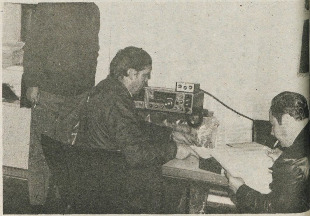
Pomembno vlogo je odigral center zvez

Že takoj zjutraj so bile zbrane vse enote civilne zaščite, razdelili so jim opremo, tako da so ob 6. uri pri pregledu enot ugotovili, da so opremljene in sposobne za akcijo.