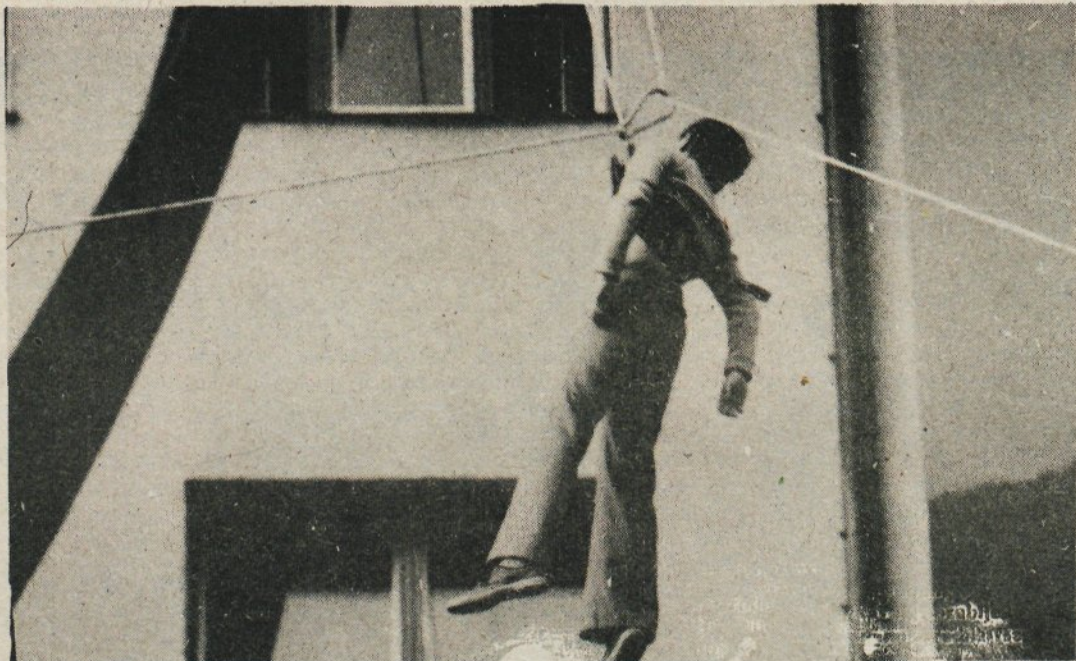
Reševanje z vrvjo je zahtevno, vendar so ga večjih KS in OZD uspešno izvedli

Že zgodaj zjutraj so začeli z akcijo. Komisija za IPD je začela izdajati informativno-propagandno gradivo in obveščati krajanke. Zato so aktivirali tudi tiskarno in tako ugotovili, da lahko hitro usposobijo tiskarno delo in seveda razpečevalno mrežo. Njihova tiskarna pa je služila tudi potrebam Bevke.