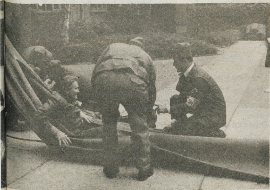
di reševanje iz višjih nadstropij so pripadniki CZ dobro izvedli