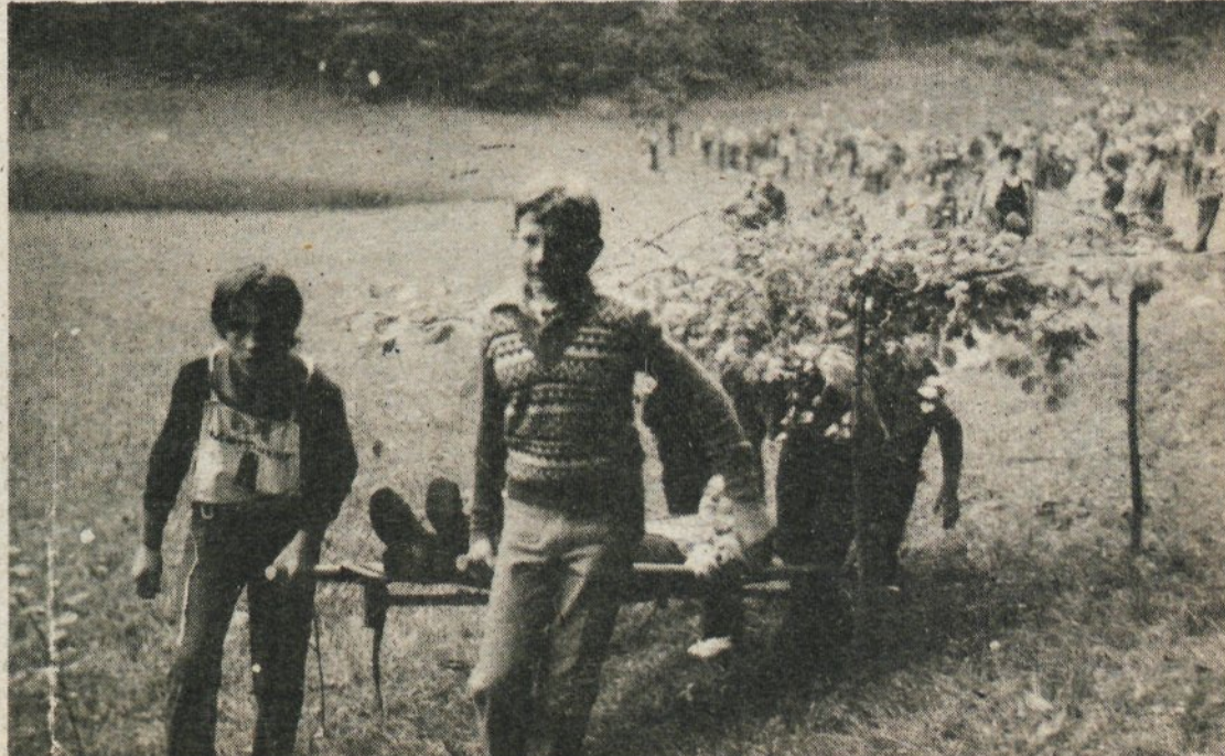
nato pa so nudili pomoč ponesrečenim ob napadu