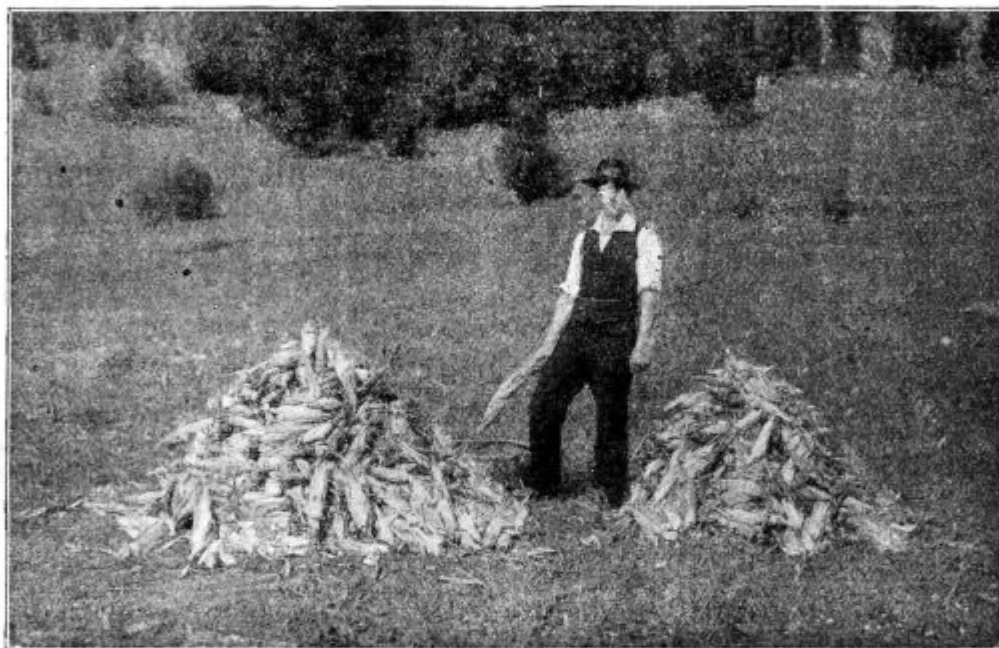
Pod. 47. Uspeh gnojenja z mešanim umetnim gnojilom Kas pri koruzi. Na levem kupu s pognojene parcele od 300 m 2 je za 62% več strokov, kot na desnem kupu z negnojene enako velike parcele.

Končno je treba vedno iznova opozarjati na varčevanje . Varčuje naj država, varčuje naj narod. V prvi dobi po vojni se je vsled pogrešnega razumevanja obilice denarja, ki je sledila padanju denarne vrednosti, posebno po mestih razvilo razkošno življenje, a se je isto kmalu začelo opažati tudi izven mest. Na delo in varčevanje se je takrat mnogo premalo mislilo. Streznjenje je kmalu sledilo. Stvarno je dolgotrajna vojna uničila ogromna bogastva, iz česar sledi, da je treba po vojni mnogo, mnogo skromnejše življenje, kakor smo ga poznali pred vojno. Več delati in manje uživati, k temu nas silijo povojne gospodarske razmere, in tega se mora zavedati narod in se mora zavedati država. Stalno naraščajoči državni proračun dokazuje, da je državna uprava samo v tem pogledu hodila istotako napačna pota kakor po veliki večini poedinci. Preden bo prepozno, treba kreniti na drugo pot. V državnem gospodarstvu se je to že začelo uvaževati; potrebno pa je, da politiko varčevanja usvoji tudi narod, da jo usvoji vsak poedinec.