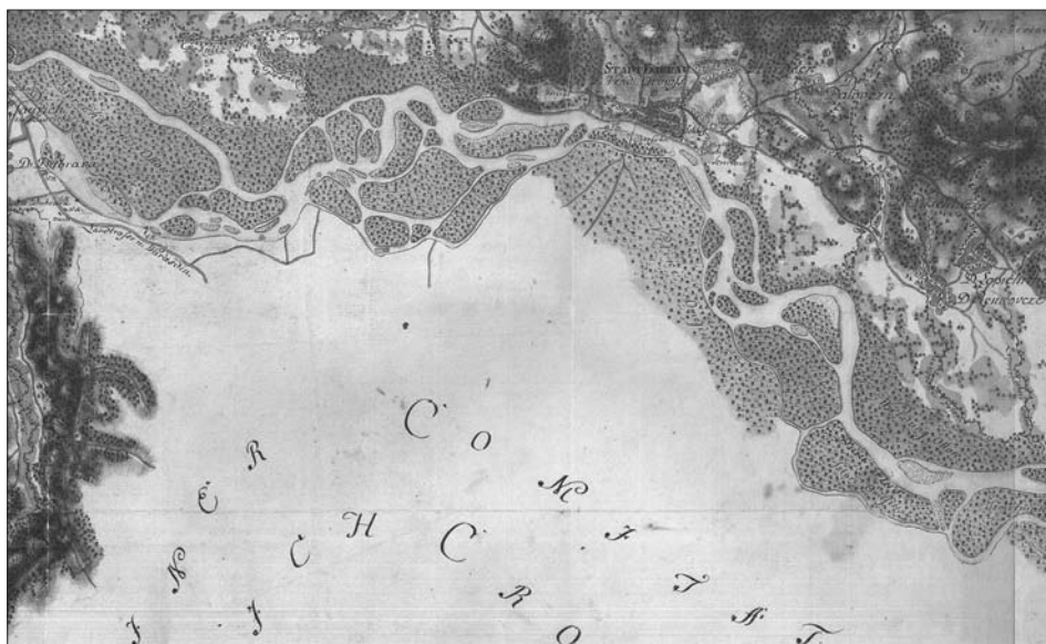
Rajšp, Vinko et al. (ur.). Slovenija na vojaškem zemljevidu 1763–1787 . Zv. 6. Sekcija 197. Ljubljana, 2000