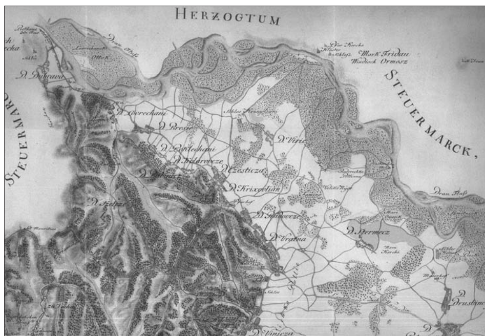
Valentić, Mirko et al. (ur.). Hrvaška na tajnim zemljovidima 18. i 19. stoljeća . Varaždinska županija. Sekcija 3. Zagreb, 2005