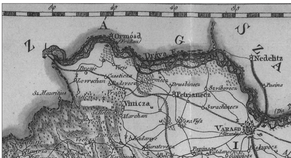
Valentić, Mirko et al. (ur.). Hrvatska na tajnim zemljovidima 18. i 19. stoljeća. Varaždinska županija. Oris terena . Zagreb, 2005

ni). Vse to je sprožalo nezadovoljstvo med dotičnim prebivalstvom, na drugi strani pa puščalo deželno mejo pravno neuskkljeno.