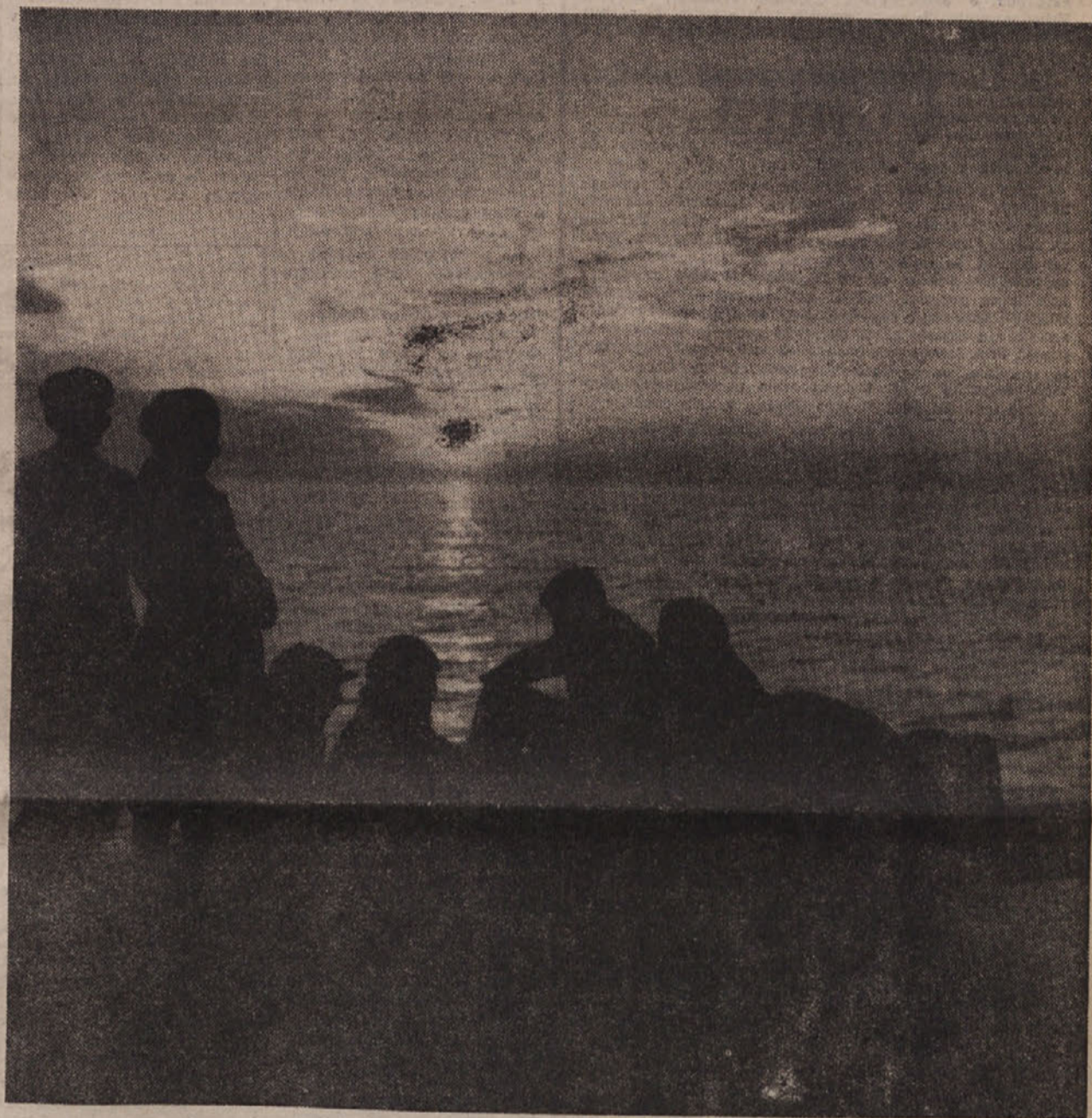
VEČER NA OBALI.

Tiska z dovoljenjem AIS Tržaški tiskarski zavod v Trstu, Ul. Montecchi 6