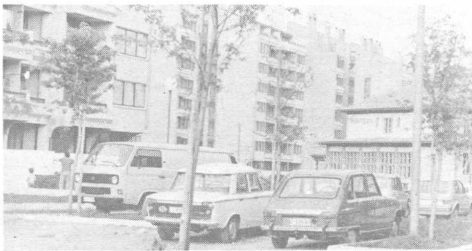
Tmovo raste. Upamo, da bo tako hitro zgrajen tudi vrtec.

TE DNI V KRAJEVNIH SKUPNOSTIH – TE DNI V KRAJEVNIH SKUPNOSTIH