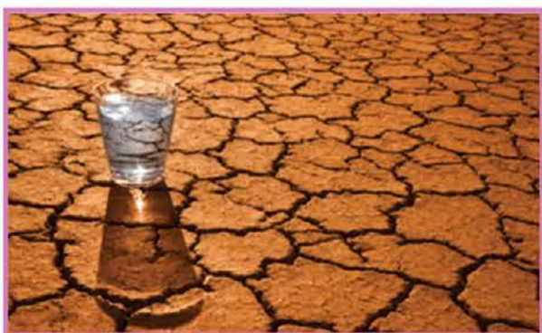
Zlasti postni čas in postni dnevi med letom kličejo k temu, da bi se obrnili k svoji notranjosti, odkrivali svoje poslanstvo, pa tudi grešnost, se kesali in zaživel bolj skladno z evangelijem.

Ob besedi post se navadno ustrašimo, ker predstavlja neko omejitvev, odpoved, notranji boj. Resnična duhovnost potrebuje podporo in prosornost duha. Skozi duhovne boje, molitev in premišljevanje so puščavski menihi v zgodnjem krščanstvu spoznali, da post pomaga pri očiščenju srca in osvobaja celega človeka. Post usmerja človeške misli, podobe in čustva k ponižnosti in zaupanju, da zraste ljubezen do sebe, Boga in bližnjih. V zahodnem krščanstvu se je postna praksa precej izgubila, zlasti po koncilu je večji poudarek na dobrodelnosti in molitvi. Vzporedno s tem pa so se v potrošniškem svetu razvile različne diete in hujšanja, ki enostavno mučijo