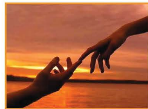
Krhkost in šibkost ljubezni je edina moč, ki more presekatiti verigo zla.

če bi se samo eden pol pripravil na vojno. Brez vrnjenega udarca bi bilo konec igre. Ljubezen poreže zlo pri korenini, da se ne more več hraniti in se posuši. Odpuščanje razbije spiralo sovraštva in prelomi krog povračila. Pomembno je, da se posamezniki in skupnosti odločijo, da si ne bodo več škodovali. Zmagovalec ni tisti, ki vzame orožje nasprotniku, ampak kdor odvrže svojega. Nasprotnik je zmeden, ker nima več sovražnika. Krhkost in šibkost ljubezni je edina moč, ki more presekatiti