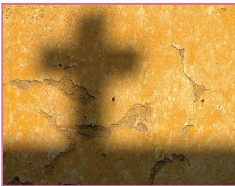
Prednostna odločitev za uboge pomeni nasprotovanje neomejenemu trgu, popredmetenju oseb, uničevanju narave, prizadevanje za dostojanstvo vsakega človeka, zaposlovanje brezposelnih, osvobajanje zasvojenih, za naše odrešenje, ki je Božji dar.

škofa, ki ga nekateri zmerjajo s komunistom. Prednostna odločitev za uboge je prisotna že v Stari zavezi, ki jo je Jezus dopolnil. Za