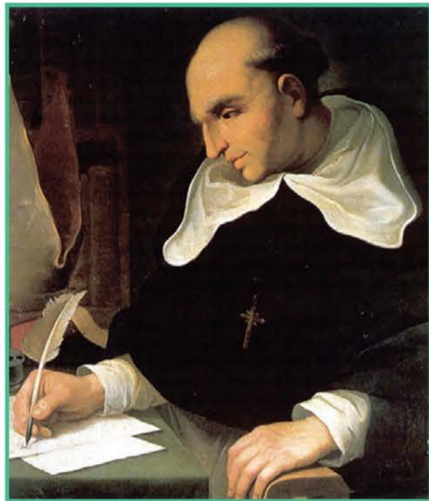
O Bartolomeju de Las Casasu se je izoblikovala mitska podoba, ki pa nima z resnično nič skupnega.

Pri konkvistadorjih je treba omeniti dominikanca, ki je po imenu vsem tako znan, to je Bartolomé de Las Casas, za katerega pa velja le tista mitološka upodobitev, ki ga prikazuje kot edinega resničnega branitelja pravic "Indiosov", medtem ko naj bi