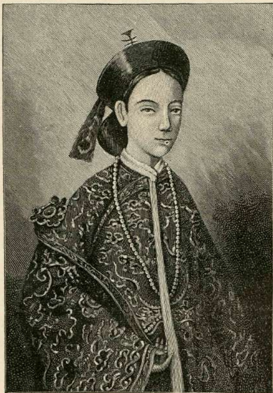
Kitajska cesarica-vdova Tsu-Hssi.

Dunaj sam, trg pred mestno hišo ob godbi zvečer, Štefanski trg ob birmi in druge