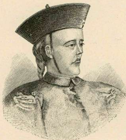
Kitajski cesar Kuang-ssü.