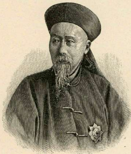
Li-Hung-Čang, podkralj kantonski.

18. vel. srpana. Vsa država avstrijska je praznovala ta dan izreden in vesel dogodek, 70. roj-