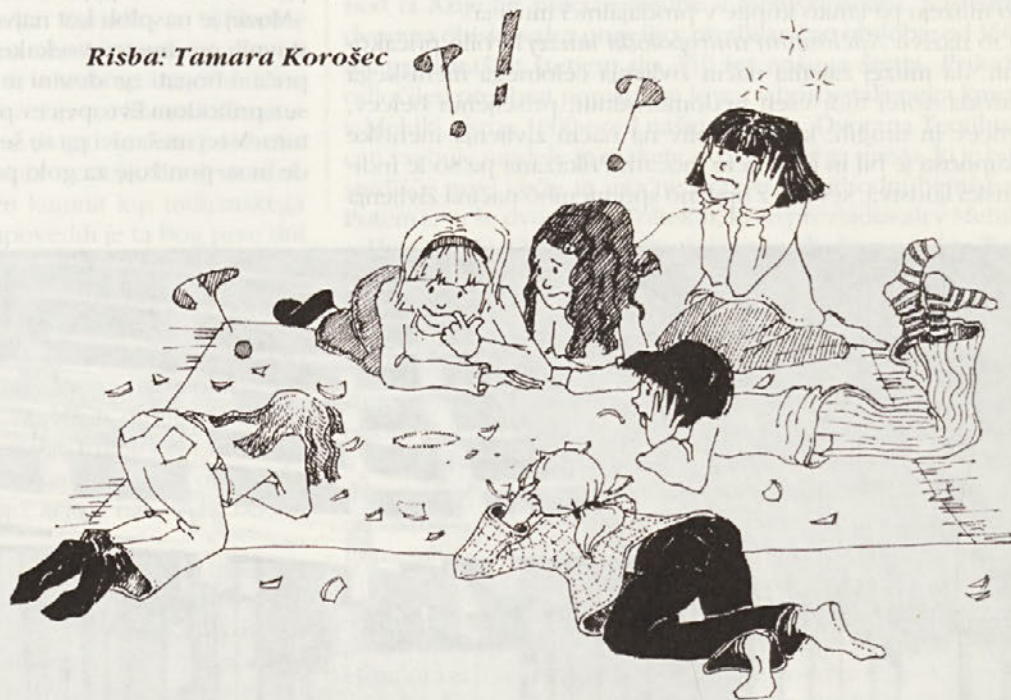
Risba: Tamara Korošec