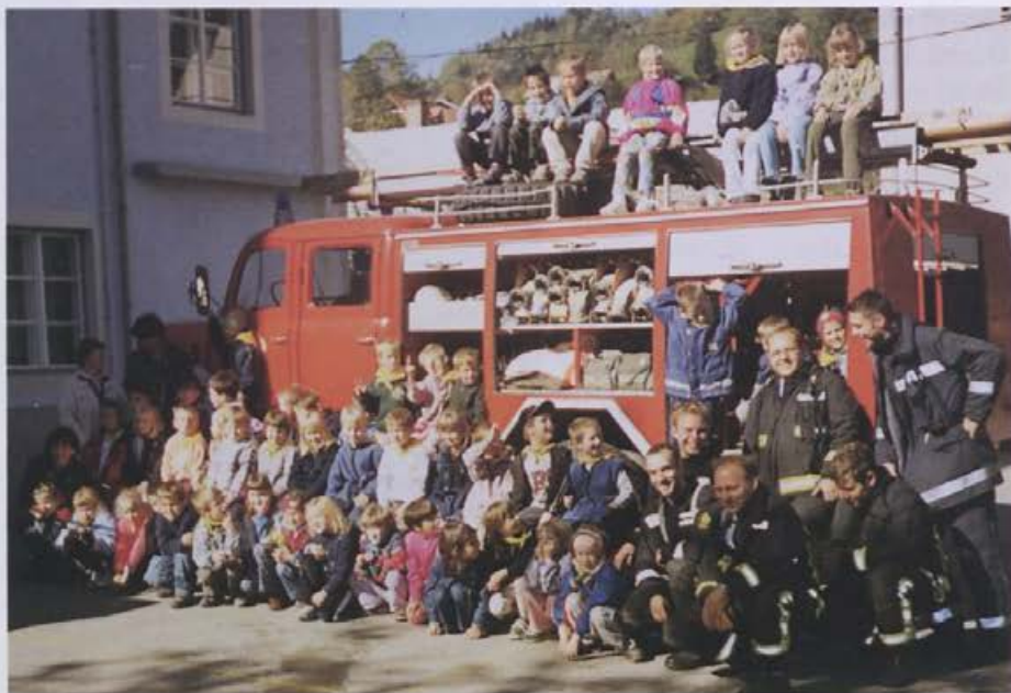
Gasilci skrbijo tudi za svoj podmladek.

V primerjavi z bližnjimi društvi imamo gasilska društva v Žireh, dokaj slabo opremo. Opremljenost določa kategorizacija posameznega društva. Naše društvo je s sporno postavljenjo mejo obstalo na najnižji možni stopnji oziroma kategoriji društev. Sami vemo, da bi se to dalo z