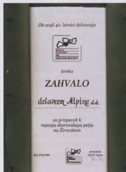
Posebno zahvalo so dobili tudi delavci Alpine

Alpine. V njem je pel trideset let. Na jubilejnim koncertu se je spet pridružil zboru. "Občutil sem neko nostalgijo, neko posebno zadovoljstvo. Vesel sem, da je to, kar smo že predavnimi leti sejali, rodilo sadove in da zbor, ki smo ga ustanovili, živi že toliko let. Moje zadovoljstvo pa je še večje, ker je zbor dosegel tako visoko raven tako glede izvedbe kot izbora skladb."