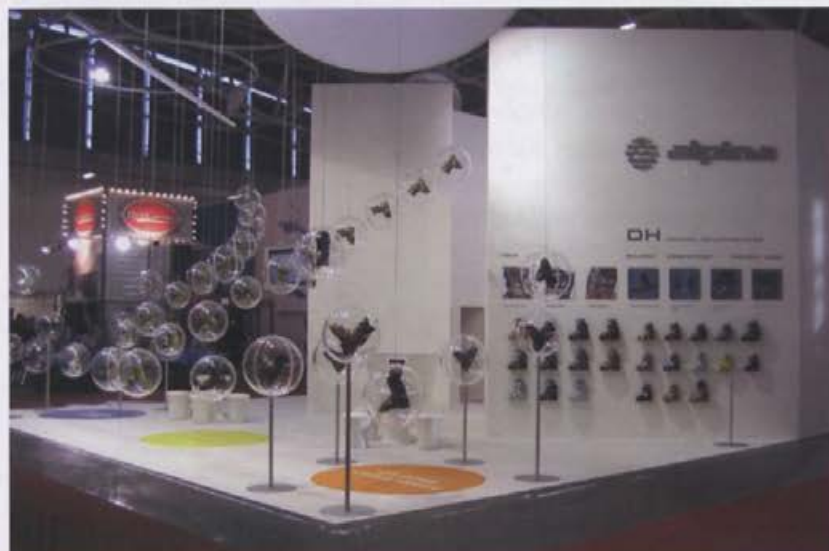
Nov, svež in zanimiv izgled sejemskega prostora v Münchnu