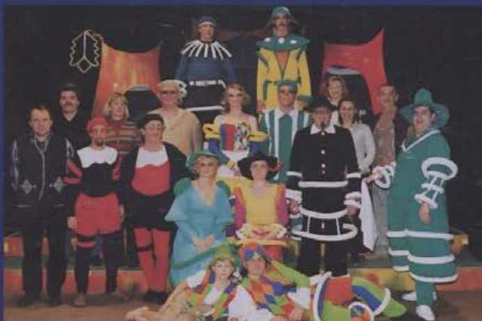
Ekipa, ki je pripravila letošnje dramsko delo – Pisana družina, nakazuje veslo dogajanje