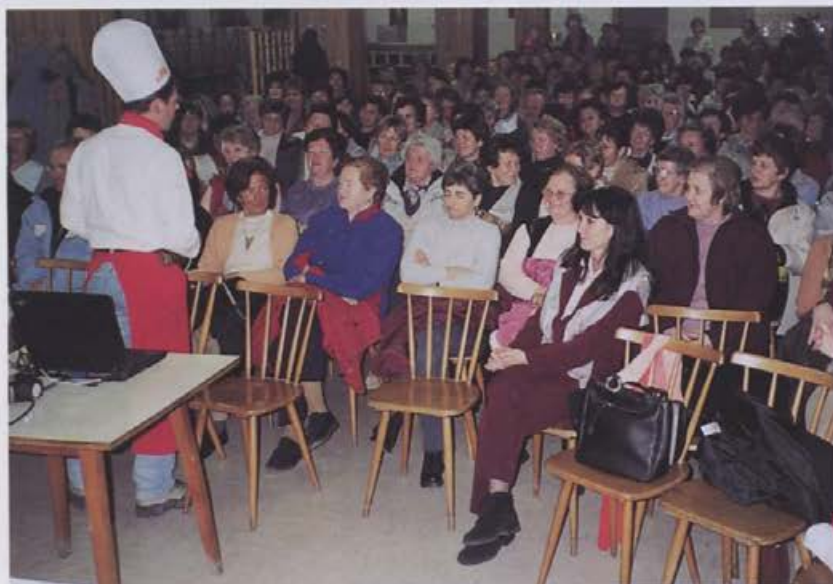
Kako kuhati čim bolj zdravo? Kuhali in pogovarjali so se v jedilnici Alpina.

Projekt Živimo zdravo, ki ga v sodelovanju z občino Žiri vodi Zavod za