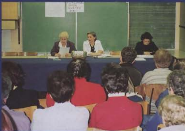
Na ustanovnem zboru se je zbralo veliko ljubiteljev klekljanja.

V petek, 5. marca so se v Osnovni šoli v Žireh zbrali ljubitelji žirovskega klekljanja. Ustanovili so svoje društvo, ki so ga poimenovali Klekljarsko društvo Cvetke Žiri. Cvetke so se poimenovali po čipki s petimi listi, ki je žirovska tradicija. Izdelava te čipke je zelo zahtevna.