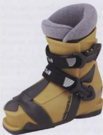
Otroški smučarski čevljev Be3

Velika večina proizvajalcev kot posledica lastne generalne odločitve vsako leto na sejmu ISPO prikaže najmanj en nov smučarski čevljev. To se je izkazalo tudi letos. Novosti, ki smo jih opazili, temeljijo na že znanih konstrukcijskih prijemih. Seveda pa moramo priznati, da vsak nov izdelek prinaša cel kup novitet v smislu vrhunskih oblik, dizajna, izgleda, barv, grafične podobe, tehnologije ter nenazadnje kakovosti izdelave.