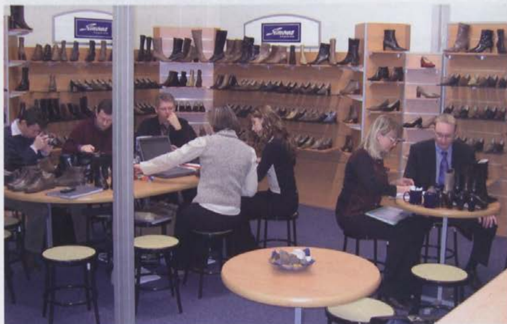
Na sejmu v Gardi nas je obiskalo veliko kupcev