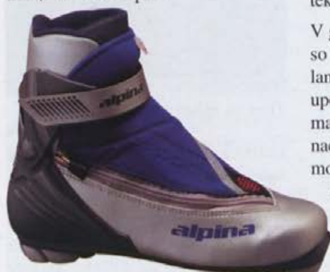
Tekaški čevljev SP 35

Na trgu nastopa večje število ponudnikov obutve za smučarski tek, ki bi jih lahko razdelili v dve skupini. Večji, ki s svojimi izdelki pokrivajo večino trga, in nekateri manjši, ki so omejeni bolj na ponudbo na svojem območju oziroma se ponekod šele uveljavljajo. Med večje proizvajalce poleg Salamona, Fischerja in Rossignola, sodi tudi Alpina.