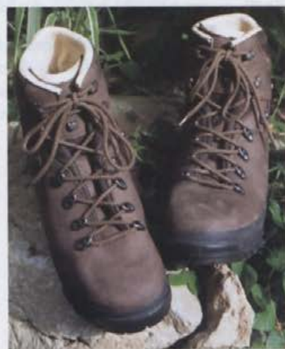
Tibet na začetku poti

ga pa nazaj. Dva dneva vzdržljivostne vožnje ali toliko kilometrov (pravzaprav še kakih 300 več), kot sem jih dosedaj prehodil v Tibetu. Kje je zdaj tu pravica? V Tibetu bi do Hamburga hodil, če bi vsak dan prehodil 20 kilometrov, dobrih 50 dni in nato še toliko časa nazaj. No, pravzaprav sem v Tibetu izhodil še več dni, le da sem v teh čvrstih pohodnih čevljih krožil tule okoli Polhograjskega hribovja, po Cerkljanskem hribovju, po severovzhodni Sloveniji in šel medtem malo pogledat med našpičeno skalovje Gorskega Kotarja. Izletnikovanje po cestah nekaj nemških mest je nato samo še izgledilo nasprotja – in podplate, saj asfalt prav lepo poravna, kar prej skalovje razbrazda. Podplati Tibeta so namreč novejša vibramova