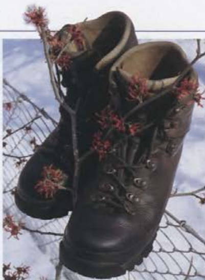
Tibet malo pred 2000

Odlika pohodnih čevljev Tibet je čvrst oprijem stopala in gležnja, na terenu pa izrazito čvrst bočni prijem. Zato so zelo primerni za hojo po težavnem, strmem in zanašič skalnatem brezpotnem terenu. Kljub čvrstemu koraku, ki ga omogočajo, so upogljivi in sorazmerno mehki, tako da je hoja v njih tudi v takšnih bolj skrajnostnih razmerah udobna, v običajnejših pa sploh prijetna. Gumasta obroba ščiti rob čevlja in kljub dvomom o uspešnosti spoja gume in usnja ne popusti ali vsaj ne veliko. Usnje ne daje najmanjšega razloga za pripombe; prednji del zgornjega dela je brez šivov, tako da ni razloga za