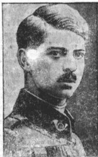
Novi rumunski kralj Karel II.

Takoj po vrnitvi princa Karla iz tujine je podal predsednik vlade dr. Juliu Maniu ostavko celokupne vlade, ki je bila tudi sprejeta. Po proglasitvi Karla za rumunskega kralja so se pričela pogajanja za sestavo nove vlade. Po neuspelih poskusih, da bi se sestavila koncentracijska vlada, v katero bi vstopile vse stranke, je kralj poveril mandat za sestavo vlade bivšemu predsedniku vlade Maniu, ki je sestavil čisto kmetijsko vlado. Listi poročajo, da bo še to jesen parlament razpuščen in razpisane nove volitve.