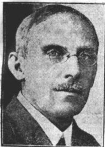
Dr. Vladimir Maček.

V soboto, 14. t. m. je bil končan pred državnim sodiščem za zaščito države v Beogradu proces proti dr. Mačku in hrvatskim omladincem. Proces je pričel 24. aprila in je trajal do 7. junija, v soboto 14. junija pa je bila izrečena sodba. Obtoženih je bilo 24 oseb, ki jih je zagovarjalo 30 odvetnikov.