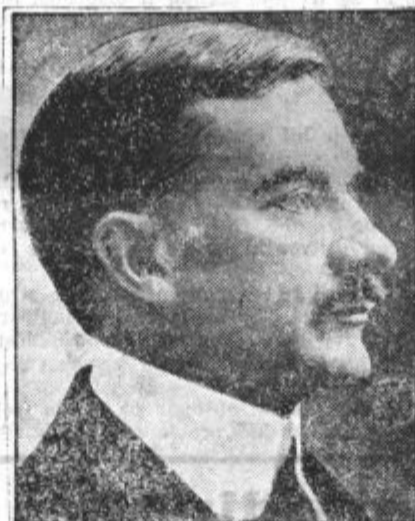
Dr. Juliu Maniu,

Takoj po vrnitvi princa Karla iz tujine je podal predsednik vlade dr. Juliu Maniu ostavko celokupne vlade, ki je bila tudi sprejeta. Po proglasitvi Karla za rumunskega kralja so se pričela pogajanja za sestavo nove vlade. Po neuspelih poskusih, da bi se sestavila koncentracijska vlada, v katero bi vstopile vse stranke, je kralj poveril mandat za sestavo vlade bivšemu predsedniku vlade Maniu, ki je sestavil čisto kmetijsko vlado. Listi poročajo, da bo še to jesen parlament razpuščen in razpisane nove volitve.