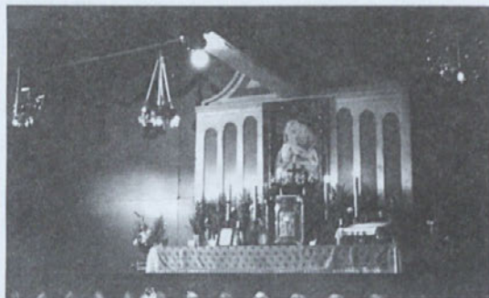
Kapela v taborišču

nih vzorcev. Vezle smo prte, ovitke za albume, knjige. Bili so lepi večeri.