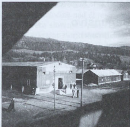
Taborišče Spittal - gledališka dvorana