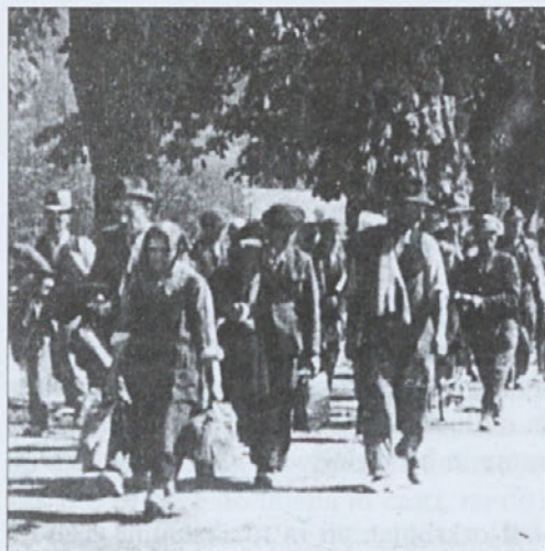
Kamorkoli, le proč od krvavih "osvoboditeljev" - Slovenski begunci - maj 1945

lenjske nasilno izgnali iz svojih skromnih domov kompletne družine, ne da bi si ti ljudje lahko karkoli vzeli s seboj. Torej goloroke in kar so trenutno imeli na sebi. Večino od njih so partizani odgnali do roba kočevskih gozdov, kjer so jim politkomisarji držali še politični govor in sporočilo, "...da naj gredo tja, kjer imajo svoje fante. Kdor pa se bo vrnil na svoj dom, bo ustreljen."