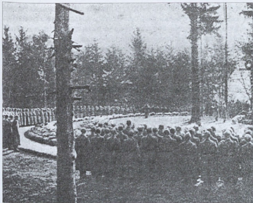
Nekdanji Orlov vrh, danes pasje "odlagališče"

Nič takega se ni zgodilo in se ne dogaja. Geslo o enakih pravicah vseh drugačnih velja samo za svet, ki ga je ustvarila revolucija in pol stoletni totalitarni režim, velja samo za tiste, ki v resnici niso drugačni, ki so "naši". Tiste, ki so bolj drugačni in ne priznavajo revolucije, umorov in nasilja za sredstva družbenega urejanja, nasledniki komunistične totalitarne oblasti odrivajo v drugi svet, v svet sovražnikov. Za nasprotnike revolucionarnega terorja pa so komunisti že septembra 1941 izdali odlok, da nimajo pravice do svobode misli in dejanj, da ne spadajo med ljudi, da jih je treba pobiti. Po tem pravilu se nasledniki komunistov ravnavajo še danes v začetku 21. stoletja. Tudi v samostojni Sloveniji zakoni številne pravice dajejo samo enim, samo "našim". Drugi so brez imena in brez časti, brez pravic in celo brez groba. Politiki in oblastniki, podjetniki in kulturniki, vzgojitelji in socialni delavci še dodatno poskr-