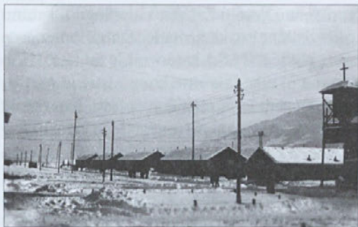
Del taborišča pozimi

vozijo v Slovenijo in izročajo partizanom. Torej je resnica, da jih ne vozijo v Palmanovo, pač pa v Slovenijo! Kot strela z neba je padla ta novica med ljudi. Vetrinjska cerkev se je napolnila nemočne, žalostne, jokajoče množice. Molili smo in molili za naše prodane bataljone.