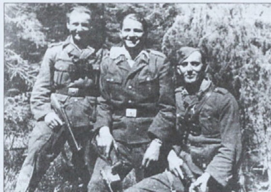
Partizani v nemških uniformah, z nemškimi opasači, nemškim orožjem in sovjetsko rdečo zvezdo.