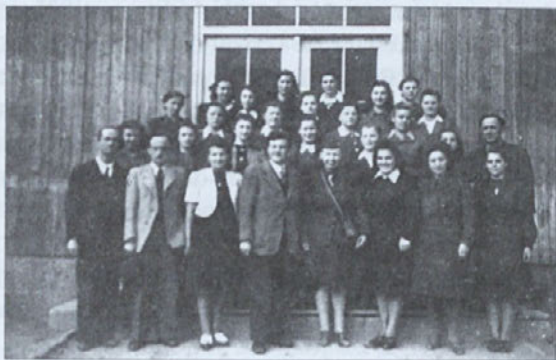
Gospodinjstva šola v taborišču Spittal