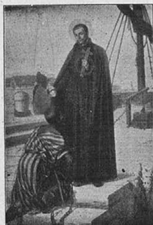
Sv. Peter Klaver, apostol zamorcev, prosi za nje in za naše podjelje!