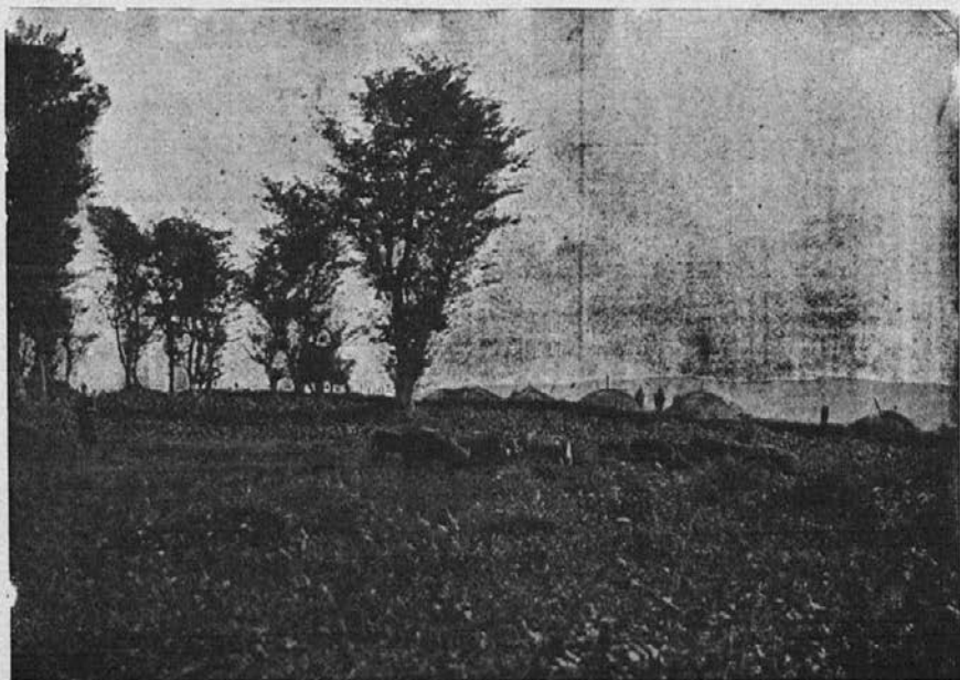
Prestolnica poglavarja Muhini-ja.

Vendar pa hočem narediti danes izjemo, posebno še, ker