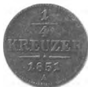
Slika 33: Bakreni drobiž, četrť krajcarja konvencijske valute, 1851, Dunaj.

povsod dosti«. Nasprotno v deželah, ki so bile del Ilirskih provinc, bakreni drobiž iz leta 1811 sploh ni bil v uporabi. Ta bakreni drobiž je prišel v denarni obtok šele po državnem »bankrotu« leta 1811 in uvedbi zamenjalnih bankovcev. S tem drobižem je bila po tem takem blagoslovljena le Štajerska in vzhodna Koroška. Teh »krajcarjev je še dosti med ljudstvom v tistih deželah, ktere so 'zamenjalne bankovce' imele (pri nas na Kranjskem ga že zdavnaj ni)«. 773