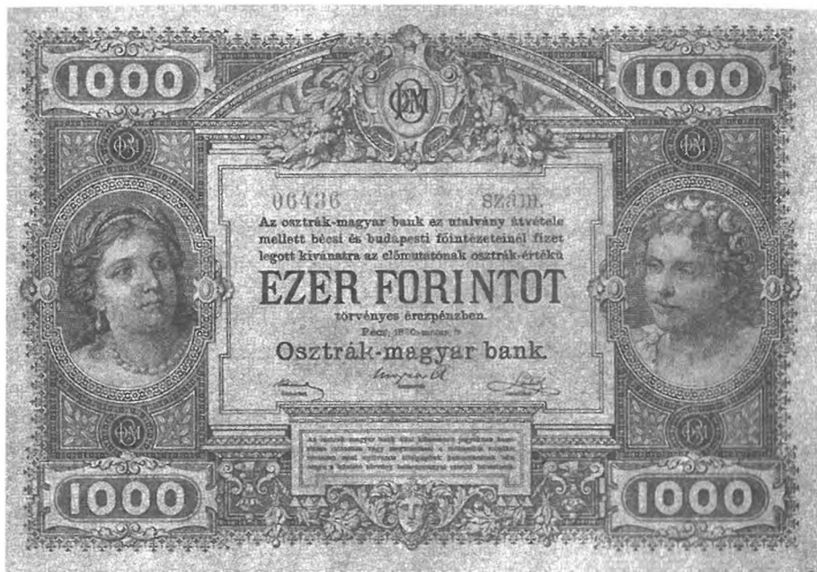
Slika 49: Bankovec avstroogrške banke, 1000 goldinarjev avstrijske valute, 1. 5. 1880.

Napadi na finančnega ministra so se še stopnjevali, ko je javnost ugotovila, da bo večina stroškov valutne reforme padla na avstrijska ramena: »Iz njegovih besed dobesedno zaslišimo madžarska povelja. Pomanjkljivosti njegovih argumentov izvirajo iz njegovega zagovarjanja specifično madžarske akcije.« 1264 Skupni finančni izdatki Avstro-Ogrske so bili določeni s kvotami, po katerih je Avstrija plačevala 70% in Ogrska 30% izdatkov. Avstrijska javnost je bila globoko prepričana, da je takšna določitev kvot v veliko škodo Avstrije, ki da jo Ogrska finančno izkorišča. Tudi Slovenci so bentili nad Ogrsko, in to brez izjeme tako privrženci 1265 kot nasprotniki valutne reforme. 1266