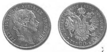
Slika 26: Kurantni srebrnik, 20 krajcarjev konvencijske valute, 1852 (2. inačica), Dunaj.

leta 1851 so potekala vedno nova posvetovanja, ki so si za cilj med drugim zadalja poenotenje novčnega sistema. Pri tem so si prizadevali tudi za poenotenje čistine kovancev na podlagi desetiškega sistema. Vsi glavni kurantni kovanci naj bi imeli čistino 900, se pravi 90 % zlata ali srebra in 10 % bakra. V tem sklopu je avstrijska vlada med prvimi sledila francoskemu zgledu. 517 V naslednjih letih in desetletjih je tudi velika večina drugih držav (razen Anglije) vpeljala desetiški sistem pri določitvi čistine glavnih kurantnih kovancev. 518