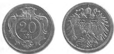
Slika 55: Drobiž iz niklja, 20 vinarjev kronske valute, 1894.

V skladu z umikom starega drobiža avstrijske valute iz denarnega obtoka je vlada v obtok pošiljala novi drobiž kronske valute. Drobiž iz niklja po 10 in 20 vinarjev je začel prihajati v promet po 1. maju 1893, 1495 po 16. maju pa še srebrni drobiž po 1 krono. 1496 Vzporedno z umikanjem starega bakrenega drobiža je v obtok prihajal novi bronasti drobiž kronske valute. 1497 Dunajska kovnica 1498 je bila ves čas polno zaposlena s kovanjem novega drobiža. 1499 Ko 1. julija 1898 star bakreni drobiž ni imel več prisilnega tečaja, je denarni promet že skoraj povsem obvladoval novi drobiž kronske valute. 1500 Pri tem je bilo nerodno samo to, da so ljudje v tem času še vedno računali z avstrijsko valuto in je bilo torej potrebno nov drobiž sproti preračunavati v goldinarje in krajcarje.