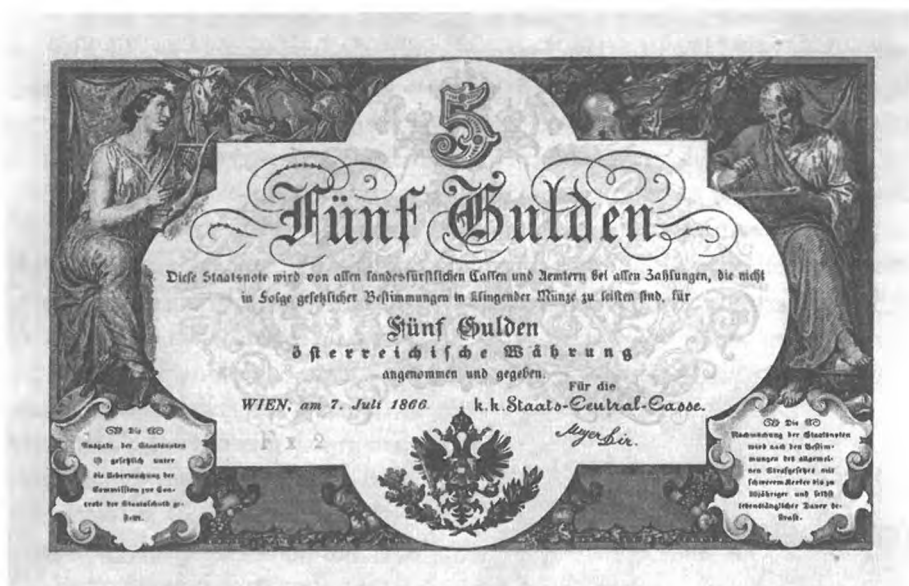
Slika 44: Državni papirnati denar, 5 goldinarjev avstrijske valute, 7. 7. 1866.

Za državni papirnati denar je bilo še posebno nerodno, ker so bili od 5. maja 1866 za ta denar razglašeni bankovci za 1 in 5 gld. Pravno je bila to sicer povsem nova vrsta denarja, po izgledu pa so bili še naprej bankovci narodne banke. Šele zakon z dne 25. avgusta 1866 je določal, da bo ta državni papirnati denar potrebno zamenjati za papirnati denar, ki bo tudi po izgledu državni. Hkrati je bilo državi dovoljeno izdajati še državni papirnati denar za 50 gld. 1098 S pomočjo narodne banke je država začela tiskati poseben državni papirnati denar, ki je po 1. septembru 1866 1099 začel hitro prihajati v obtok. 1100 Država je izdajala papirnati denar za 1, 5 in 50 gld. Bankovci so se od sedaj naprej glasi na 10, 100 in 1000 gld. 1101