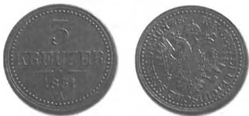
Slika 24: Bakreni drobiž, 3 krajcarje konvencijske valute, 1851, Dunaj.

7. aprila 1851 je izšla cesarska uredba o uvedbi novega bakrenega drobiža v vrednostih po 3, 2, 1, 1/2 in 1/4 kr. Iz dunajskega centa (56 kg) bakra se je kovalo za 170 gld. in 40 kr. novega bakrenega drobiža. V kovancu za 1 kr. je bilo 5,47 g bakra. 482 Novi bakreni drobiž je v denarnem obtoku zamenjal stari bakreni drobiž, ki so ga v isti obliki kovali že od leta 1816. 483 Iz obtoka je bil prav tako umaknjen bakreni drobiž za 2 kr., ki so ga začeli kovati leta 1848. Drobiž za 2 kr. so prenehali kovati že leta 1850, iz prometa pa so ga umaknili tudi zato, ker je bil preokoren in pretežek. 484 Nasprotno naj bi bil novi bakreni drobiž lepši, manjši in lažji, ter zato bolj primeren za denarni promet. 485