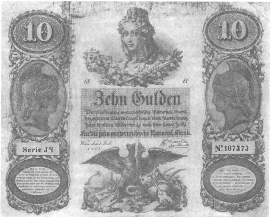
Slika 30: Bankovec avstrijske narodne banke, 10 goldinarjev konvencijske valute, 1. 7. 1854.

kali ostale bankovce. Bankovci za 100 in 50 gld. naj bi veljali še do konca avgusta 1859, za 10 gld. do konca oktobra 1859 in za 5, 2 in 1 gld. do konca novembra 1858. 731 »Pozneje se ne bodo mogli stari bankovci nikjer premenjati; zato naj jih vsakdo v pravem času zamenja, da ne bo zgube imel.« 732