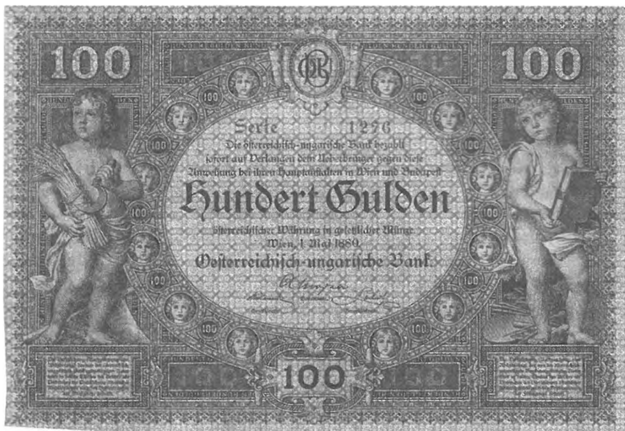
Slika 56: Bankovec avstroogrške banke, 100 goldinarjev avstrijske valute, 1. 5. 1880.

krajcarje, dasi je kronska veljava vpeljana že od 1. januarja 1901. 1514 Zlasti tradicionalno kmečko okolje se je vedno težko navadilo na novosti, ki so posegale v njihov utečeni svet merskih, utežnih in nenazadnje denarnih predstav. Moderni merski in utežni sistem je npr. veljal že od leta 1876. Odtlej je bilo prepovedano tehtati in meriti s starimi enotami: »O novej meri in vagi je vse tiho. [...] Potem takem bi človek skoraj mislil, da je nova mera in vaga ljudem priljubljena, toda skušnja uči, da se bo kmečki ljud le težko z njo sprijaznil.« 1515 Če so se tako trgovci pri medsebojnem poslovanju počasi vedno bolj privajali na nove mere, pa se je kmečko ljudstvo še naprej trdovratno oklepalo starih. 1516 Ponekod so trgovci, ki so prodajali po novih merah (na kar jih je obvezoval zakon), morali zaradi bojkota kmečkih kupcev zopet preiti na stare mere. V okolici Novega mesta tako ljudje še leta 1900 niso hoteli kupovati mesa na kile. 1517