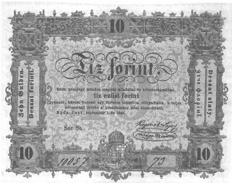
Slika 20: Ogrski papirnati denar, 10 goldinarjev konvencijske valute, 1. 9. 1848.

nega sistema ji je v Lombardiji in Benečiji to bolj ali manj uspevalo. Povsem drugače pa je bilo na Ogrskem. Že pred revolucijo je imela Ogrska nerazvit davčni sistem z nizkimi stopnjami davčne obremenitve. Zato tudi madžarska revolucionarna vlada samo z davki ni mogla financirati vseh svojih izdatkov. Poleg tega si zaradi nerazvitega finančnega trga denarja ni mogla izposoditi. Tako se je oprijela starega, preizkušenega recepta revolucionarnih vlad in je začela izdajati državni papirnati denar. Že maja 1848 je začela izdajati bankovce za 1 in 2 gld., ki so sprva imeli kovinsko pokritje in so jih izdajali neodvisno od avstrijske narodne banke. Konec avgusta 1848 so začeli izdajati pravi državni papirnati denar. Ta ogrski papirnati denar so popularno imenovali 'Kossuthovi (Košutovi) bankovci'.