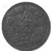
Slika 39: Bakreni drobiž, 4 krajcarji avstrijske valute, 1860, Dunaj.

no poročali: »Novi 4krajcarji, ki so bili sem ter tje prve dni tega mesca viditi, so zginili spet kakor kafa.« 937