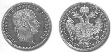
Slika 47: trgovski zlatnik, 4 dukati, 1866, Dunaj.

Težave pa bi nastopile v razmerju do zlatih valut. Avstrija je sicer kovala zlatnike, vendar samo kot trgovski denar. Njihova vrednost se je prosto oblikovala na trgu in je v primerjavi z avstrijsko valuto stalno nihala. Podobno je vrednost avstrijske valute nihala v primerjavi z zlatimi devizami. Menjalni tečaji med zlato in srebrno valuto torej niso bili stabilni. Zato tudi konvertibilnost avstrijske valute ne bi prav nič pripomogla k stabilizaciji menjalnih tečajev do denarja držav z zlato valuto.