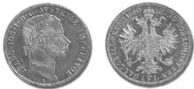
Slika 32: Kurantni srebrnik, 1 goldinar avstrijske valute, 1860, Dunaj.