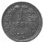
Slika 50: Bakreni drobiž, krajcar avstrijske valute, 1885.

okoljih. 1431 Prav to dejstvo, da je življenjska praksa iz denarnega obtoka izrinila drobiž po pol krajcarja, naj bi govorilo v prid ohranitve goldinarja kot denarne enote. Poleg tega so takratni moralisti tudi ugotavljali, da ljudje nimajo ne- spoštljivega odnosa samo do drobiža po pol krajcarja, temveč tudi do »bore« krajcarja, torej do drobiža za 1 krajcar. 1432 Problematičen torej ni bil odnos do polkrajcarja kot takšnega, temveč do malo vrednega drobiža nasploh.