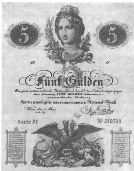
Slika 38: Bankovec avstrijske narodne banke, 5 goldinarjev avstrijske valute, 1. 5. 1859.

Ker država tudi ni mogla računati na najem posojila pri domačem prebivalstvu, ki se je še dobro spominjalo na zgone in nezgone ljudskega posojila, se je moral finančni minister Bruck obrniti na narodno banko. Takoj po začetku vojaških operacij je 29. aprila 1859 s cesarskim odlokom napovedal najem posojila v skupni vrednosti 200 milijonov gld. To posojilo je takoj prevzela narodna banka, ki je nato državi kot predujem nakazala 133 milijonov gld. Hkrati je lahko narodna banka za enako vsoto izdala bankovce za 5 gld. Ti bankovci so torej imeli kritje v državnem posojilu. 867 Narodna banka je bankovce za 5 gld. začela izdelovati že maja 1859, 868 vendar jih vse do konca vojne še ni natisnila dovolj. 869 Zato jih je začela izdajati šele 1. septembra 1859. 870 Kljub temu pa je država skoraj 90 milijonov gld. porabila že pred koncem vojne. 871