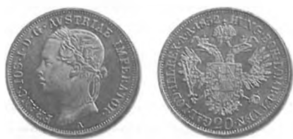
Slika 25: Kurantni srebrnik, 20 krajcarjev konvencijske valute, 1852, Dunaj.

Leta 1852 se je vlada odločila uvesti nov srebrni kurantni denar. Do sedaj so namreč še vedno kovali srebrnike s podobo cesarja Ferdinanda I., čeprav je že od konca leta 1848 na prestolu sedel Franc Jožef. Zaradi izginjanja srebrnikov iz denarnega obtoka niso skovali pretirano veliko teh srebrnikov. 506 Šele leta 1851 so v kovnici začeli delati na predlogi novega denarja, »ki se bo z obrazom cesarja kmalo kovati začel«. 507 V začetku leta 1852 so skovali poskusno serijo novih kovancev, 508 ki so jih nato marca začeli redno kovati. 509 Toda že čez par mesecev so prenehali s kovanjem. Kovanja niso zaustavili zaradi kakšne nenadne denarne krize, temveč iz povsem osebnih razlogov cesarja Franca Jožefa, ki ni bil zadovoljen s svojim portretom na kovancih: »Ker podoba cesarja, ki pride na nove dvajsetice, ni pristojno skovana, se je opustilo kovanje dvajsetic, da se nova boljša izdelata in tudi nova tarifa določi, po kateri se bo srebrni denar koval«. 510 Na novih srebrnikih je bila zato cesarjeva glava namesto na levo obrnjena na (lepšo) desno stran in je bila rahlo idealizirana. 511