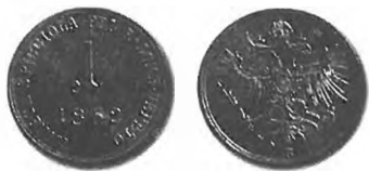
Slika 40: Bakreni drobiž za Benečijo, 1 sold avstrijske valute, 1862, Kremnica.

Vladi nikakor ni uspelo ustaviti preprodaje novega bakrenega drobiža v Benečijo. Nazadnje ji ni preostalo nič drugega, kot da je leta 1862 za Benečijo začela kovati poseben bakreni drobiž. 941 Od avstrijskega drobiža se je razlikoval samo po napisu. 942 Ko so sredi leta 1862 skovali dovolj novega italijanskega drobiža, so v Benečiji preklicali veljavnost avstrijskega bakrenega drobiža. 943 Ker avstrijskega bakrenega drobiža sedaj ni bilo več mogoče menjati za srebrnike, so upali, da bo prišel nazaj v avstrijske dežele: »Tako bomo menda dobili spet novih krajcarjev dovolj, ki so nam že zlo zginili.« 944