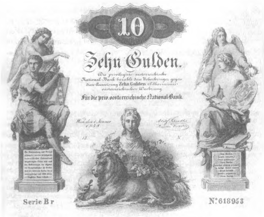
Slika 31: Bankovec avstrijske narodne banke, 10 goldinarjev avstrijske valute, 1. 1. 1858.

spečati po svoji veljavi», 735 je bil rok za zamenjavo podaljšan do konca aprila 1860, pri narodni banki na Dunaju pa do konca julija 1860. 736 Vendar je bilo konec marca v obtoku še vedno za več kot 23 milijonov gld. starih bankovcev. Novice so ob tem pravilno predvidevale, »da utegne čas preklica še podaljšan biti, al bolje je, se jih znebiti v pravem času.« 737 20. aprila 1860 je narodna banka rok za zamenjavo podaljšala do konca septembra, do konca leta pa jih je bila pripravljena zamenjati na sedežu podjetja na Dunaju. 738 Konec junija je bilo v obtoku še vedno za 8 milijonov gld. starih bankovcev. 739 Ker ljudje še vedno niso prinesli zamenjati vseh bankovcev, je bil septembra rok za zamenjavo zopet velikodušno prestavljen. Narodna banka jih je skupaj s podružnicami sprejemala še do konca leta 1860, državne blagajne do konca februarja 1860, centrala narodne banke pa do konca marca 1860. 740 »To se pové vsem, kateri napačno mislijo, da stari bankovci nimajo nobene vrednosti več.« 741 Na podlagi posebne prošnje pa jih je bilo nato pri narodni banki mogoče zamenjati še celo do konca leta 1866. 742