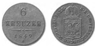
Slika 16: Srebrni drobiž, 6 krajcarjev konvencijske valute, 1849, Dunaj.

1. junija 1849 so na podlagi cesarskega razglasa začeli kovati nov srebrni drobiž za 6 kr. Iz dunajske marke srebra se je kovalo 336 kovancev. Kovali so ga po stopnji 33 gld. 36 kr. 202 V vsakem kovancu je bilo za 0,835 g srebra in so imeli ob čistini 438 za 1,91 g čiste teže. 203 Kovinska (srebrna) vrednost novega srebrnega drobiža po 6 kr. je bila torej za 28,6 % nižja od (kovinske in imenske) vrednosti konvencijskega kurantnega denarja.