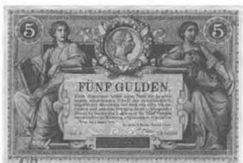
Slika 54: Državni papirnati denar, 5 goldinarjev avstrijske valute, 1. 1. 1881.

Avstrijski vladi je junija 1894 skozi parlamentarno proceduro uspelo spraviti nov zakon o izvedbi valutne reforme. Avstrijska in ogrska vlada naj bi iz denarnega obtoka umaknili za 200 milijonov gld. državnega papirnatega denarja. Povsem naj bi umaknili državni papirnati denar po 1 gld., za preostali znesek pa naj bi umaknili preostali državni papirnati denar po 5 in 50 gld. Umaknjeni državni papirnati denar so nameravali nadomestiti s 40 milijoni gld. v srebrnem drobižu. Za preostali znesek je država avstroogrski banki nakazala zlato, ta ji je odpisala dolgove in dala v obtok bankovce in kurantne srebrnike. 1475