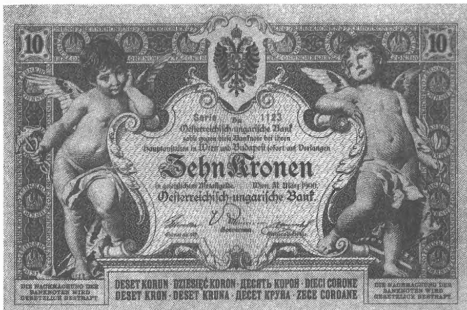
Slika 57: Bankovec avstroogrške banke, 10 kron kronske valute, 31. 3. 1900.

Vlada je kronsko valuto razglasila za uradno državno valuto, ko se je odločila, da bo iz denarnega obtoka umaknila še ves preostali državni papirnati denar. Avstrijska in ogrska vlada sta se leta 1899 sporazumeli, da bosta iz obtoka umaknili še za preostalih 112 milijonov gld. (224 milijonov K) državnega papirnatega denarja po 5 in 50 gld. 1521 Obe vladi sta avstroogrski banki nakazali ustrezno količino zatega in srebrnega denarja (avstrijski delež je bil 156.800.000 K), banka pa je poskrbela za zamenjavo državnega papirnatega denarja v srebrni drobiž po 5 kron (64 milijonov K) in bankovce po 10 kron (160 milijonov K). Država je potrebni srebrni drobiž dobila s prekovanjem večjega dela kurantnih srebrnikov po 1 gld. 1522