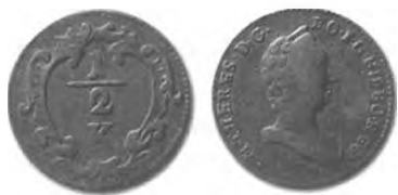
Slika 13: Bakreni drobiž, pol krajcarja konvencijske valute, 1760.

V predmarčnem obdobju je bil med ljudmi najbolj priljubljen srebrnik po 20 krajcarjev. Ljudje so mu po domače rekli dvajsetica (Zwanziger). Svojo slavo je ta kovanec dolgoval svoji vsesplošni razširjenosti in relativno visoki vrednosti. Zato so bile prav dvajsetice tisti denar, s katerim se je največ prekupčevalo 175 in katerega so imeli ljudje največ skritega po svojih shrambah. 176 Iz denarnega obtoka je skoraj povsem izginil že avgusta 1848. 177 Vlada je pomanjkanje poskušala nadomestiti s kovanjem novih dvajsetic. Tako so samo od novembra 1848 v enem letu skovali 13.653.062 dvajsetic. 178 Vendar so tudi te kmalu izginile iz obtoka. Nihče ni vedel, koliko »teh belih vranov« 179 so ljudje umaknili iz prometa in jih hranili doma. Nekateri časopisi so špekulirali, »de je za 100 milijonov dvajsetic zakopanih, ki ne pridejo na dan«. 180 Veliko tega denarja je izginilo tudi v tujino, kjer so ga večinoma pretopili v tuje srebrnike. Tako naj bi od februarja 1848 do srede leta 1852 samo kovnice v Parizu pretopile več kot 30 milijonov dvajsetic. 181 Kovnice v Bruslju so jih pretopile za 22 milijonov gld. 182