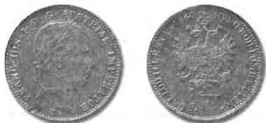
Slika 37: Kurantni srebrnik, četrto goldinarja avstrijske valute, 1860, Alba Iulia.

Veliko bolj burno je bilo v Italiji. V Novicah je dopisnik iz Milana poročal, da se pri njih na veliko trguje z novimi kovanci, ki jih preprodajajo v Turčijo kot večvredne kovance za 20 kr. CM. »in tako uganjajo veliko sleparijo«. 846 S takšnim prekupčevanjem so se po vsej verjetnosti ukvarjali tudi v Trstu, ki je imel razvejane trgovske stike z Levantom. Zato so leta 1859 prišli v obtok novi kovanci po 1/4 gld. öW, ki so imeli vkovano veliko večjo številko vrednosti, »da se odverne goljufija, po kateri se je, zlasti na Turško, veliko takih novih petic spečalo za stare dvajsetice«. 847