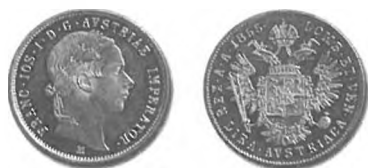
Slika 35: Kurantni srebrnik, 1 avstrijska lira, 1855, Milano.

in tako preprečila odtok tujih zlatnikov. Hkrati je bila to tudi priložnost, da uporni italijanski provinci monetarno priključi avstrijskemu cesarstvu. Že leta 1851 so ob priložnosti izdaje novega drobiža konvencijske valute tudi v Lombardiji in Benečiji začeli kovati nov drobiž, ki je bil skladen z avstrijskim. 839 Stari italijanski drobiž so iz prometa povsem umaknili šele konec leta 1858. 840 Hkrati pa so ob tej priložnosti zamenjali tudi kurantni denar v razmerju: 100 avstrijskih lir = 35 gld. avstrijske valute .