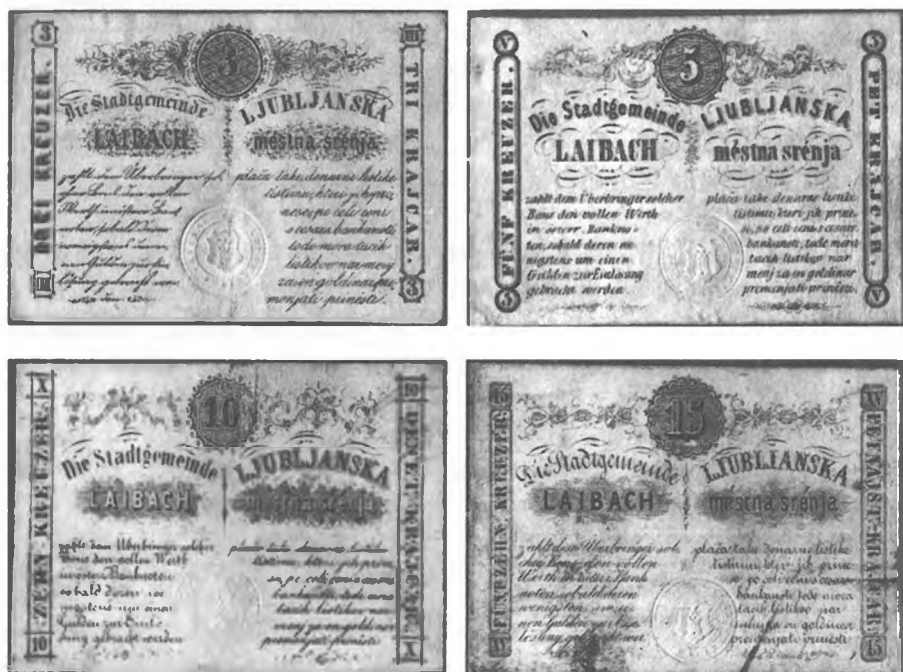
Slika 19: Nadomestni denar, 3, 5, 10 in 15 krajcarjev konvencijske valute, 1848, Ljubljana. [Slika se nahaja v Granda, Stane: Gospodarske razmere pri Slovencih v revolucionarnem letu 1848/49, V: Mihelič, Darja (ur.): Gestrinov zbornik, Ljubljana 1999, str. 327.]

V veliko večji meri kot posamezniki so nadomestni denar izdajale mestne oblasti. V sosednjih hrvaških pokrajinah so papirnati drobšč različnih nominalnih vrednosti (1, 3, 5, 10 in 20 kr.) izdajali na Reki, v Bakru, Karlovcu in Osijeku. 221 Novembra 1848 je po zgledu Reke in Prage tudi ljubljanska mestna občina začela izdajati zasilni denar – tako imenovane »denarne listke« za 3, 5, 10 in 15 kr. Vsak takšen zasilni denar je nosil tudi sledeči nemški in slovenski napis: »Ljubljanska mestna srenja plača take denarne listike tistimu, kateri jih prinese, po celi ceni s cesars. banknoti; tode mora tacih listikov nar menj za en goldinar spremenjati prinesti.« 222