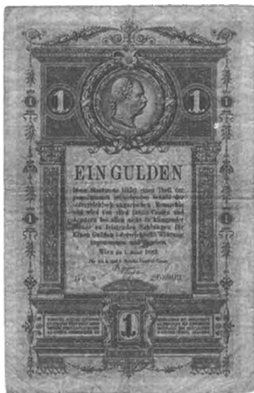
Slika 53: Državni papirnati denar, 1 goldinar avstrijske valute, 1. 1. 1882.

Nasprotniki zlate valute so že od vsega začetka z nezaupanjem gledali na nameravano posojilo in na nakup zlata. 1463 Ti strahovi niso potihnili niti po uspešnem sprejetju valutne reforme v avstrijskem parlamentu. 1464 Povsem nepričakovano pa se je znova pojavila zlata aziija. Tržna vrednost nove valute se v razmerju do zlatih deviz od srede novembra 1892 ni več držala v mejah zlatih točk. Zlata aziija je začela hitro naraščati in je novembra 1893 pri 6,75 % dosegla svoj vrh. Nato je začela padati in je 17. oktobra 1895 dokončno izginila. 1465