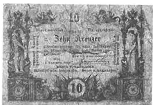
Slika 41: Papirnati drobiž, 10 krajcarjev avstrijske valute, 1860.

kr. Papirnati drobiž ni imel prisilnega tečaja. Državne blagajne so ga sprejemale do skupne vsote 1 gld. Ukrep naj bi veljal samo začasno in skupna vsota izdane-ga papirnatega drobiža ni smela presegati 12 milijonov gld. 963