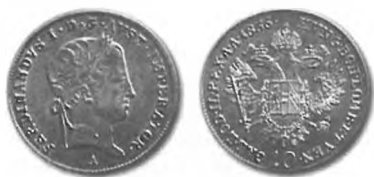
Slika 11: Kurantni srebrnik, 10 krajcarjev konvencijske valute, 1836, Dunaj.

Z vesplošnim padanjem zaupanja v trdnost avstrijskega papirnatega denarja se je na dunajski borzi večal nakup srebrnih in zlatih deviz in sta se skladno s tem višali tudi srebrna in zlata ažija. Podobno se je na tujih borzah dogajalo s tržno ceno avstrijskega denarja. Kdor je npr. v teh razmerah v Avstriji za 100 gld. bankovcev dobil 100 gld. konvencijske valute in je te kovance potem prodal v tujini, je na račun 10-procentne srebrne ažije potem lahko kupil skoraj za (odšteti je potrebno še stroške) 110 gld. bankovcev. Prekupčevalec je pri tem moral odšteti še 2–3-procentne stroške, ostalo pa je bil zanj čisti dobiček. Zato so ljudje »naš srebrni denar, ki je bil že v samim srebru toliko vreden, kolikor je veljal,« neizrečeno veliko v ptuje dežele izpeljali. 130 Edina ovira pri tem dobičkonosnem poslu je bila zakonska prepoved izvažanja avstrijskih kovancev v tujino. Prav to pa naj bi počeli ljubljanski preprodajalci z denarjem.