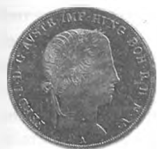
Slika 9: Kurantni srebrnik , 1 tolar konvencijske valute, 1844, Dunaj.

Zaloge srebra narodne banke so se v teh burnih časih hitro manjšale. Iz stanja narodne banke z dne 28. marca 1848 je razvidno, da se je od 28. februarja zaloga srebrnikov zmanjšala za 11.903.166 gld. in je tako znašala samo še 53.155.185 gld. Sicer se je za 15.753.755 gld. zmanjšalo tudi število bankovcev v obtoku, vendar se je pokritost bankovcev znižala od 30,4 % na 26,8 %. 80