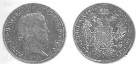
Slika 10: Kurantni srebrnik, 1 goldinar konvencijske valute, 1846, Dunaj.

srebra narodne banke so se bliskovito manjšale. V majskih dneh so se zaloge srebra zmanjšale za 13,091.883 gld. Narodna banka jih je tedaj imela samo še za 21,940.147 gld. Pokritost bankovcev s srebrom je padla na komaj 12,34 %. 101 V teh razmerah narodni banki ni preostalo nič drugega, kot da je v sodelovanju z vlado poskušala pomiriti javnost in zaustaviti odtok srebra iz svojih blagajn.