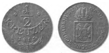
Slika 12: Bakreni drobiž, pol krajcarja konvencijske valute, 1816, Dunaj.

kasnejših letih cena bakra ni bila občutneje višja. Leta 1853 je država odkupovala dunajski cent (56 kg) bakra po 67 gld. 167 V letih 1854–60 se je uradna cena bakra gibala med 65 do 80 gld. za cent bakra. 168 V letih po revoluciji je bila torej kovinska vrednost bakrenega drobiža za 37 do 40 % nižja od njegove imenske vrednosti, v najboljšem primeru (80 gld. za cent) je bila še vedno za 25 % nižja.