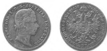
Slika 36: Kurantni srebrnik, četrť goldinarja avstrijske valute, 1858, Dunaj.

Ljudje so lahko imeli velike težave tudi z nekaterimi novimi kovanci, ki so bili po velikosti in teži zelo podobni drugim kovancem, njihova vrednost pa je bila povsem drugačna. Zato je Jože Pleiweis že na začetku leta 1858 svaril pred novimi srebrniki za 1/4 goldinarja, ki jih je bilo prav lahko zamenjati za več vredne srebrnike za 20 kr. iz leta 1852. »Kdor brati zná, se pa ne bo goljufal: na dvajseticah stoji pod cesarskim orlom številka 20, pri 'četrť goldinarju' pa stoji 1/4 fl.« 844 Zabeleženega nisem našel nobenega primera, da bi na Slovenskem nepismeni ljudje imeli težave pri prepoznavanju novega denarja. Vendar so na državni ravni vsaj nekateri prepozno spoznali svojo napako. Zato so se časopisi zavzemali, da bi bilo potrebno te kovance prekovati v nove kovance z bolj različnim napisom. 845