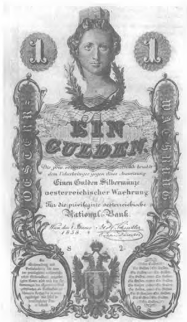
Slika 29: Bankovec avstrijske narodne banke, 1 goldinar avstrijske valute, 1. 1. 1858.