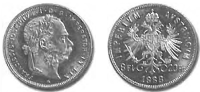
Slika 48: Trgovski zlatnik, 8 goldinarjev = 20 frankov, 1888, Dunaj.

Novice so napoved kovanja novih zlatnikov sprejele s precejšnjo skepsjo: »Kovali se bodo že, – da bi le tudi kedaj spodrinili papirnate bankovce!« 1196 Zlatnikom se v naslednjih dveh desetletjih ni uspelo udomačiti v notranjem denarnem prometu. Ostali so samo trgovski