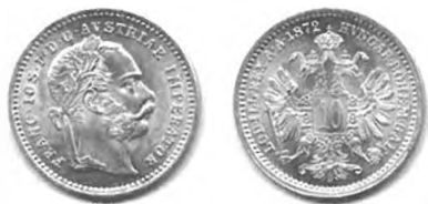
Slika 46: Srebrni drobiž, 10 krajcarjev avstrijske valute, 1872, Dunaj.

Nič pa niso imeli proti temu, da se je skupaj z dualistično ureditvijo novčnega sistema uredilo tudi področje izdajanja drobiža. 1116 Na podlagi leta 1868 sklenjene carinske in trgovske pogodbe med obema polovicama monarhije je bil predviden popoln umik srebrnega drobiža za 6 kr. CM in papirnatega drobiža za 10 kr. iz denarnega obtoka. Vendar zaradi visoke srebrne ačije ni bilo nobene možnosti, da bi se namesto starega in papirnatega drobiža lahko v obtoku obdržal novi drobiž avstrijske valute za 10 kr. Zato sta se vladi obeh polovic monarhije z zakonom z dne 1. julija 1868 preprosto odločili, da bosta začeli izdajati nov srebrni drobiž za 10 in 20 kr., 1117 ki je vseboval veliko manj srebra. Nov drobiž bi se tako lahko obdržal v denarnem obtoku vse dokler srebrna ačija ne bi preseгла 66,66 %. 1118 Da ne bi izgubil svoje nominalne vrednosti, je imel prisilni tečaj do skupne vrednosti 2 gld. 1119