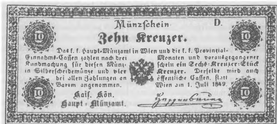
Slika 17: Papirnati drobiž, 10 krajcarjev konvencijske valute, 1. 7. 1849.

Nov papirnati drobiž je prišel v Ljubljano že sredi julija 1849. 211 S tem je bilo sicer odpravljeno pomanjkanje drobiža, vendar je prav prihod papirnatega drobiža iz obtoka dokončno izrinil (več vreden) kovinski drobiž. Večina srebrnega drobiža je odšla v Lombardijo in Benečijo, kjer papirnati denar ni imel prisilnega tečaja, vendar je drobiža prav tako primanjkovalo. Zato so kot drobiž uporabljali tudi avstrijski kovani drobiž. Ker je njegova vrednost slonela na vrednosti kurantnega denarja, so ga tamkaj menjavali po njegovi imenski vrednosti. 212