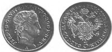
Slika 21: Kurantni srebrnik, 5 krajcarjev konvencijske valute, 1846, Dunaj.

V teh razmerah srebrna ažija ni izginila. Znani učinki ažije na denarni sistem so bili še naprej del avstrijskega gospodarskega življenja. Država je srebro v glavnem uvažala preko Hamburga, 290 tradicionalnega posrednika pri teh poslih. Nekaj ga je dobila tudi iz rudnikov srebra na Ogrskem. 291 Nato so srebro prekovali v kovnici na Dunaju in znova tudi v kovnicah na Ogrskem, zlasti v Kremnici na Slovaškem. 292 Denarja niso prenehali kovati tudi med revolucijo. Še naprej so kovali največ zlatnikov, ki so bili trgovski denar, srebrnikov po 20 kr. 293 in seveda zelo veliko drobiža. 294 »Novo kovaniga denarja je bilo tedaj v enim létu precej – pa kaj pomaga, kér vsak, ki kej zlatnine in srebernine v roko dobi, je več ne izpusti, če le more!« 295 Kakor hitro so novi kovanci prišli v denarni obtok, so preprosto že izpuhteli. S srebrniki se je še naprej pridno prekupčevalo: »Barantači z zlatam in srebriam še zmirej cekine in dvajsetice višji kupujejo, kakor je njihov veljava! Še zmirej ni duha ne sluha od desetic in dvajsetic.« 296