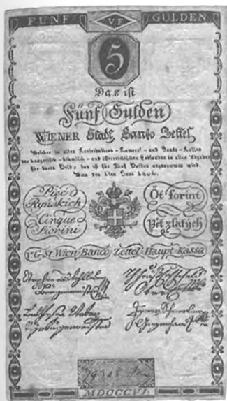
Slika 2: 'Bankovec' Dunajske mestne banke, 5 goldinarjev konvencijske valute, 1. 6. 1806.