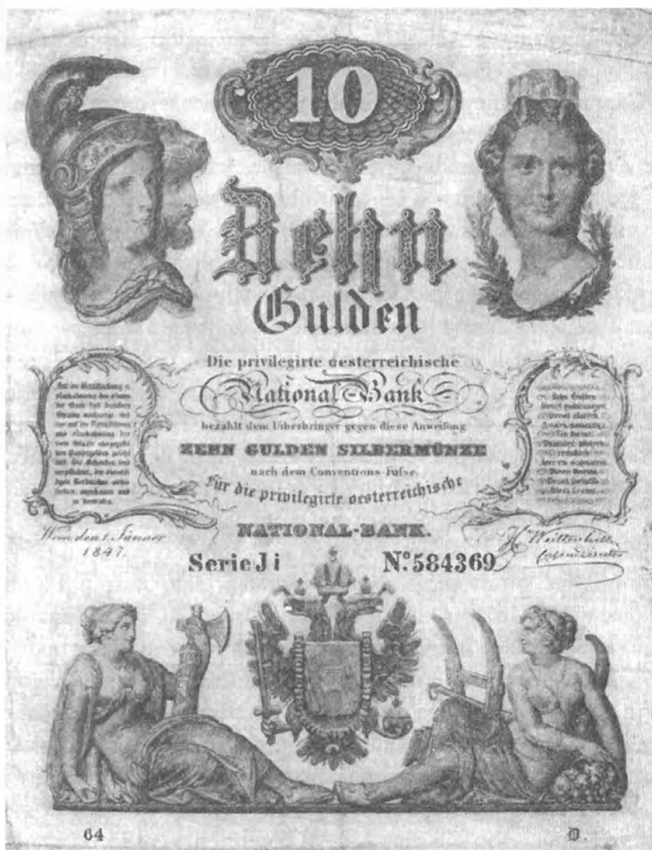
Slika 8: Bankovec avstrijske narodne banke, 10 goldinarjev konvencijske valute, 1. 1. 1847.

tro unovčiti v konvencijski denar in tako zadovoljiti naraščajoče povpraševanje po kovinskem denarju. 58