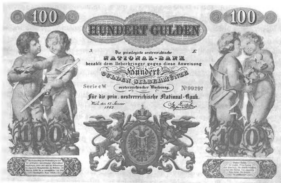
Slika 42: Bankovec avstrijske narodne banke, 100 goldinarjev avstrijske valute, 15. 1. 1863.