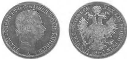
Slika 27: 1 zvezni tolar, 1860, Dunaj.

Dunajska pogodba je urejala tudi področje drobiža. Kovanje srebrnega in bakrenega drobiža je sicer puščala v pristojnosti posameznih držav, vendar je natančno določala