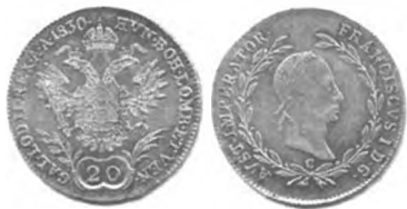
Slika 14: Kurantni srebrnik, 20 krajcarjev konvencijske valute, 1830, Praga.

V predmarčnem obdobju je bil med ljudmi najbolj priljubljen srebrnik po 20 krajcarjev. Ljudje so mu po domače rekli dvajsetica (Zwanziger). Svojo slavo je ta kovanec dolgoval svoji vsesplošni razširjenosti in relativno visoki vrednosti. Zato so bile prav dvajsetice tisti denar, s katerim se je največ prekupčevalo 175 in katerega so imeli ljudje največ skritega po svojih shrambah. 176 Iz denarnega obtoka je skoraj povsem izginil že avgusta 1848. 177 Vlada je pomanjkanje poskušala nadomestiti s kovanjem novih dvajsetic. Tako so samo od novembra 1848 v enem letu skovali 13.653.062 dvajsetic. 178 Vendar so tudi te kmalu izginile iz obtoka. Nihče ni vedel, koliko »teh belih vranov« 179 so ljudje umaknili iz prometa in jih hranili doma. Nekateri časopisi so špekulirali, »de je za 100 milijonov dvajsetic zakopanih, ki ne pridejo na dan«. 180 Veliko tega denarja je izginilo tudi v tujino, kjer so ga večinoma pretopili v tuje srebrnike. Tako naj bi od februarja 1848 do srede leta 1852 samo kovnice v Parizu pretopile več kot 30 milijonov dvajsetic. 181 Kovnice v Bruslju so jih pretopile za 22 milijonov gld. 182