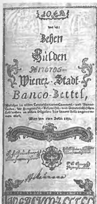
Slika 1: 'Bankovec' Dunajske mestne banke, 10 goldinarjev konvencijske valute, 1. 7. 1762.

novih posojil. Zato je pooblastila ugledno Dunajsko mestno banko ( Wiener Stadtbank ), 26 da je v njenem imenu emitirala za 12 milijonov gld. državnega papirnatega denarja. Ker je izdajatelj hotel ustvariti videz, da tega papirnatega denarja ne izdaja država, temveč banka, je denarju nadel ime 'bankovec' (Bankozettel) . 27 To je bil neobrestovani državni papirnati denar brez prisilnega tečaja. 28 Vendar so ga obvezno sprejemale vse državne blagajne. Državni papirnati denar ni bil zakonito plačilno sredstvo, temveč je bilo zakonito plačilno sredstvo konvencijska valuta. Njegova nominalna vrednost se je zato glasila na konvencijske goldinarje.