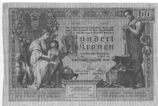
Slika 58: Bankovec avstroogrške banke, 100 kron kronske valute, 2. 1. 1902.

po 100 in 1000 kron je počasi zamenjala za stare bankovce po 100 in 1000 gld. Bankovci po 1000 gld. so tako prenehali veljati šele konec leta 1910. 1535