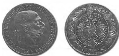
Slika 52: Srebrni drobiž, 5 kron kronske valute, 1907.

Nova valuta je bila šepajoča zlata valuta. Zato so bili kot kurantni srebrniki še naprej v uporabi srebrniki po 2, 1 in 1/4 goldinarja avstrijske valute, čeprav jih vlada ni smela več na novo kovati. Njihova vrednost v kronah je bila: 2 gld. = 4 K, 1 gld. = 2 K, 1/4 gld. = 1/2 K. Vendar so kurantni srebrniki po 2 in 1/4 gld. veljali samo do 1. junija 1893. Po imenski vrednosti se jih je dalo zamenjati še do 31. julija 1893, 1451 potem so bili v obtoku samo še kurantni srebrniki po 1 gld. Po letu 1899 je država velik del kurantnih srebrnikov prekovala v srebrni drobiž po 5 kron. Po letu 1907 jih je prekovala v nov kontingent srebrnega drobiža po 5 kron. Po letu 1912 jih je zamenjala z vrednostno enakim drobižem po 2 kroni in z novim kontingentom srebrnega drobiža po 1 krono. Kot trgovske srebrnike so še naprej prosto kovali levantinske tolarje (Marije Terezije). 1452