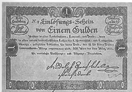
Slika 3: Zamenjalni bankovec, 1 goldinar konvencijske valute, 1. 3. 1811.

gibanji, je morala država proračunski deficit financirati s tiskanjem vedno novega denarja. Problem se je tako samo še zaostroval. Da bi se država rešila iz tega začaranega kroga, se je leta 1811 odločila za radikalen poseg. Po zgledu držav na robu bankrota je za polovico prisilno znižala obrestno mero državnih obveznic. Hkrati je nominalno vrednost starega državnega papirnatega denarja znižala na eno petino. Pri obvezni zamenjavi starega papirnatega denarja za novega v razmerju 5 : 1, so ljudje za pet starih 'bankovcev' dobili eden novi zamenjalni bankovec ( Einlösungsschein ). Denarna enota novega zamenjalnega bankovca se je prav tako kot denarna enota starega 'bankovca' glasila na goldinar konvencijske valute. S to devalvacijo se je količina papirnatega denarja v obtoku zmanjšala z dobre milijarde gld. na okoli 212 milijonov gld. zamenjalnih bankovcev.