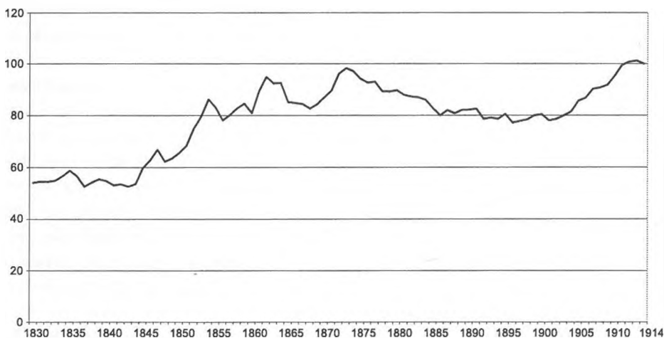
Graf 1: Indeks cen življenjskih stroškov v avstrijski polovici habsburške monarhije od leta 1830 do leta 1914 (1914 = 100). 8

Za čim bolj natančno določitev vrednostnega razmerja med starim in novim denarjem bi v prvi vrsti potrebovali čim bolj natančen indeks gibanja ravni cen v obdobju, ko je bil star denar v obtoku, in pa vse do danes. Na tej podlagi bi bilo nato mogoče izračunati kupno moč starega denarja v zelenem letu v primerjavi s kupno močjo današnjega denarja. Za 19. stoletje sicer obstaja indeks cen življenjskih stroškov za avstrijsko polovico habsburške monarhije, ki ga prikazuje spodnji graf. Vendar ta indeks vse doslej še ni bil usklajen z indeksi gibanja cen življenjskih stroškov v stari Jugoslaviji, med drugo svetovno vojno, v novi Jugoslaviji in v Republiki Sloveniji. Zato (še) ne moremo primerjati kupne moči starega avstrijskega denarja s kupno močjo današnjega tolarja ali vsaj evra.