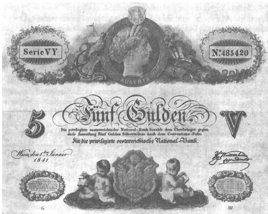
Slika 7: Bankovec avstrijske narodne banke, 5 goldinarjev konvencijske valute, 1. 1. 1841.