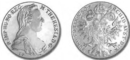
Slika 28: Tolar Marije Terezije.

Pogodba je predvidevala tudi kovanje dveh zveznih trgovskih zlatnikov za 1 krono in pol krono. Ti zlatniki v notranjem plačilnem prometu niso imeli prisilnega tečaja. Predvideni so bili samo za zunanjo trgovino. Njihova vrednost je bila prepuščena tržnim razmeram. S tem so odstranili nevarnost, da bi v denarnem obtoku prevladali precenjeni zlatniki. Poleg zveznih zlatnikov je bilo prepovedano kovati še kakršne koli druge zlatnike. Edina izjema so bili dukati, ki jih je Avstrija lahko kovala do leta 1865. Stari in tuji zlatniki so lahko še naprej ostali v denarnem obtoku. Avstriji je bilo kot trgovske srebrnike še naprej dovoljeno kovati levantinske tolarje, tako imenovane tolarje Marije Terezije. Ti so bili nepogrešljivi pri trgovanju z Bližnjim vzhodom.