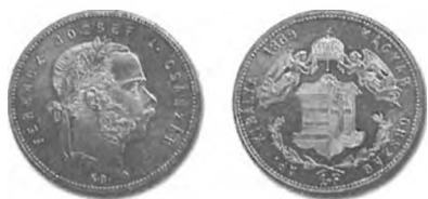
Slika 45: Kurantni srebrnik, goldinar avstrijske valute, 1869, Kremnica.

sistema. Zato ga je bilo potrebno čim prej odstraniti. Te naloge se je avstrijska država lotila šele po sklenitvi nagodbe in nastanku dualistične Avstro-Ogrske. Ker je ureditev novčnega sistema spadala pod skupne pristojnosti obeh polovic monarhije, je bilo sedaj potrebno tudi prej enotnem kovnem sistemu dati dualistično podobo. Od takrat so na Ogrskem sicer kovali denar po enaki novčni stopnji kot v avstrijski polovici monarhije, vendar so ogrski kovanci nosili madžarske napise in ogrski grb, avstrijski kovanci pa latinske in tudi nemške napise in avstrijski grb. 1114 Slovenci, ki nad dualistično ureditvijo monarhije niso bili prav nič navdušeni, so z odporom sprejeli tudi to simbolično ločitev habsburškega novčnega sistema: »Tako postopajo Magjari čedalje bolj naprej pa proč od nas.« 1115