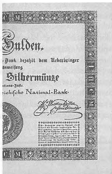
Slika 18: Raztrgani goldinarski bankovec avstrijske narodne banke, 30 krajcarjev konvencijske valute, 1848.

Ta način privatne proizvodnje papirnatega denarja manjše nominalne vrednosti se je hitro udomačil. Zaradi njihove vsesplošne razširjenosti so kmetje četrtnam bankovcem (15 kr.) po domače pravili tudi »flike«. 213 To prakso je sprva aktivno podpirala tudi vlada, ki je raztrgane bankovce brez problemov sprejemala. 214 Z nastalo prakso se je nazadnje morala sprijazniti tudi narodna banka. 20. januarja 1849 je razglasila: »Za zamenjavo se bodo sprejemale tudi polovice in četrtnine bankovcev.« 215