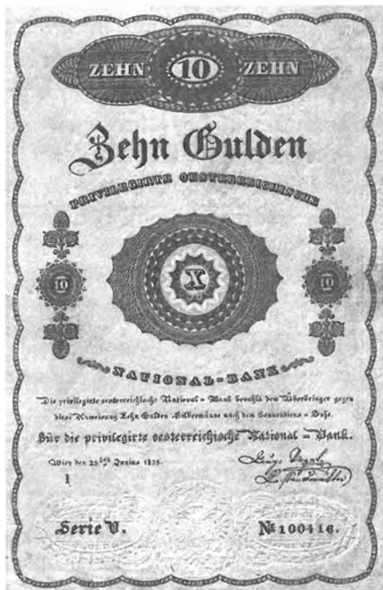
Slika 5: Bankovec avstrijske narodne banke, 10 goldinarjev konvencijske valute, 23. 6. 1825.

S konverzijo državnih dolgov je državi sicer uspelo delno zmanjšati število državnega papirnatega denarja, 40 vendar ga je bilo leta 1818 v obtoku še vedno za več kot 500 milijonov gld. S prodajo delnic avstrijske narodne banke je bilo iz obtoka umaknjenih nadaljnjih 50 milijonov gld. WW. Ker pa država ni imela dovolj srebra, je banka namesto srebra od države za papirnati denar prevzela 2,5-procentne neodtujljive obveznice, ki bi jih država nato morala odplačati v 36 letih. Ker so bile te državne obveznice za narodno banko dober in predvsem zanesljiv posel, je bila banka zelo zainteresirana za nadaljnje sodelovanje pri podobnih kreditnih operacijah. Leta 1820 je od države prevzela zamenjavo preostalih 450 milijonov gld. WW, in sicer po takrat že utrjenem tečaju: 100 gld. bankovcev = 250 gld. dunajske valute.