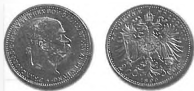
Slika 51: Kurantni zlatnik, 20 kron kronske valute, 1899, Dunaj.

Iz enega kilograma istega zlata se je skovalo 3280 kron. Za zlatnike po 20 kron je v Avstriji e od vsega začetka veljala kovna prostost, zlatnike po 10 kron so kovali samo na raun drzave. 1447 Za privatne osebe je kovnina znaala 6 kron od kilograma istega zlata, za narodno banko le 4 krone. 1448 Kurantne zlatnike se je lahko e od vsega začetka uporabljalo v plailnem prometu, eprav je bila v veljavi e avstrijska valuta. Ker drzava zlatnikov e ni poiljala v obtok, so kroili le zlatniki, ki so bili skovani na privatni raun. Menjalno razmerje je bilo 20 K = 10 gld., 10 K = 5 gld. Od 28. decembra 1892 je bilo z zlatimi kronami mogoe plaevati vse obveznosti, za katere je bilo izrecno doloeno, da jih je potrebno plaevati z zlatimi goldinarji (zlasti carine). Vrednostno razmerje je bilo: 42 zlatih goldinarjev = 100 kron. 1449 Zlatnike po 8 in 4 gld. so takoj prenehali kovati, kot trgovske zlatnike pa so e naprej kovali dukate. 1450