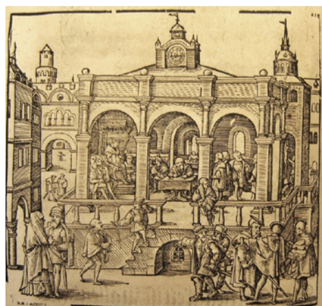
Franciškanska gimnazija v Novem mestu v 17. stoletju