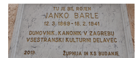
Spominska plošča J. Barlètu v Budanjah (2019)