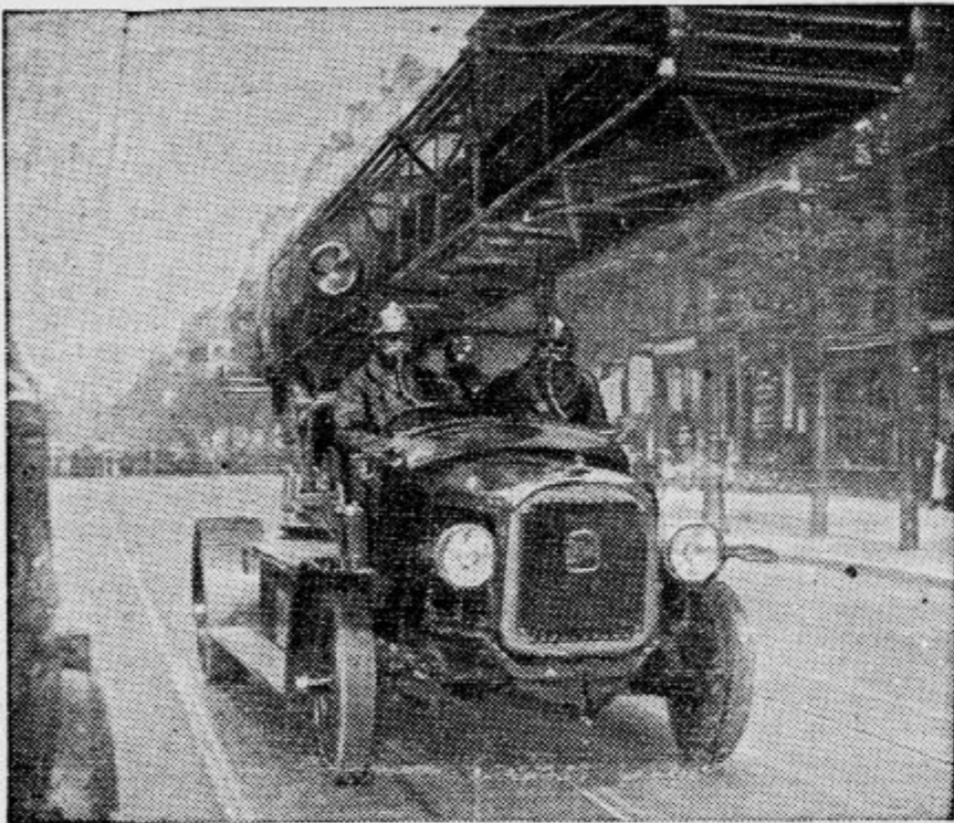
V Parizu so vprizorili te dni fingiran napad iz zraka s plinskimi bombami. Sodelovali so tudi gasilci, ki so nastopali v plinskih maskah