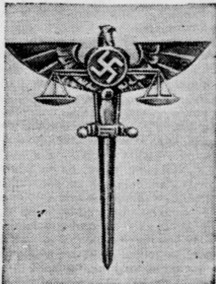
so simbolični znaki nemških juristov sedanjega režima