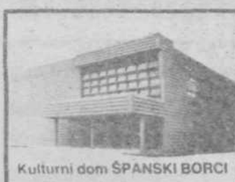
Kulturni dom ŠPANSKI BORCI

Pa se to: Prodaja kart za vse predstave je dan pred vsako predstavo in dve uri pred njenim začetkom pri blagajni kulturnega doma Španski borci, Zaloška 61. Napovedovali bomo predstave v dnevnem tisku in — če bo le mogoče — tudi v občinskem glasilu Naša skupnost. P. O.