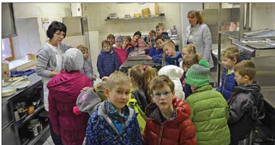
Ljubenski učenci so se ob peki šnit v učni kuhinji spoznavali z nekaterimi šegami in običaji lokalne preteklosti.

Razredničarki sta jim predstavili nekaj lokalnih šeg in navad. Mednje sodi tudi priprava šnit, to je v jajčno maso namočenega in ocvrtega kruha. Pripravili so jih v učni kuhinji, razredničarki pa sta jim predstavili običaj, kako so fantje na dan pred florjanovim pobirali jajca in nato priredili jajč'co, na kateri so pekli šnite. Pekli