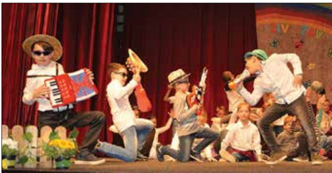
Učenci podružnične šole iz Bočne so se prelevili v glasbenike in plesalce.