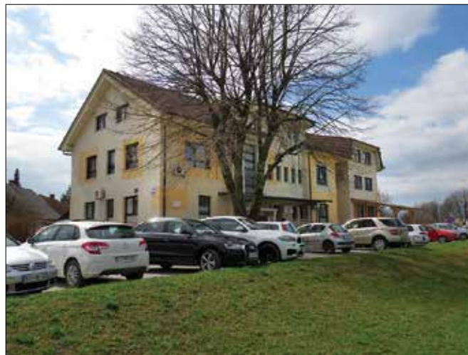
Da so zdravniki v Nazarjah zelo obremenjeni, priča tudi vsakodnevna zasedenost parkirišča pred zdravstveno postajo, kakor je bilo tudi ob obisku ministra za zdravje.

Na osnovi pogovora med ministrom Šabederjem in Esovo je bil v tem tednu sklican sestanek z direktorji sosednjih zdravstvenih domov Velenje, Žalec, Celje, Slovenj Gradec in Kamnik ter strokovnim vodjem z zdravstvenega ministrstva. Skupaj so iskali rešitve glede zagotavljanja NMP. Kakšni so bili dogovori, do zaključka te številke Savinjskih novic nismo izvedeli in bomo o njih poročali prihodnjč.