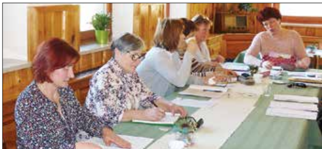
Z resnim pristopom so tečajnice dobro izrabile tokratno izobraževanje.

V organizaciji mozirske izpostave Kmetijsko gozdarskega zavoda Celje je na turistični kmetiji Loger v Savini potekal tečaj angleščine za nosilce turistične dejavnosti na kmetiji. To je bil nadaljevalni tečaj, ki se ga je udeležilo enajst tečajnic. Prav gospodinje so namreč tiste, ki so na turističnih kmetijah v večini primerov v stiku z obiskovalci – tujimi gosti, kjer je znanje angleščine dandanes skoraj nujno.