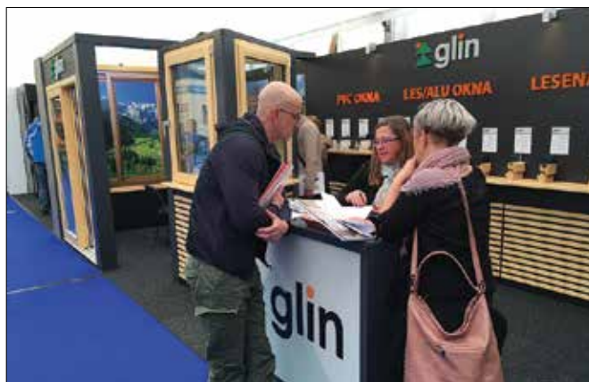
Kupci dobijo na Glinovih stojnicah propagandni material tudi v tujih jezikih in vedno dobrodošle informacije.

S poslovnim rezultatom lanskega leta so zadovoljni, so pa vedno možnosti za izboljšave, predvsem v smeri povečanje prodaje na tujih trgih in posodobitve proizvodnje. Zadovoljni so tudi z rezultati letošnjega prvega tromesečja.