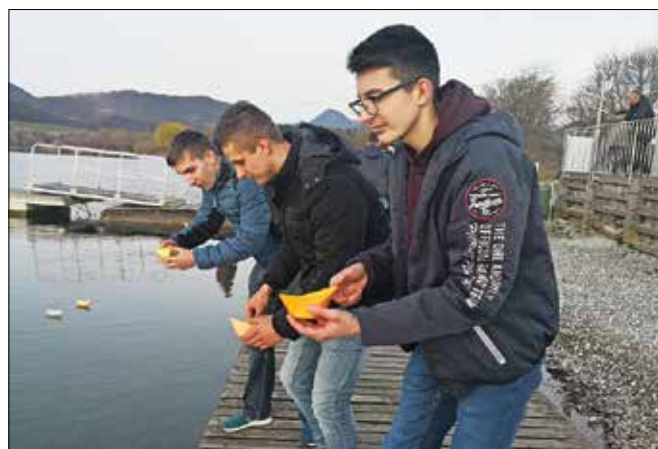
Dijaki in učitelji opozarjajo na razumno in varčno rabo energije.