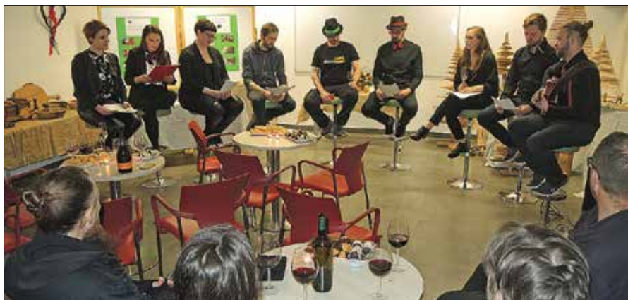
Nastopajoči so s pesmijo in branjem poezije v Medgen hiši ustvarili intimno salonsko vzdušje.