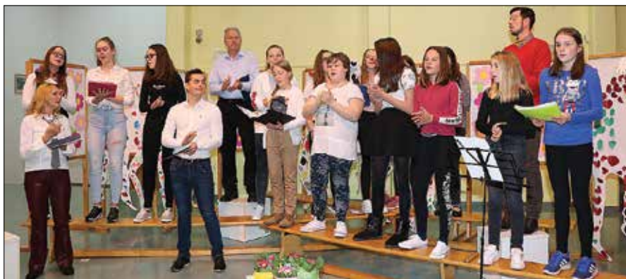
Na letošnji prireditvi so v programu za mamice moči združili recitatorji KUD Utrip in MPZ Osnovne šole Rečica ob Savinji.

Scenaristka programa Silva Prisljan je predstavila nekaj razmišljanj o življenju, ljubez-