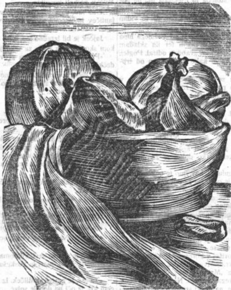
Milica Potepinka velikonočne sanje in cilj...