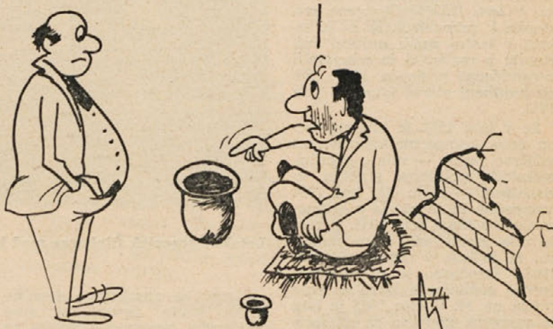
V malem klobuku zbiram denar za avto, v velikem pa za bencin!