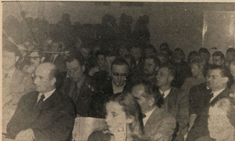
Komunisti so na tej konferenci izvolili novo vodstvo organizacije.