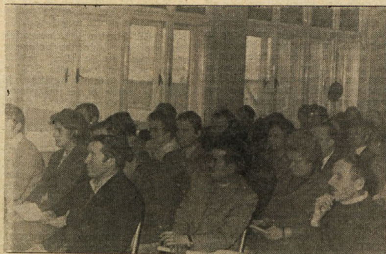
KOMUNISTI O SVOJEM DELU IN NALOGAH. Na nedavni konferenci so komunisti kritično ocenili svoje delo, spregovorili pa so tudi o svojih prihodnjih nalogah. Na sliki: udeleženci poslušajo referat sekretarja.