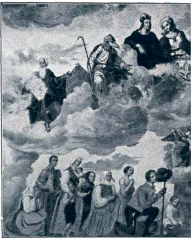
Sl. 42. Langus M.: Portretna skupina na Šmarni gori.