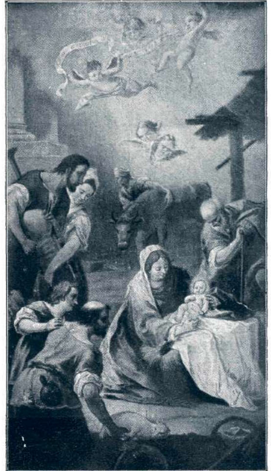
Sl. 40. Layer L.: Rojstvo (1791).