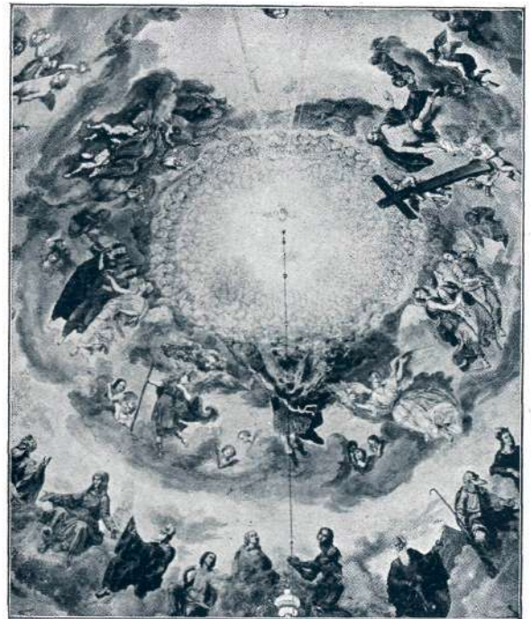
Sl. 43. Langus M.: Kupola na Šmarni gori (detajl).