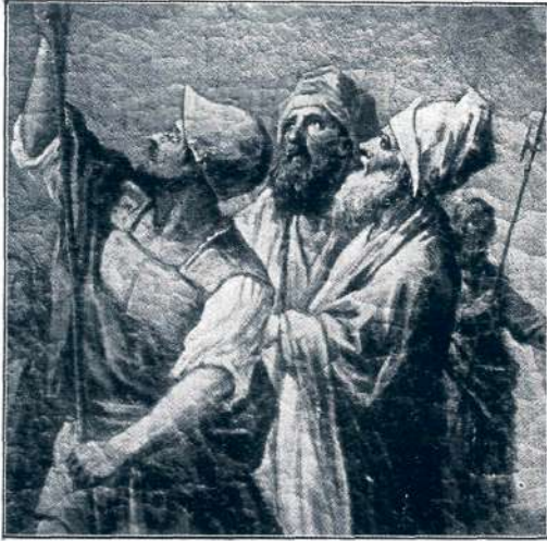
Sl. 39. Layer L.: Križanje (detajl).