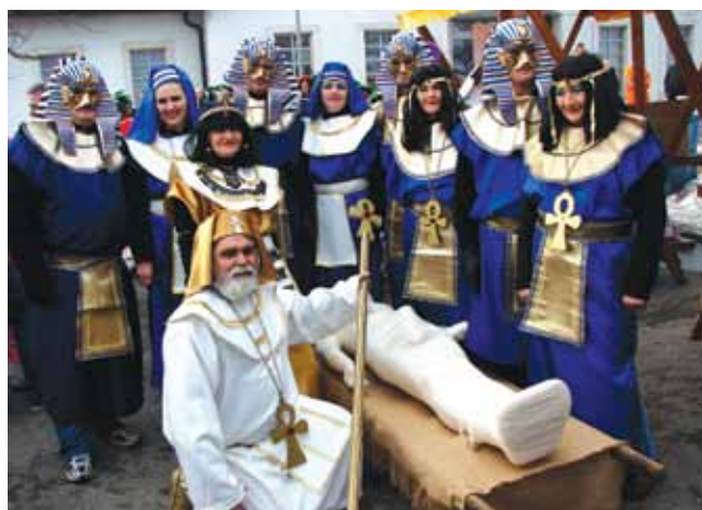
Zmagovalni Egipt: Faraoni, Kleopatra, Amon ra in drugi – člani KTD male rijtar Tešanovci