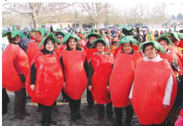
Jagode-učitelji DOŠ Prosenjakovci