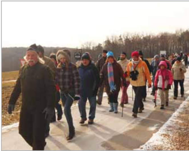
Dobrih 100 pohodnikov se je udeležilo Prešernovega pohoda

V Tešanovcih smo kulturni praznik in spomin na našega največjega poeta počastili s pohodom. Vaška društva so v nedeljo, 5. februarja 2012, organizirala že tradicionalni 9. Prešernov pohod. Prireditve se je udeležilo dobrih 100 pohodnikov, ki so se izpred vaško – gasilskega doma, podali na 14 km dolgo pot. Le ta jih je vodila proti Moravskim Toplicam, Gornjim Moravcem, Suhemu Vrhu in nazaj proti Tešanovcem. Ljubitelji športa in narave so se