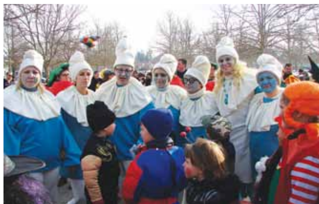
Smrkci – učitelji OŠ Bogojina