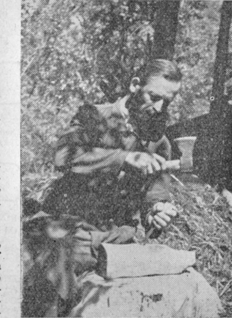
Pri oblikovanju svojih del iz lesa uporablja »mojster« samo tole sekirico in diletu...

»Kip sem začel delati že leta 1955, letos junija pa je bil izgotovljen. Ker nisem imel zato primernega lesa, sem posekal lipo, ki je stala pred hišo. Kip je izklesan ves iz enega kosa s podstavkom vred. Dve leti sem delal, klesal in izpopolnjeval, da sem dobil takšno obliko, s katero sem bil zadovoljen. Pozneje sem kip prebarval še z oljnatimi barvami. Za model mi je služila slika, ki sem jo videl v knjigi »Pri-