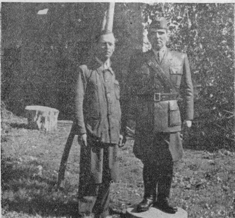
Tu vidimo oba. Umetnika in njegovo delo. Pri vsem tem ni toliko pomembna precejšnja podobnost z likom Maršala v medvojni letih, veliko bolj vztrajnost samouka.

Lahko rečem, da sem delal nepretrgoma pol leta in več kot dvajset noči brez spanja. Seveda sem delo večkrat prekinil in nadaljeval, ko mi je čas