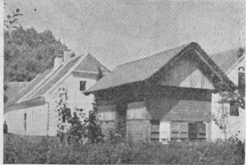
Napreden kmet, si je mislil reporter, ko je posnel tale prizor v Škofji vasi. Čebele so v rojih letale na bližnja ajdova polja. Pred čebelnjakom mlad nasad sadnega drevja...