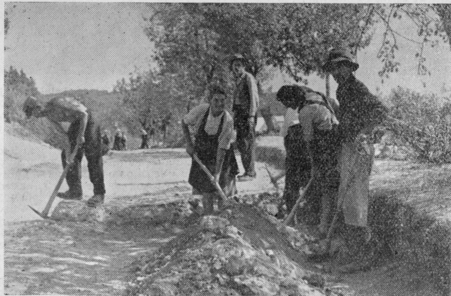
Pri razširjanju ceste Vojnik—Dobrna smo na film »ujeli« tole skupino delavcev. Zaposluje jih okrajna uprava za ceste. Mnogi med njimi so sezoni iz bližnjih vasi. Zasluzek? Dekle v sredini je povedalo, da zasluži 35 din na uro. Veliko ni, toda vsak dinar pride prav, če je bolezen v hiši, zemlje pa ni toliko, da bi lahko vsi brez pomanjkanja živeli. . .

Mislil sem, da bom umrl, kajti rok ne nog nisem več čutil in tudi hrbtnica je bila trda. Vendar sem se smejal in bodril mater, ki je tako obupno jokala. V Celju sem ostal 2 meseca, potem pa so me poslali v Kamnik v Dom invalidske mladine. Tam sem delal vaje