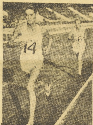
Anglež Gordon Pirie (spredaj), novi svetovni rekorder v teku na 5 km

Preteklo nedeljo je bilo zaključeno možtevno prvenstvo Italije v atletiki. Letos je naslov prvaka osvojilo moštvo Flamme Gialle iz Rima, pred ekipo Assi Giglio Rosso iz Firenz.