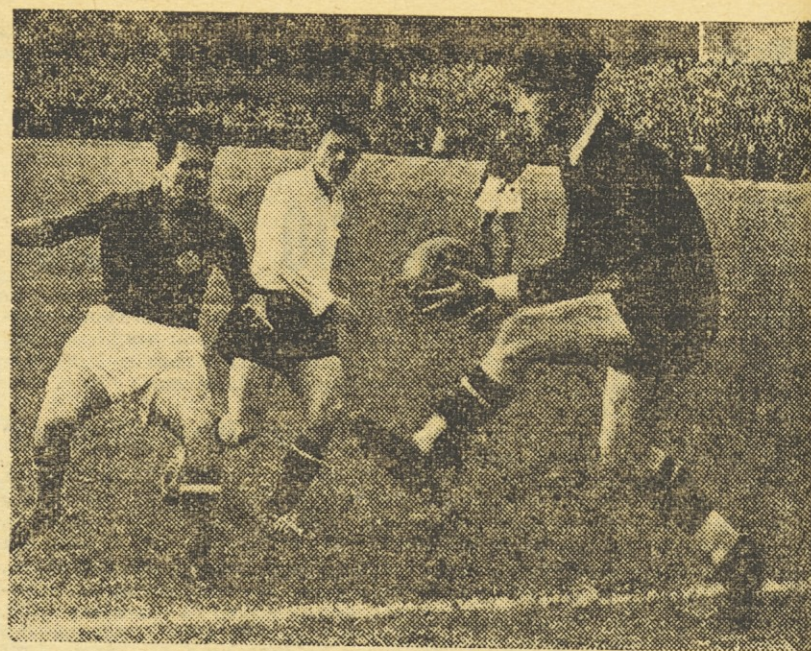
Tudi Zebec ni mogel ukiniti avstrijskega vratarja