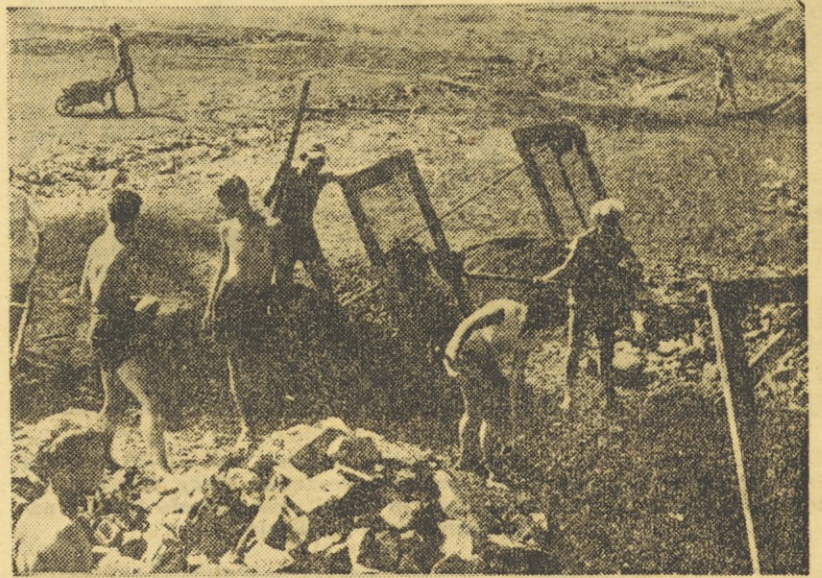
Marljive so roke brigadirjev, ki grade športni stadion na Viču