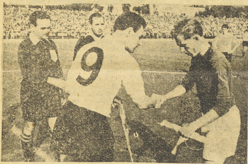
Vukas in Wagner sta izmenjala darili