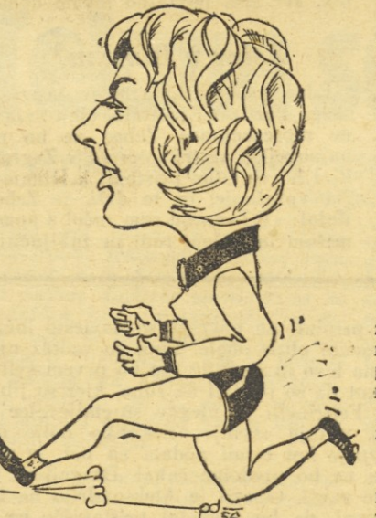
Knez Marija (Odred) nova državna rekorderka v teku na 800 m

V poročilu o slovenskem atletskem prvenstvu za preteklo število smo napravili tudi pregled uspehov posameznih društev na tem prvenstvu, vendar je isti zaradi pomanjkanja prostora izpadel. Posamezna društva so na prvenstvu Slovenije zasedla naslednje številne prvih, drugih oz. tretjih mest: Kladivar 6 prvih, 8 drugih, 7 tretjih, Ljubljana 6 prvih, 5 drugih, 4 tretja, Odred 4 prva, 4 druga in 3 tretja, Svoboda 2 prvi, eno tretje, Maribor 1 prvo, JLA 2 drugi, 1 tretje, Kočevo 1 drugo. To so bili uspehi pri moških, pri ženskah pa so prva tri mesta osvajale izključno atletinje Odreda in Kladivarja.