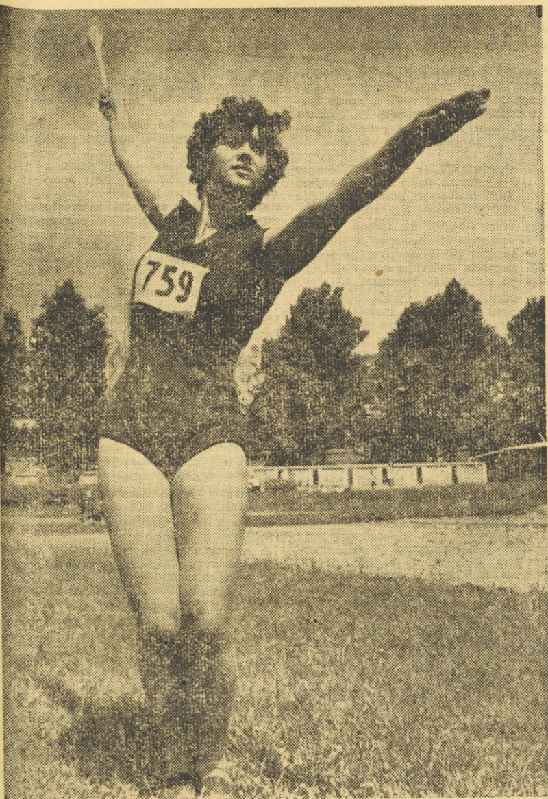
Skupščina Smučarske zveze Slovenije

bil v teku na 10.000 m z rezultatom 30:15.0 drugi za Bolgarom Vučkovom 30:14.9. V metu krogle je zmagal Čeh Skobla s 17.05, Radošević pa je bil s 14.90 peti. V teku na 100 m je bil Pecljč četrti. Košarkarska reprezentanca Sovjetske zveze je v Santiagu premagala izbrano moštvo Čila z 92:56. Reprezentanca Avstrije v rokometu je napravila veliko presenečenje s svojo današnjo zmago nad izbrano ekipo CSR s 16:15 (8:7).