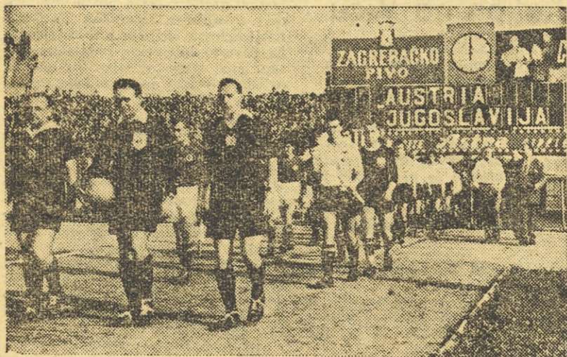
Takole se je začelo: med navdušenim vzklikanjem 45.000 gledalcev sta prikorakali obe reprezentanci na stadion Dinama v Maksimiru