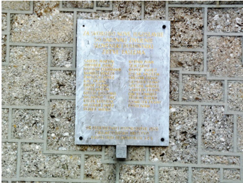
Plošča 25 duhovnikom, žrtvam fašizma na Brezjah, pred odstranitvijo leta 2014