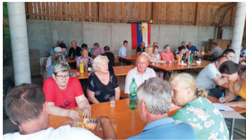
V Slovenskih goricah so dan državnosti počastili s srečanjem pri bolnici Cafa