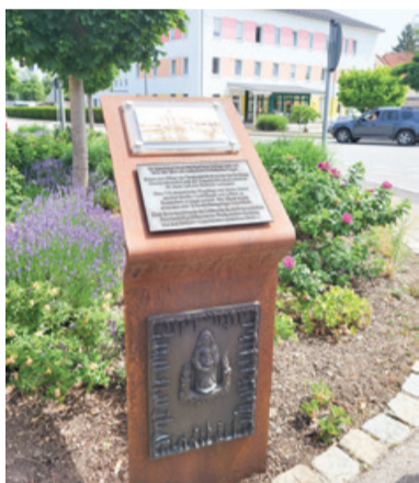
Spominsko obeležje v Mainburgu

Posledice teh nemških navodil so občutile številne slovenske družine, ki so sodelovale v narodnoosvobodilnem boju ali so bile kakor koli povezane s partizani. Nemci so jih s pomočjo domačih izdajalcev pregnali z njihovih domov. Moške so usmrtili v celjskem zaporu Stari pisker, Begunjah in mariborskih zaporih, matere pa odpeljali v koncentracijsko taborišče Auschwitz-Birkenau. Otroke so iztrgali iz materinih naročij in jih odpeljali v različna otroška taborišča po Bavarski. Dojenčke, ki so ustrezali njihovim ravnim merilom, so oddali v posvojitve nemškim družinam.