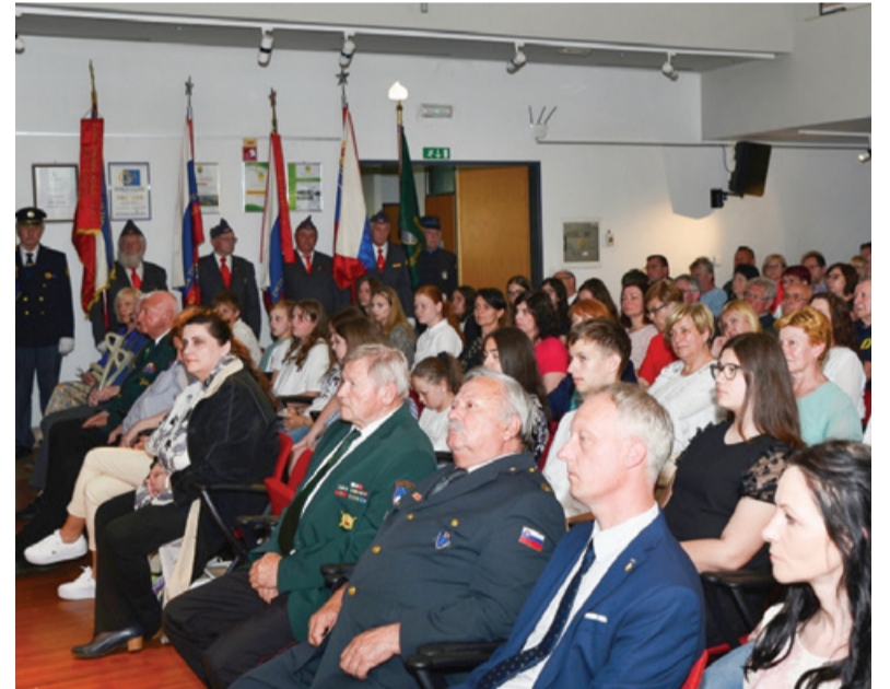
Sklepna prireditev v Puconcih 25. maja

Iz dosedanjih natečajev in dejavnosti ugotavljamo, da mladi danes pri zgodovinskih dogodkih izhajajo iz pozitivnega zgodovinskega spomina, vendar o tem pišejo drugače, predvsem v duhu miru in soži-