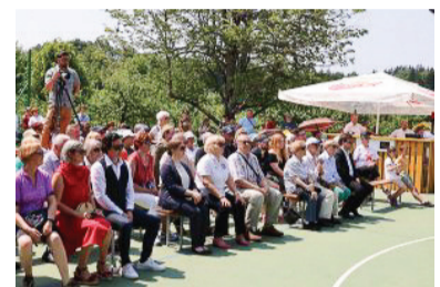
Udeleženci spominke slovesnosti

ne. Zgodovinarji pa seveda želimo in moramo ohranjati predvsem zgodovinski spomin. Če hočemo Slovenci in Evropejci kot skupnost preživeti, ne smemo pozabiti. Če bomo to storili zato, ker se danes stvari, ki so se dogajale nam, zdaj pač dogajajo drugim, se nam bo zgodovina vrnila. Razmišljanje, da se take stvari dogajajo drugim, nam pa se ne morejo več zgoditi, je zelo kratkovidno. Zato ne pozabimo: vsaka nova vojna se začne, ko prva