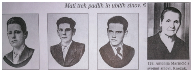
Čukova mama in njeni trije sinovi, ki so dali življenje za domovino.

Na srečo je prišlo do razpada Italije in so se vsi štirje domači izčrpani in uničeni vrnili iz zapora. Toda takrat se je vse najhujše šele začelo. Že po nekaj dneh sem izgubila prvega, najmlajšega brata, starega komaj sedemnajst let. Medtem ko je partizanom delil hrano, je pripeljal tovornjak in ga povozil. Najstarejši brat s partizanskim imenom Čuk je bil ves čas zelo dejaven pri