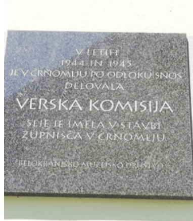
Spominska plošča verski komisiji

varstvo kulturne dediščine Slovenije, Območna enota Novo mesto. Ta je s tehtnimi argumenti zagovarjala vrnitev spominske plošče verski komisiji na prvotno mesto.