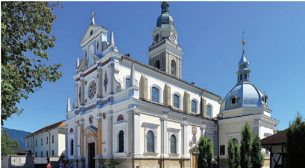
Bazilika Marije Pomagaj, Brezje. Plošča se vidi spodaj levo

za razliko od kolaborantskega vodstva slovenske RKC po vojni lojalno do nove socialistične oblasti. Pri zavračanju društva je prav nič ne ustavlja dejstvo, da so bili med njegovimi vidnimi člani znane osebnosti. Pobudnik in idejna ter moralna avtoriteta je bil pisatelj Franc Saleški Finžgar, ki je bil med vojno sodelavec Osvobodilne fron-