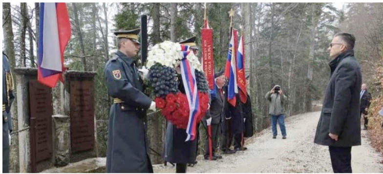
Minister Marjan Šarec je položil venec k spomeniku in bil slavnostni govornik.