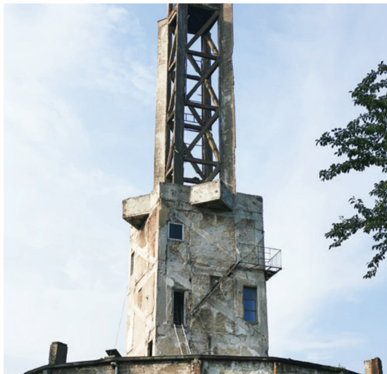
Ostanki stolpa v nekdanjem taborišču

Sejmsko območje danes leži v Novem Beogradu, nekdanjem Zemunu. Odprto je bilo leta 1938 v tedaj mogočnem futurističnem arhitekturnem slogu in je veljalo za najsodobnejše v Evropi. Po napadu Nemcev na Jugoslavijo je ta del mesta prešel v roke Neodvisne