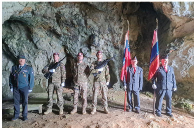
Osrednja prireditev je bila pri Taborski steni.