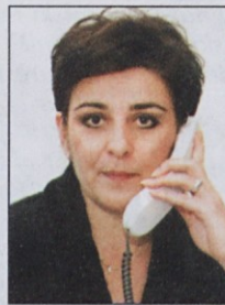
Piše: Lidija Jerkič univ. dipl. iur.