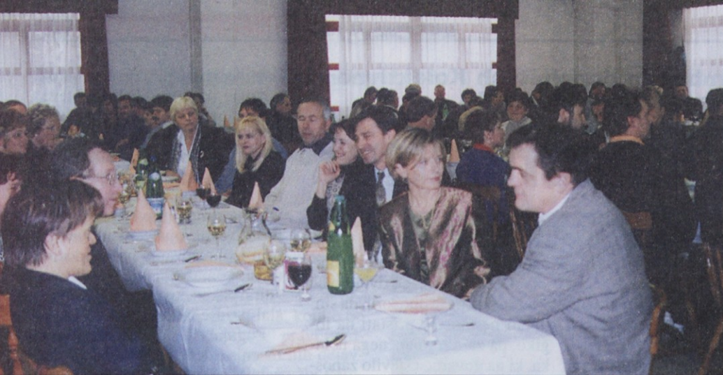
V Steklarskem hramu se je zbralo 150 sindikalnih zaupnikov in funkcionarjev.

Sindikalni zaupniki s celjskega območja so se zbrali v Rogaški Slatini