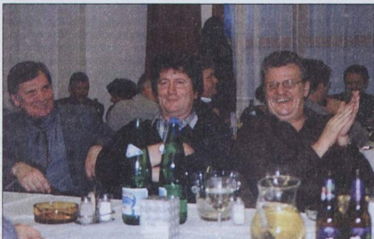
Za prijatelje si je treba vzeti čas.

vedal marsikaj takšnega, kar sindikalni zaupniki slišijo tudi v svojih podjetjih, vendar se svojim direktorjem ne morejo, pa tudi ne upajo tako smejati. Po zares bogatem in zanimivem programu so udeleženci srečanja preživeli nekaj prijetnih uric ob pogovorih, izmenjavi izkušenj in tudi ples.