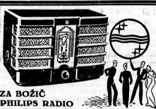
ZA BOŽIČ PHILIPS RADIO

Sprejemam zdravno, snažno dekle, vajeno kuhe in drugih gospodinskih del. Naslov v upr.