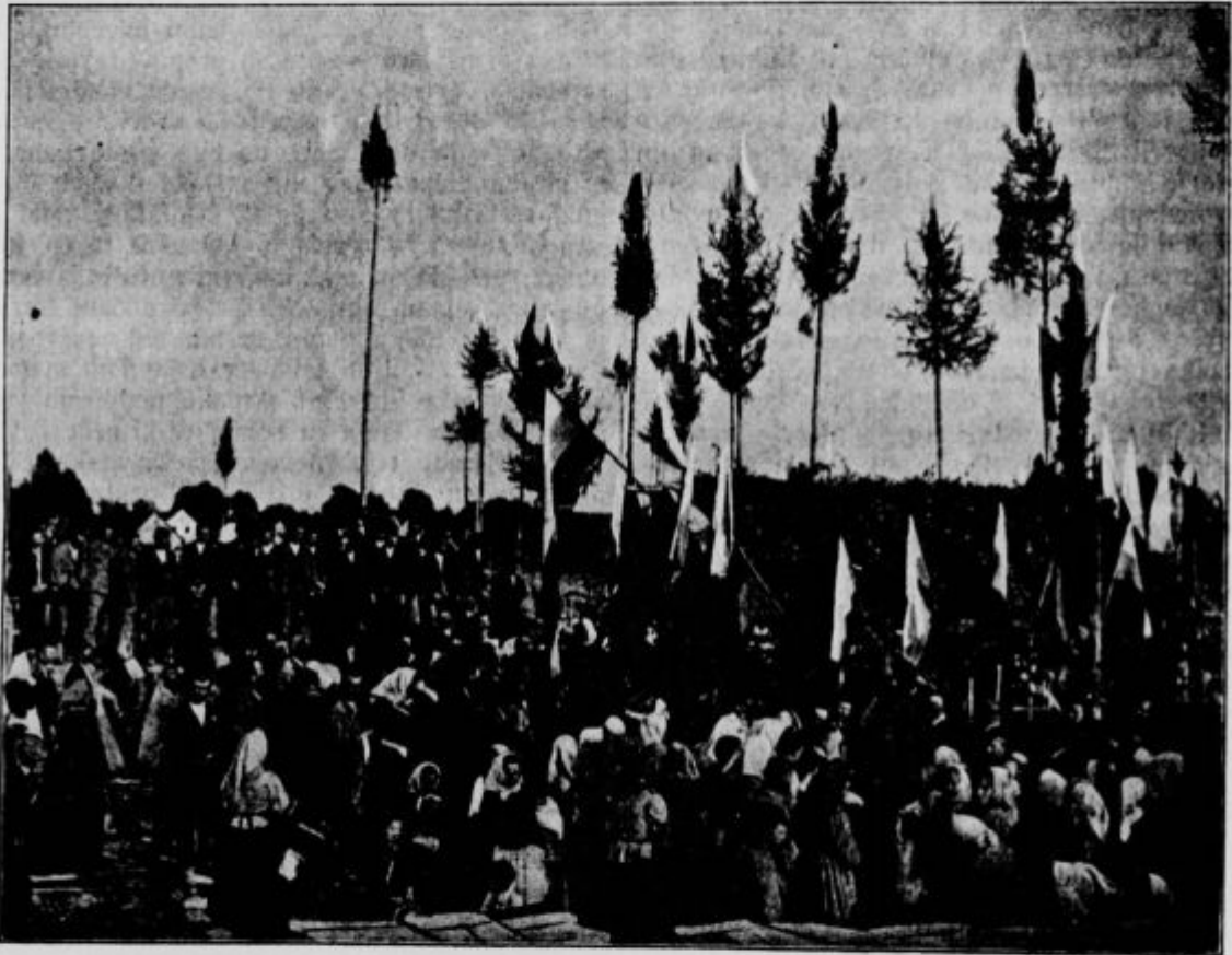
Blagoslovljenje vogelnega kamena pri »Škofovih zavodih« v Št. Vidu nad Ljubljano.

odstopiti Angležen pokrajino Withewaterrand sè zlatimi rudniki. Sicer so pa pripravljene nadaljevati vojno, dokler ne izvojujejo popolne neodvisnosti. Sedaj se poroča, da Krüger niti ne misli ne na kako pogajanje. Kitchener brzojavlja med drugim, da so se Buri na severovzhodnem delu Oranje zopet združili pod poveljništvom Deweta. Torej so bile vse one angleške vesti o Dewetovi smrti le pobožna želja. Neka privatna brzjavka iz angleškega vira javlja, da je sedem osmin vsega kaplanskega prebivalstva v odkriti ustaji. Najnovejša vest se pa glasi: Vojni minister Brodrick je v govoru, ki ga je imel nedavno, pripisoval krivdo na podaljšanju južno-afriške vojne predobrohotnemu postopanju z