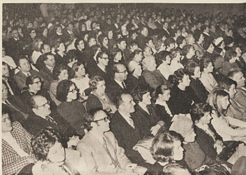
Pogled v dvorano gledališča Verdi med prvo slovensko predstavo.

Dne 10. maja je bil v Nabrežini občni zbor staršev učencev srednje šole Igo Gruden. Po poročilu o dejavnosti roditeljskega sveta je bila živahna diskusija zlasti o vprašanju prevoza otrok v šolo in domov. To vprašanje je bilo že večkrat na dnevnem redu tudi na sejah občinskega sveta. Občinski svetovalci levico so zahtevali, da se to vprašanje čimprej reši v korist otrok, staršev in občine, a vse prošnje so naletele na gluha ušesa. Ta pereči problem je bil prisoten tudi na vsaki seji sveta staršev. O zadevi sami so bili obveščeni občinska uprava, šolski patronat in tudi širša javnost. Starši učencev se z ogorčenjem sprašujejo, kako da se ta zadeva vleče skozi celo šolsko leto, ne da bi jo rešili