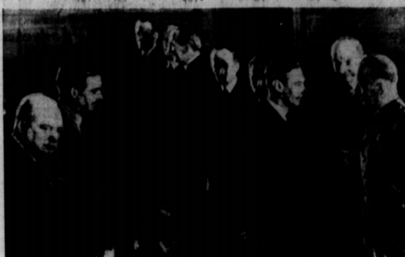
Dne 12. junija se so zbrali v Londonu zastopniki štirinajstih dežel in soglasno sklenili, da bodo vztrajali v vojni s Hitlerjem, dokler se bo poražen. Na sliki od leve na desno so Winston Churchill, Anthony Eden (angleški ministar vnanjih zadev) in pa zastopniki Južne Afrike, Nove Zelandije, Avstralije, Kanade, Jugoslavije, Poljske, Češke itd.