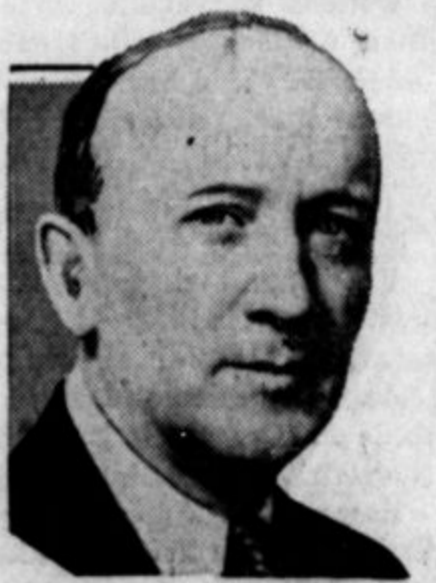
William Z. Foster, ki je dal komunistom Amerike nova navodila, sedaj podpiranje vojne proti Hitlerju.

Prvotna taktika kominterne je bila, zasejati po svetu toliko zmede, pomagati v širjenju in večanju ekonomske krize, in ščuvati sloj proti sloju, smešiti demokracijo in druge "buržvazne čednosti", da bi v tej konfuziji nastala tla ugodna za revolucijo boljševiškega tipa in z njo ustvariti svetovni preobrat v komunizem, kakršnega