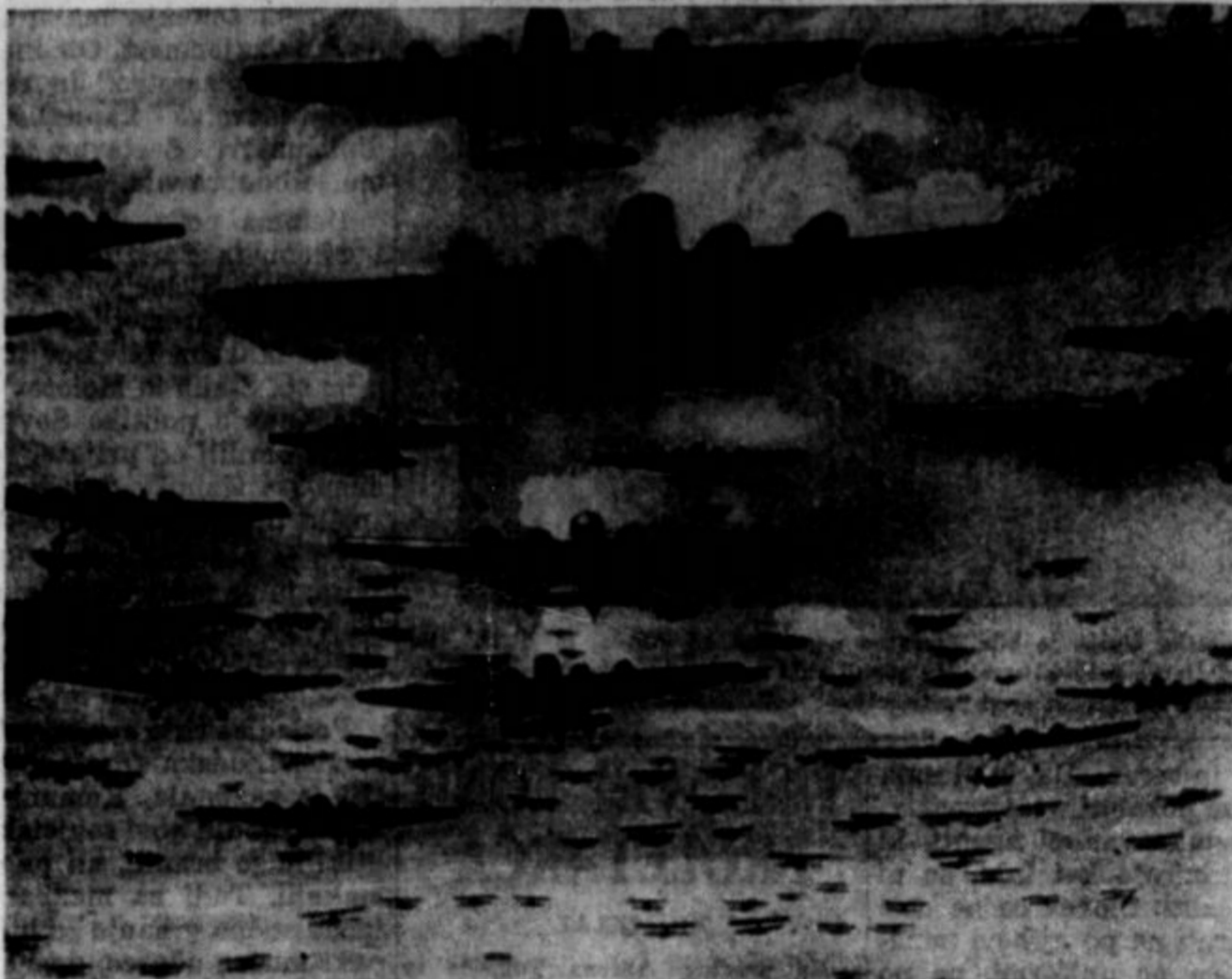
Sovjetska Unija se je z stališča svoje obrambe v resnici oboroževala lo proti dvema volesilama: zoper Nemčijo, s katero je sklenila skrajno ponskreščeni desetletni nenapadalni pakt, in proti Japonski.

Drugim slovenskim pisateljem je bilo pisateljstvo "postranski poklic". Sicer bi naš narod lahko vzdrževal tudi v Ameriki nekaj poklicnih pisateljev, če bi bil tako kulturn, kot pravnik, da je. Ako ima pol milijona dolarjev za Lemont, in ako lahko vzdržuje v svojih župnijah okrog 300 ljudi, bi mu ne bilo preteško dati nekaj opore tudi literatom.