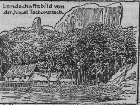
Landschaftsbild von der Insel Tschokatsch.