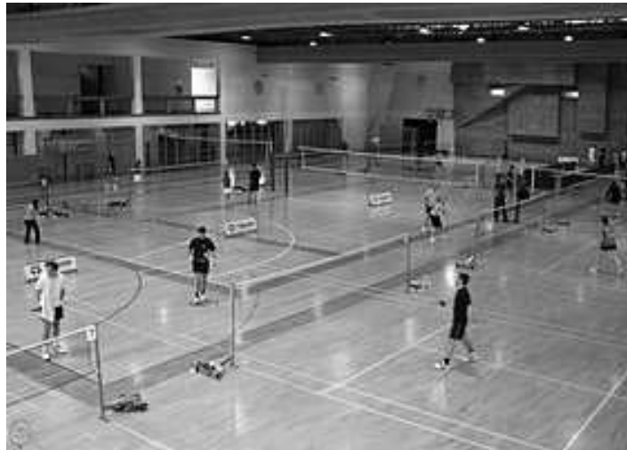
Utrinek z državnega tekmovanja v badmintonu

Športni pedagogi na OŠ Destrnik-Trnovska vas