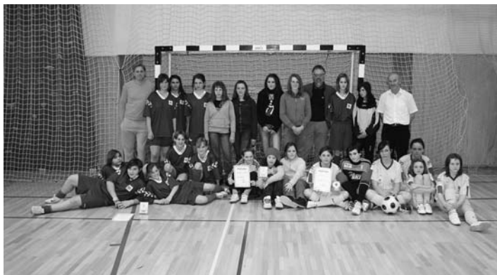
Ekipe, ki so sodelovale na državnem polfinalu na naši šoli

V marcu in aprilu so ekipe naše šole sodelovale na različnih tekmovanjih. Ekipi starejših dečkov je uspel preboj v polfinale državnega tekmovanja v nogometu, ki ga je organizirala in vodila naša šola. Prijazno nas je gostila OŠ Markovci, kjer smo poskušali v konkurenci ekip iz Maribora, Križevcev pri Ljutomeru in Svetega Jurija uresničiti naše sanje in uvrstitve v finale šolskih tekmovanj. Domačo ekipo je oslabila bolezen, fantje so dali vse od sebe, vendar jim je za uvrstitev med najboljše 4 ekipe zmanjkalo moči. Na koncu smo se uvrstili na mesto med 5. in 8. v Sloveniji. Da pa ne bi zaohtajala tudi dekleta, smo na turnirju na OŠ Destrnik gostili moštvi iz OŠ III Murska Sobota in OŠ Tabor I iz Maribora. Z malo športne sreče bi lahko tudi zmagali in z uvrstitvijo v finale branili lansko tretje mesto v Sloveniji. Vendar smo nastopali z najmlajšo ekipo, pred katero je še lepa športna prihodnost. Rezultat je kljub temu presenetljiv in dober. Pred tem smo postali medobčinski in regijski prvaki – v