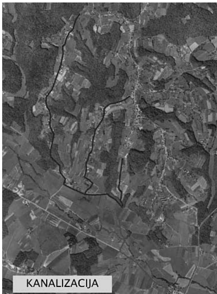
table in brošure občine Destrnik.

V letošnjem letu je predvideno, da bodo s temi sredstvi izvedena delna rekonstrukcija dela ceste (prva plast asfalta) od pokopališča vključno s križiščem v Vintarovcih, prva plast asfalta bo izvedena tudi na cesti od OŠ skozi gozd do potoka, rekonstruiran bo odsek lokalne ceste v naselju Jiršovci od hišne številke 20 do križišča za hišno številko 24, rekonstruiran bo tudi odsek lokalne ceste v naselju Drstelja od hišne številke 9 do križišča ob izhodu iz gozda, rekonstruirana bo tudi javna pot opekarna v dolžini 120 metrov in rekonstruiran bo odsek regionalne ceste od gasilskega doma do križišča v Svetincih za Zasade. Izdelana bo projektna dokumentacija za lokalno cesto skozi naselje Zasadi in odkupljena bodo zemljišča za gradnjo dovodne ceste za terme in zemljišča za obrtno poslovno cono ter zemljišča za čistilno napravo Janežovci. Izveden bo projekt