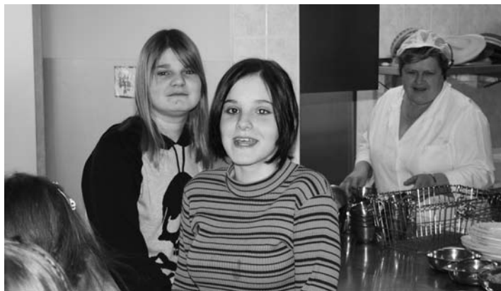
Otroci v jedilnici pri razdeljevanju hrane

Pri načrtovanju prehrane otrok v šolah in vrtcih veljajo enaka načela kot za otroke, ki se hranijo doma. Posameznega otroka je v