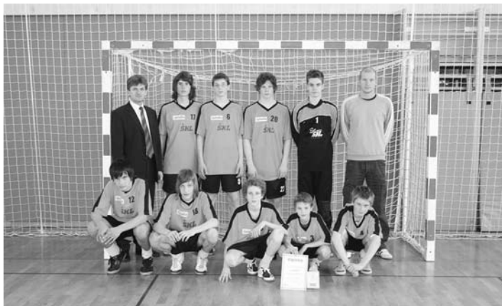
Nogometna ekipa starejših dečkov

V marcu in aprilu so ekipe naše šole sodelovale na različnih tekmovanjih. Ekipi starejših dečkov je uspel preboj v polfinale državnega tekmovanja v nogometu, ki ga je organizirala in vodila naša šola. Prijazno nas je gostila OŠ Markovci, kjer smo poskušali v konkurenci ekip iz Maribora, Križevcev pri Ljutomeru in Svetega Jurija uresničiti naše sanje in uvrstitve v finale šolskih tekmovanj. Domačo ekipo je oslabila bolezen, fantje so dali vse od sebe, vendar jim je za uvrstitev med najboljše 4 ekipe zmanjkalo moči. Na koncu smo se uvrstili na mesto med 5. in 8. v Sloveniji. Da pa ne bi zaohtajala tudi dekleta, smo na turnirju na OŠ Destrnik gostili moštvi iz OŠ III Murska Sobota in OŠ Tabor I iz Maribora. Z malo športne sreče bi lahko tudi zmagali in z uvrstitvijo v finale branili lansko tretje mesto v Sloveniji. Vendar smo nastopali z najmlajšo ekipo, pred katero je še lepa športna prihodnost. Rezultat je kljub temu presenetljiv in dober. Pred tem smo postali medobčinski in regijski prvaki – v