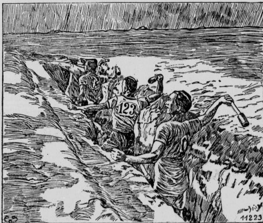
Vaja za metanje ročnih granat.

Po zmagi ob Kut el Amara je angleška stvar v Mezopotamiji končana. An-