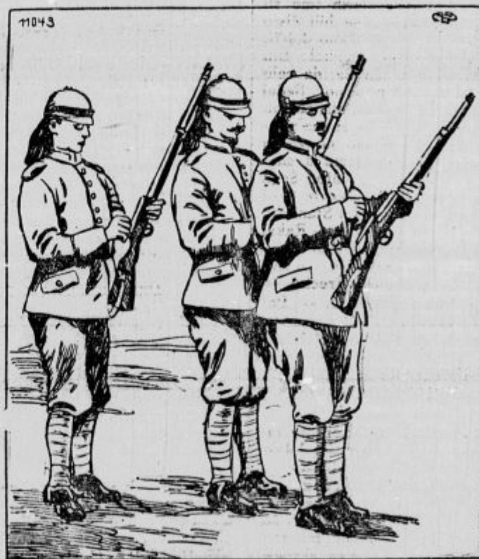
Nemški infanteristi v novi opremi.

Z veseljem in ponosom odhajamo spet v bojno črto, kjer se nam nudi toliko zanimivosti. Gremo, da pomagamo prekrižati račune hinavskemu Lahu.