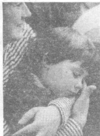
Medtem ko so odrasli znogli toliko moči, da so vzdržali do konca, so si nekateri najmlajši vzeli čas za dopoldanski počitek.