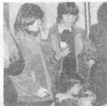
Kot se po slovenski ljudski šegi spodobi, je bil tudi po otvoritvi osnovne šole na Škofljici na voljo dober prigrizek. Za vse. Nadvse okusne sendviče in krofe so pripravili v bližnji gostilni, domači zeliščar pa je prispeval okusno pijačo. Šolarji, krajanje in šolsko vodstvo upajo, da bo taka povezava s šolo trajna.