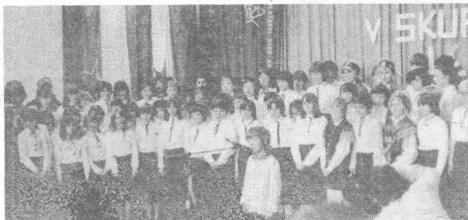
1945. leta je postala šola na Škofljici samostojna. Krajanje so z udarniškim delom zgradili zgradbo, v kateri je bilo takrat okrog sto učencev in učenk. Hitri razvoj Škofljice je prehitel prostorske zmogljivosti šole. Okrog 400 otrok je z učitelji in ostalim kadrom na šoli kljub zelo težkim delovnim pogojem dosegal na šolskem in izvenšolskem področju prav zavidljive uspehe. Ti so prav gotovo tudi rezultat dobrega sodelovanja šole s starši in krajem. Tudi na otvoritveni slovesnosti so sedanji in nekdanji šolarji s Škofljice dokazali, da je ta šola resnični hram lepega v besedi, glasbi in plesu.