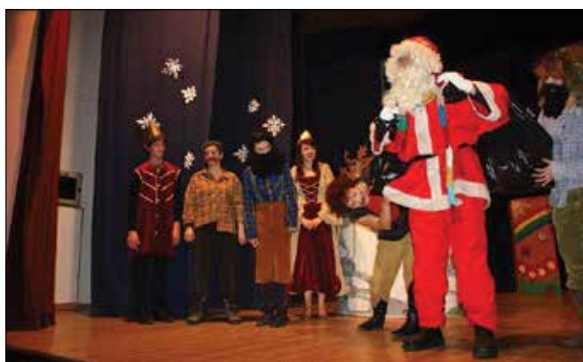
Na Rečici ob Savinji so Božičku pomagali člani gledališke skupine Do zvezd.