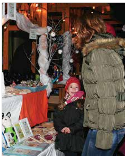
Na božičnem bazaru v Mozirju se je našlo za vsakogar nekaj.

Rahlo porednost je čudežni prstan pokazal, vendar na otrocih ne tako velike kot pri starših. Prejeli so vsak svojo kazen in ob obljubi, da se bodo poboljšali, kljub temu dobili zagotovilo,