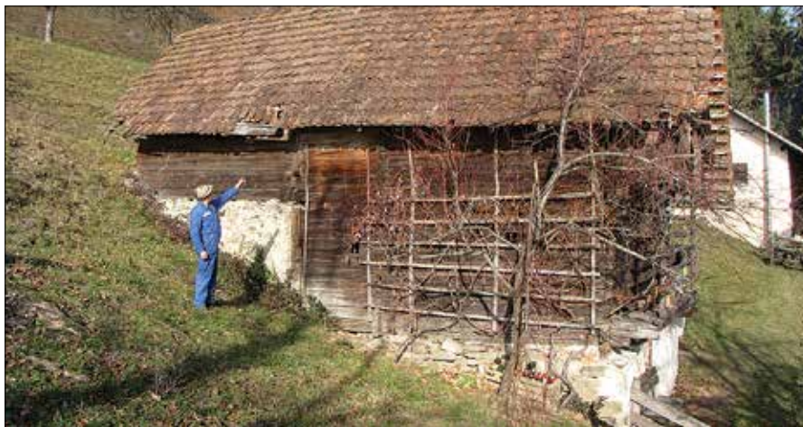
Prastaro kaščo čaka temeljita obnova.