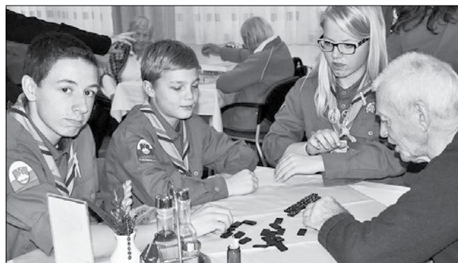
Skavti so obljubili, da pridejo na obisk z Miklavžem tudi prihodnje leto.