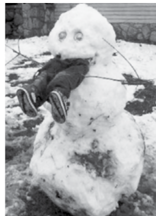
Oče je naredil snežaka, ki odganja sosedove otroke z našega dvorišča.

Meni smučanje ne gre od rok. Z nogami še nekako gre, a roke mi kar naprej vtikajo palice pod smuči in potem je veliko popravljanja smučišča za mano. Želim si, da bi mi Božiček kaj od teh smučarskih daril odnesel.