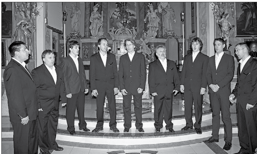
Mozirski koledniki so pripravili pester program in z njim navdušili občinstvo.

MOZIRSKI SKAVTI OBISKALI STAREJŠE V GORNJEM GRADU