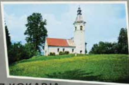
POZDRAV IZ KOKARJA