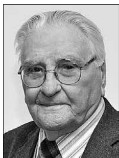
Piše: Aleksander Videčnik