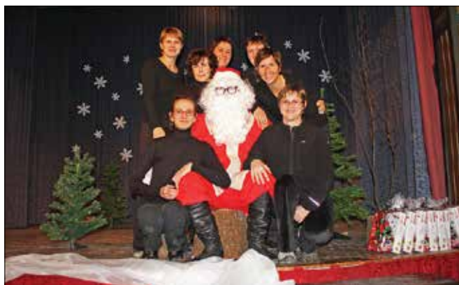
Na Ljubnem ob Savinji so program za malčke Božičku pomagale pripraviti sodelavke iz tamkajšnjega vrtca.