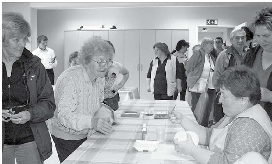
Uporabniki enote Vrba VDC SAŠA obiskovalcem radi predstavijo svoje dejavnosti.