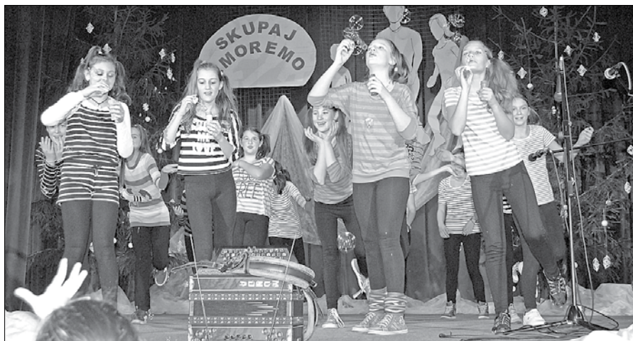
Plesalke iz plesnega krožka na gornjegrajski šoli so točko zaključile s pihanjem mehurčkov.