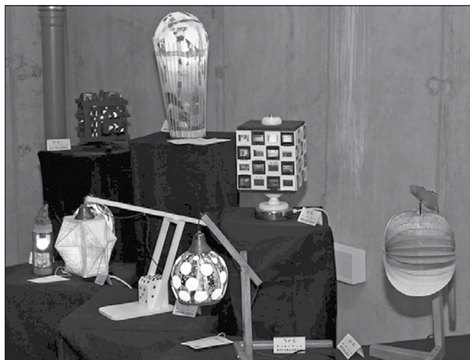
Iz že odpisanih ali neuporabljenih predmetov so mladi strokovnjaki in umetniki izdelali zavidljivo privlačne in koristne kose bivalne opreme

V okviru tega projekta so člani, v društvu jih deluje okrog 40, predelali in preoblikovali kose bivalne opreme, da so ti zaživel v drugi funkciji in z obnovo dobili novo vrednost. Materialom, pohištvo ter drugim predmetom, ki jih ljudje ne uporabljajo več, so dali novo, ino-