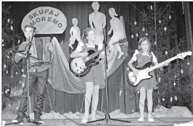
Ansambel Mika nas osvaja publiko ne le na domačem odru, temveč tudi širom Slovenije z nastopom v oddaji Raketa na Planetu.