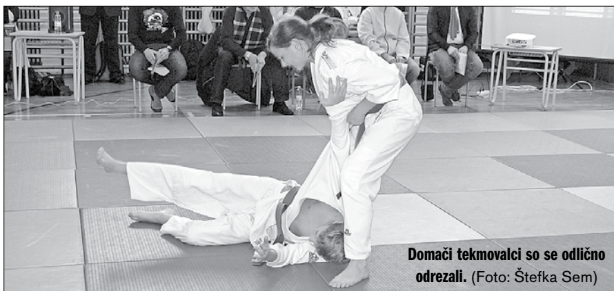
Domači tekmovalci so se odlično odrezali.