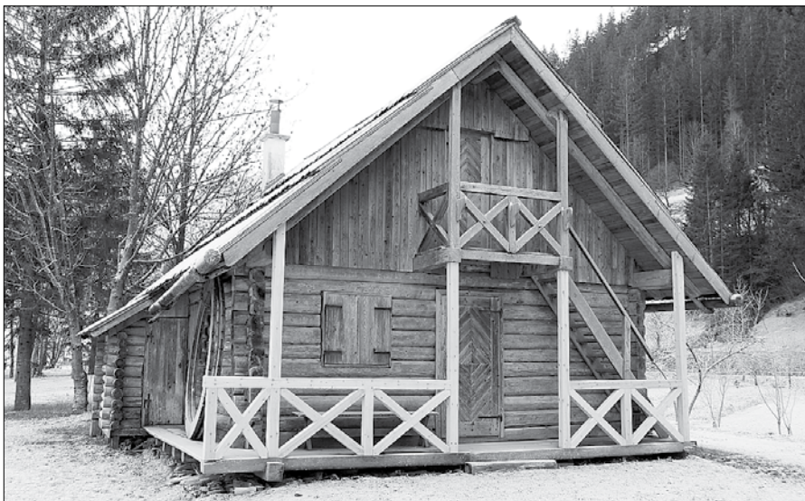
Lepo vzdrževana koča ob jezu je sedaj v lasti Občine Luče.