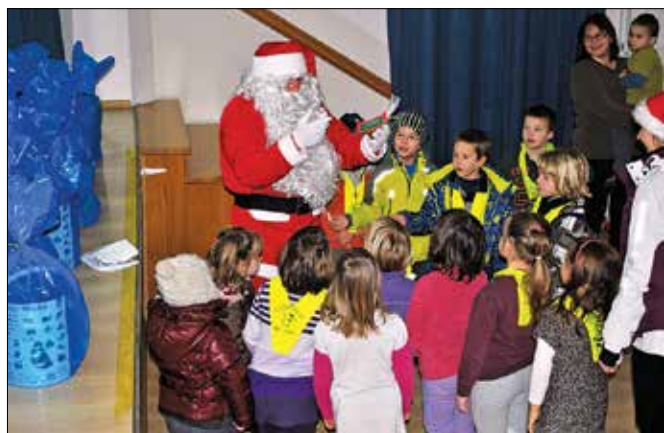
Takole je Božiček obdaroval otroke v Lučah ...