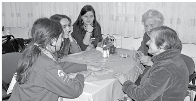
Skavtinje pri igrah z varovankami Centra starejših Gornji Grad