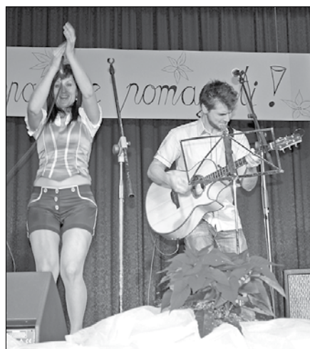
Ansambel Čar je s svojo glasbeno točko navdušil občinstvo v prepolni dvorani.