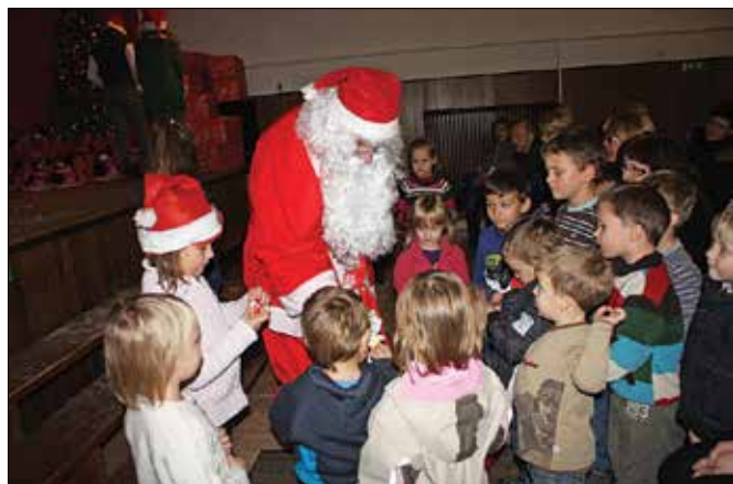
... in takole v Gornjem Gradu.