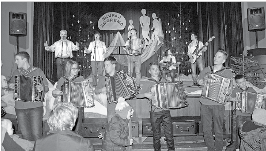
Zaključek dobrodelnega večera je pripadel Zvirskim harmonikarjem in družinskemu ansamblu Zavolovšek.