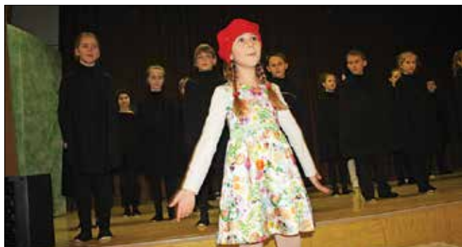
V Šmartnem ob Dreti in Nazarjah je bila poleg Božička v glavni vlogi Rdeča kapica.