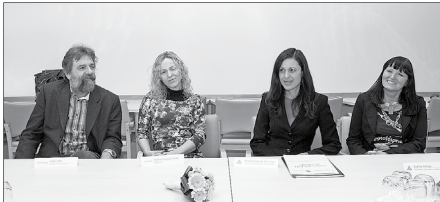
Na Ljudski univerzi Velenje so predstavili rezultate pet let trajajočega projekta Center vseživljenjskega učenja.