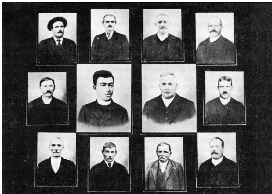
Ustanovni člani Ljudske hranilnice in posojilnice na Rečici ob Savinji ob dvajsetletnici poslovanja leta 1929

Na Rečici ob Savinji so že od nekdaj sprejemali napredne zamisli. Leta 1899 so sklicali občni zbor za ustanovitev lastnega denarnega zavoda. V ljudeh je klila združna miselnost,