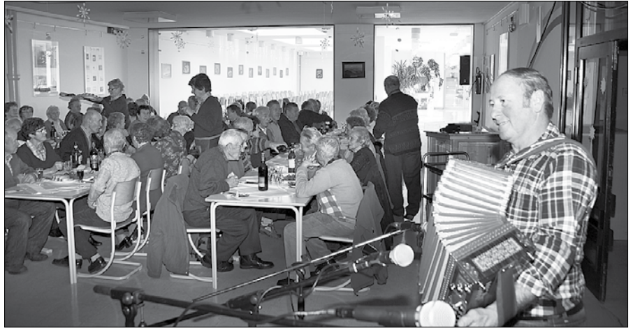
Ljudski godec je za dobro vzdušje vedno dobrodošel.

LUČKI UPOKOJENCI PODARILI VESELI VEČER STAROSTNIKOM V VOJNIKU