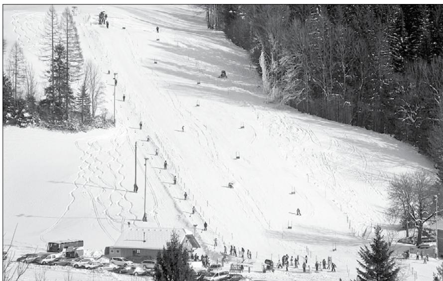
Smučišče v Logu je odprto tudi preko božično-novoletnih praznikov.