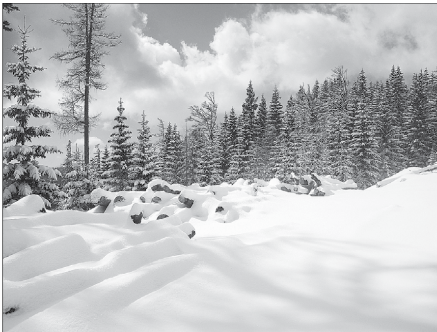
Debela snežna odeja ovira gibanje živalim.

Kadar se skozi zimsko, zlasti gorsko naravo premika večja skupina ljudi, na primer planincev na zimskem pohodu, so ponavadi bolj glasni, zvoki prihajajo z različnih strani in živali postanejo vznemirjene. Zato se je treba zimskim pohodom v največji možni meri izogibati, zlasti v bolj odročnih predelih, kjer si živali poiščejo mirne cone. Tudi pohodi v zgodnjih jutranjih urah in v večernem mraku niso zaželeni.