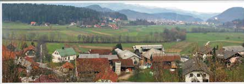
Z malce truda smo poiskali lokacije in naredili kolaž fotografij za novo razglednico. Del Kokarj je postal zaradi novogradenj celo v tako kratkem časovnem razdobju skoraj neprepoznaven.