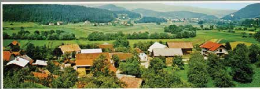
Kokarje na razglednici, ki je bila narejena v osemdesetih letih prejšnjega stoletja.