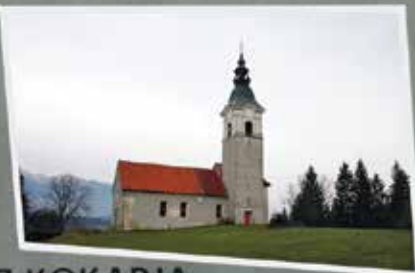
POZDRAV IZ KOKARJA